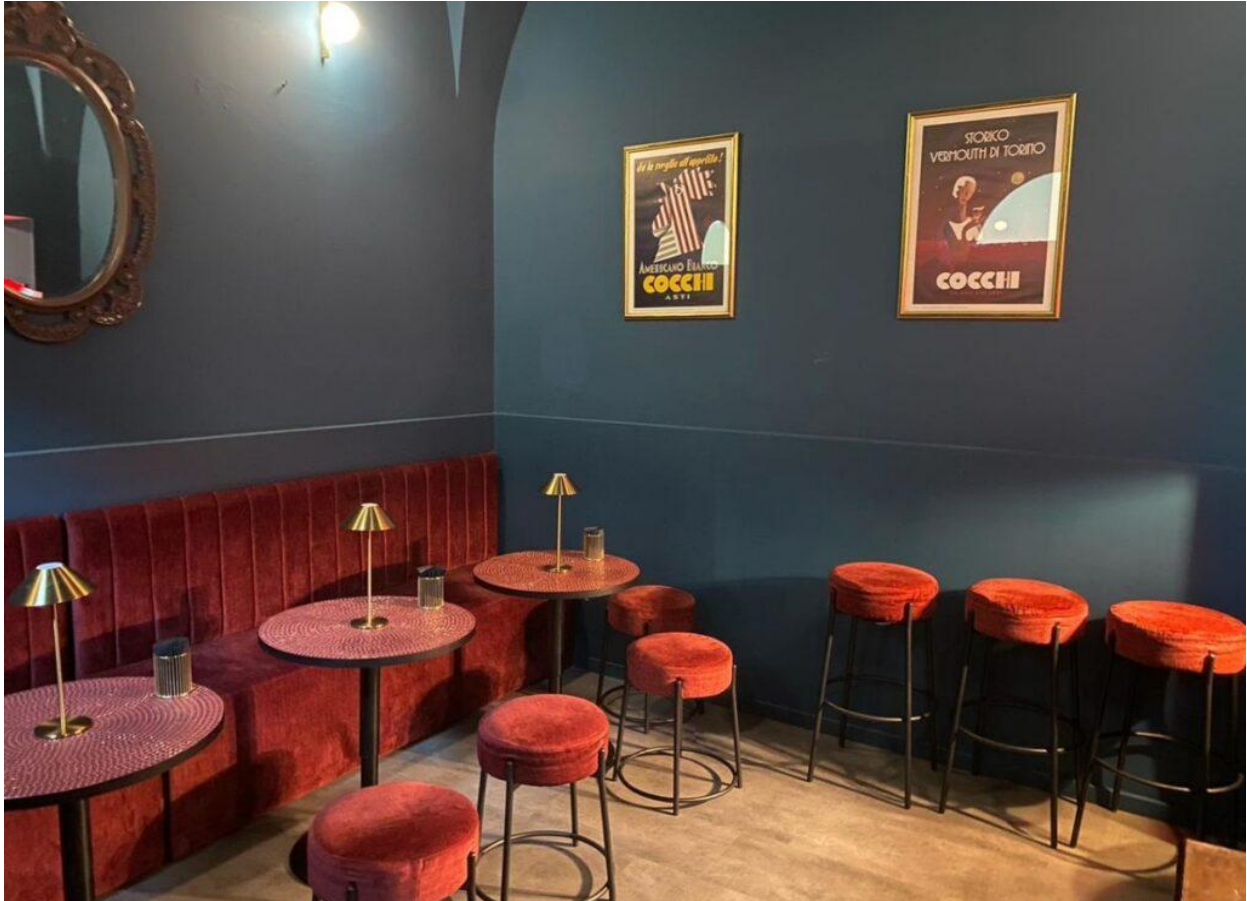
Un particolare del locale di Daniele De Angelis.