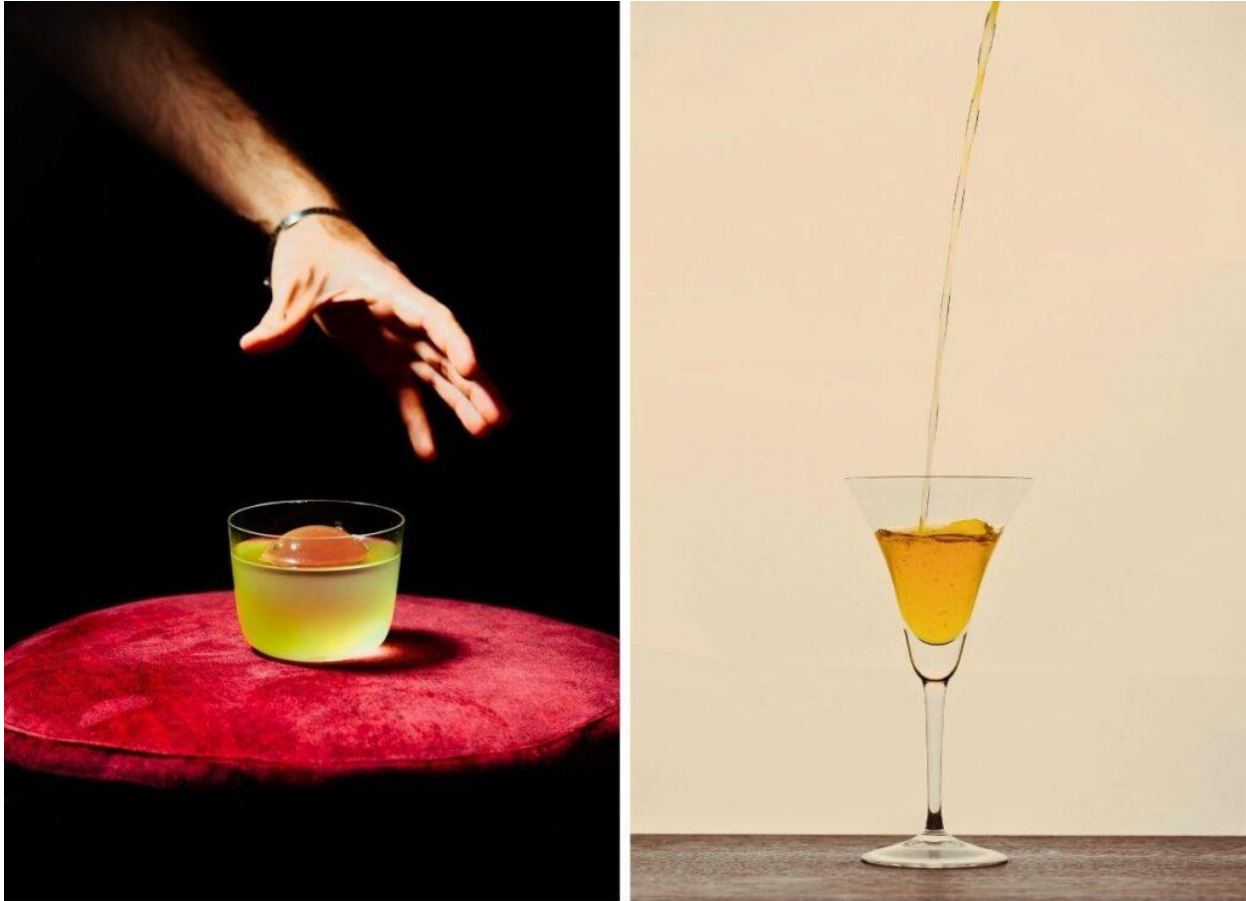
Alcuni drink presenti in carta.