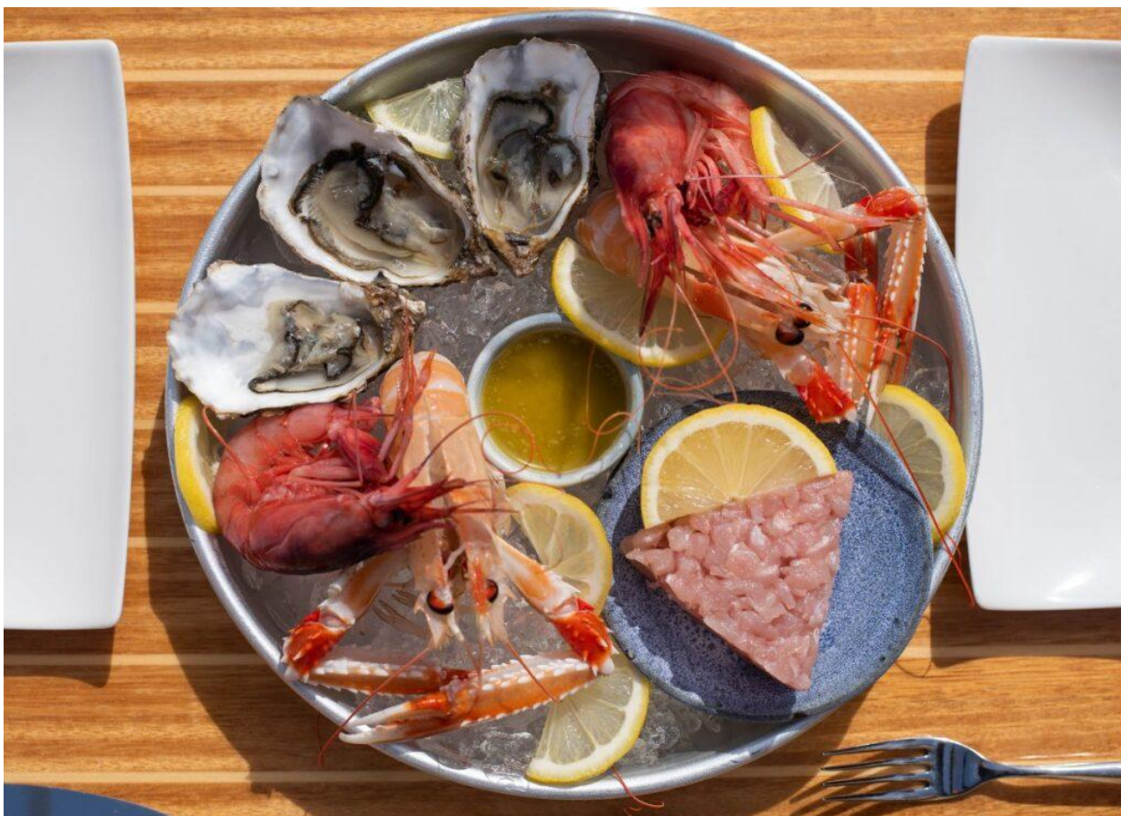
Plateau di crudi di O? Magazín?n Ristorante (Foto © Ufficio stampa).

Uno dei grandi punti di forza del ristorante è la carta dei crudi . Le ostriche, i gamberi e gli scampi di Santa Margherita Ligure sono serviti freschissimi. Le diverse tipologie di ostriche , le Regal selezione oro, le Marie Morgan e quelle di San Michele, offrono un ventaglio di sapori veramente completo, dalla dolcezza dello zucchero di canna alla mineralità estrema, passando per le note vegetali e di frutta secca. Il plateau di crostacei e tartare , con l'opzione di aggiungere il caviale , è il non plus ultra per gli amanti del crudo.