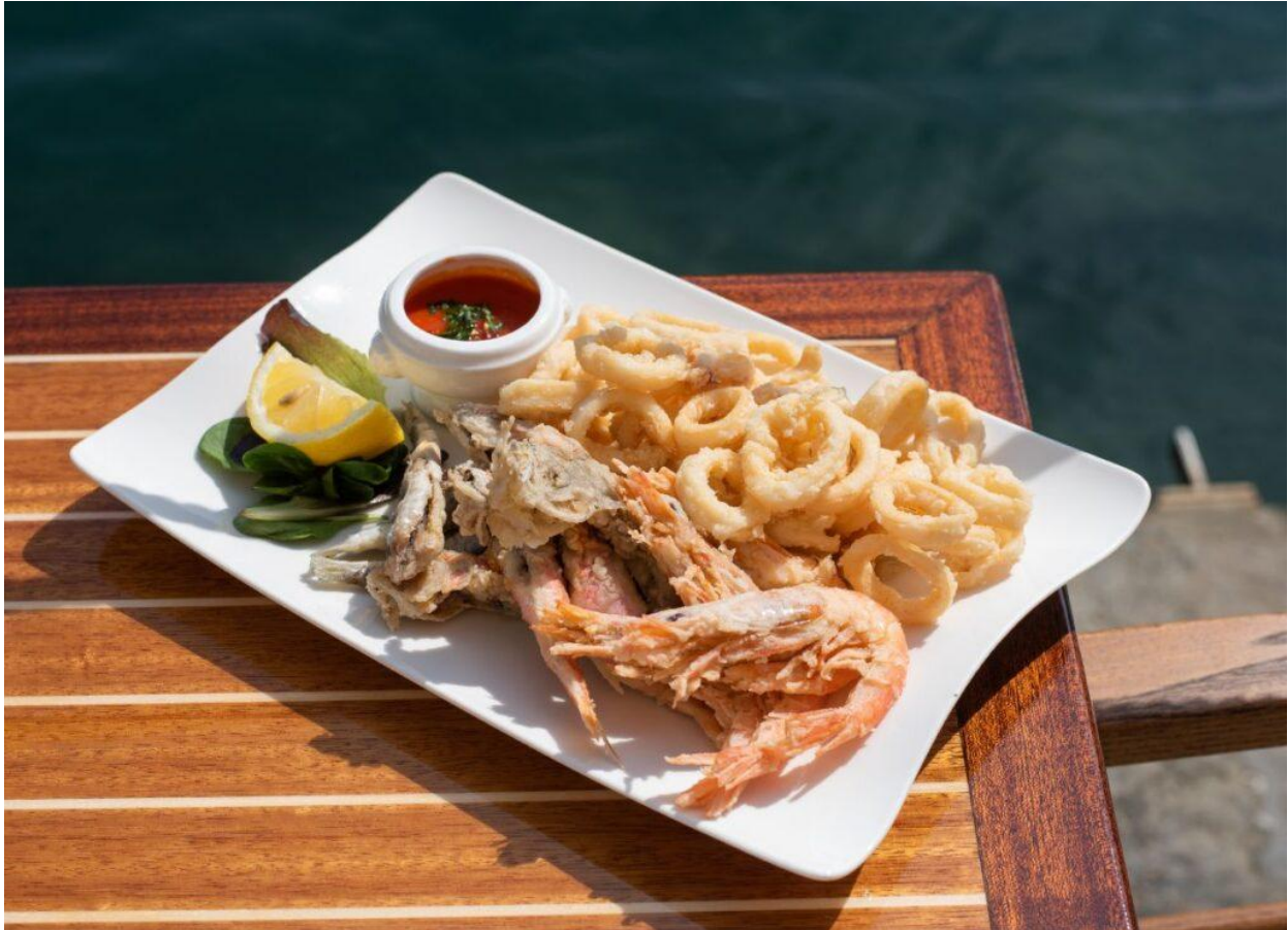
Il fritto misto di pesce con salsa marinara piccante.

Il resto della proposta varia in base alla stagionalità e alla disponibilità delle materie prime. Gli antipasti spaziano dalle cozze al Pigato e profumo di limone alla ceviche di ricciola con pomodori freschi , un piatto che unisce la tradizione sudamericana ai sapori mediterranei. Nei primi piatti, le tagliatelle ai frutti di mare e le pappardelle portofino offrono combinazioni classiche ma sempre apprezzate, mentre gli gnocchi di patate al pesto sono un omaggio alla tradizione ligure.