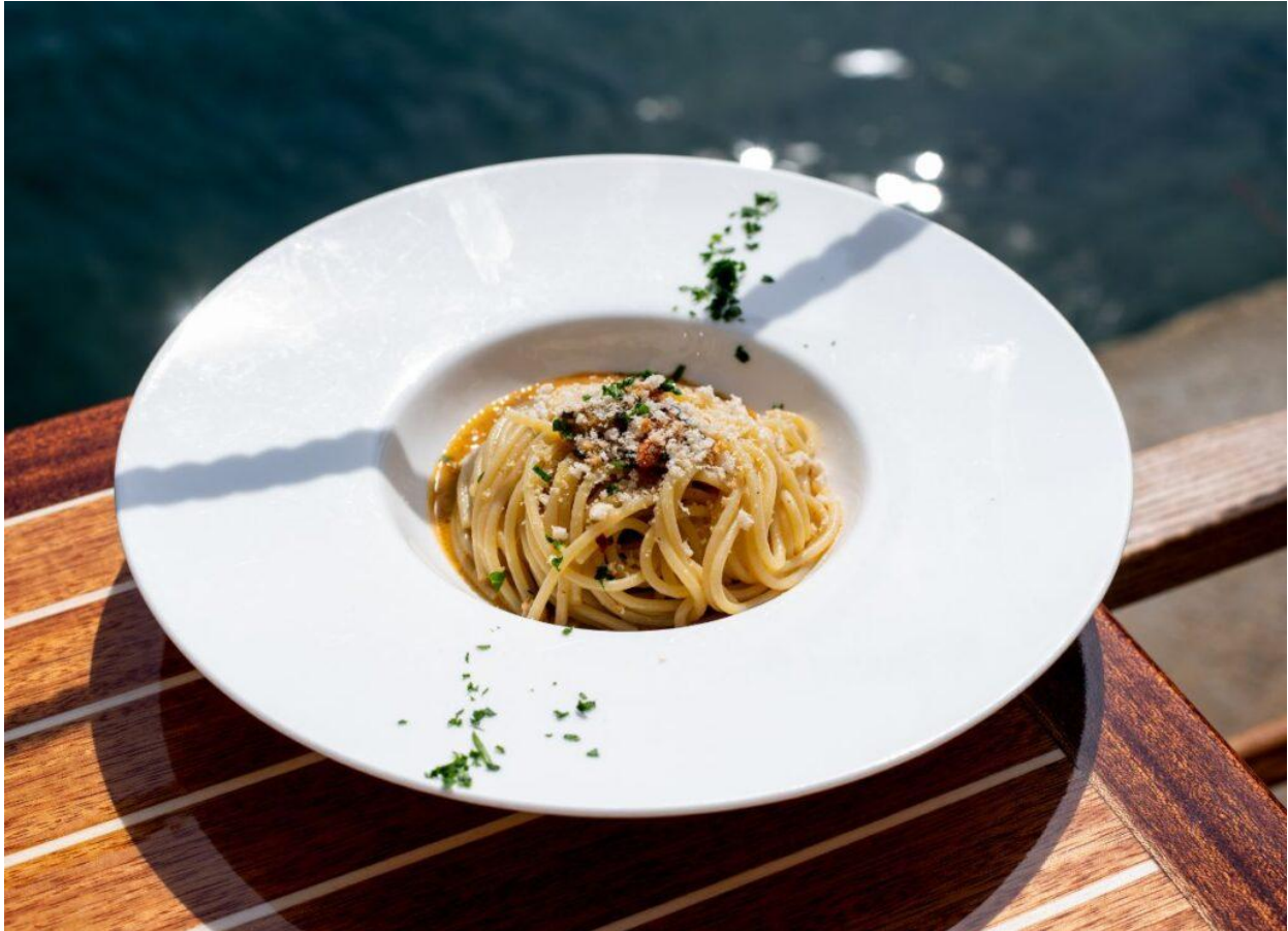
Spaghetti magazín, con crema di cozze, peperoncino e pangrattato.