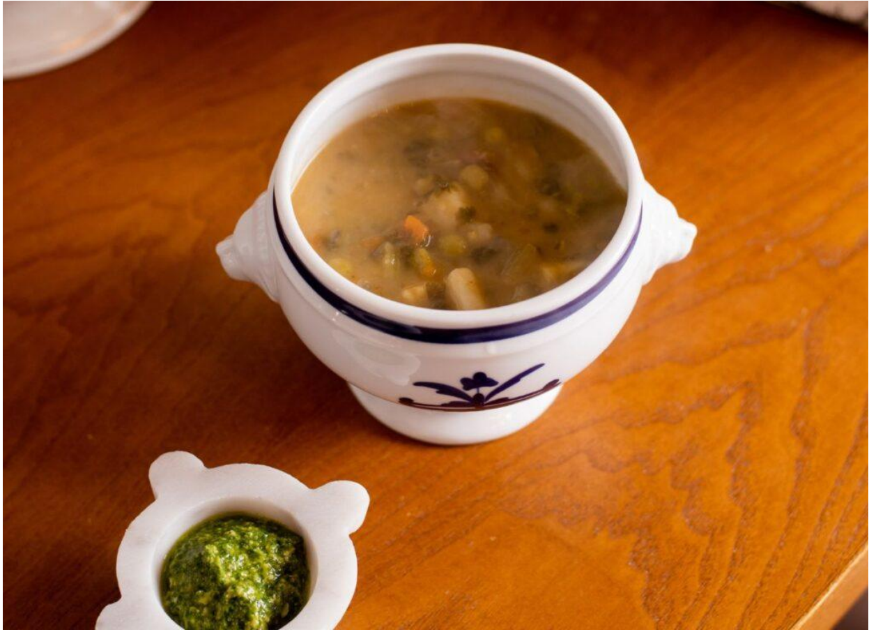
Menestrün alla genovese con pesto al mortaio.