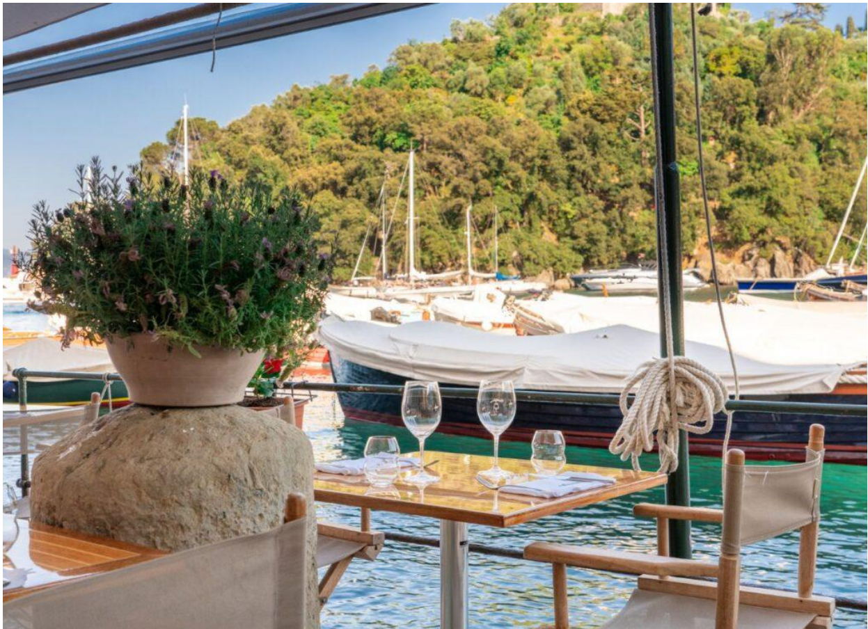
La vista dal ristorante Ö Magazín a Portofino.

Nel 1990, le due sorelle hanno deciso di dare una nuova vita a un vecchio magazzino di Portofino , un tempo utilizzato per le reti e le attrezzature da pesca, trasformandolo in un ristorante. Così è nata la prima e storica sede di Ö Magazín, un nome che in dialetto ligure significa “ il magazzino “, un ristorante rapidamente diventato un punto di riferimento per chi ama la buona cucina, grazie anche alla sua posizione incantevole sulla costa ligure .