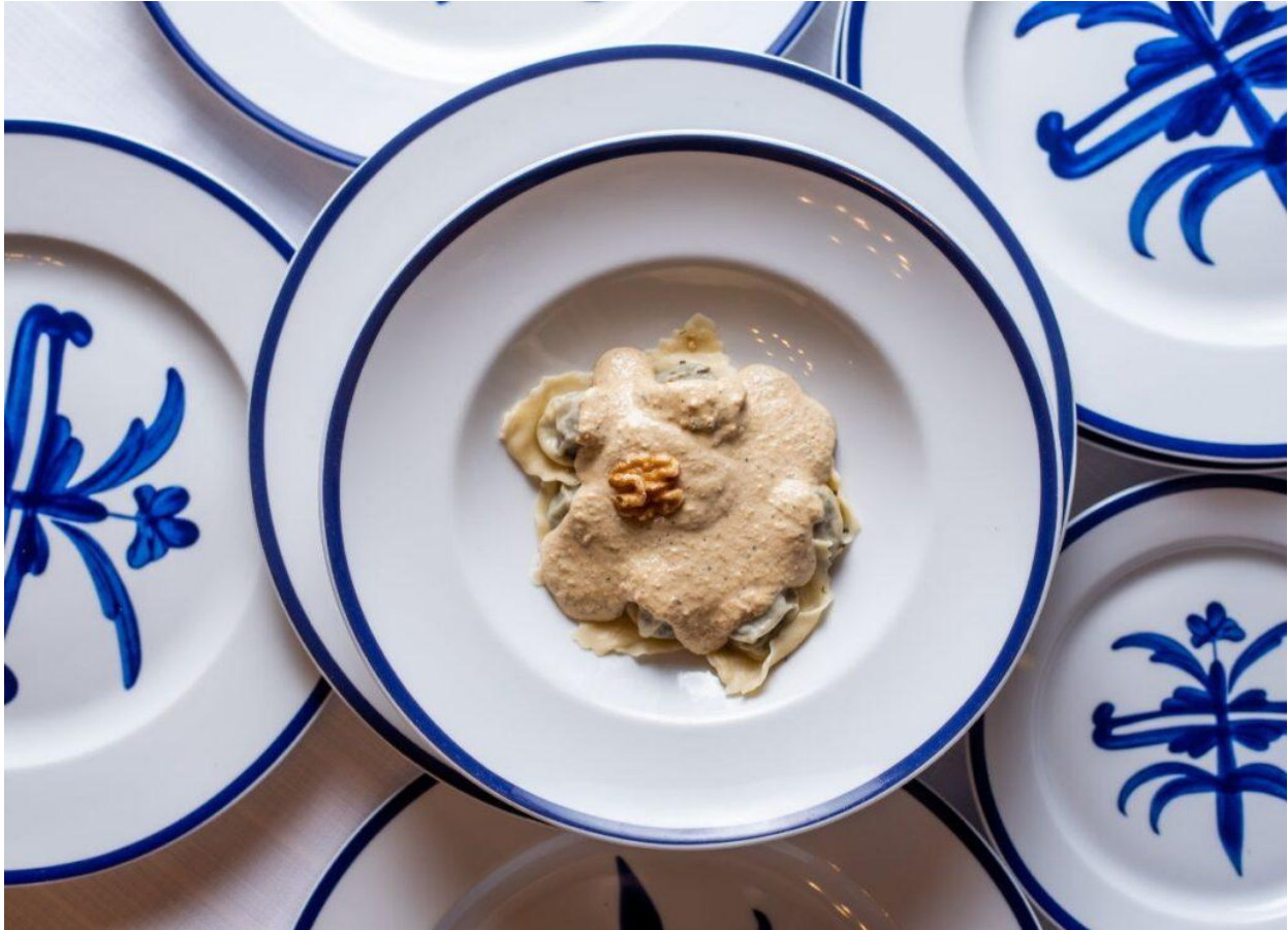
Pansoti con salsa di noci.

Tra i secondi piatti, il coniglio alla ligure in bianco con olive e pinoli , le seppie in zimino con ceci e bietoline e il pesce (orate o branzini) in tocchetto con pomodori, olive e pinoli, che esaltano la freschezza del pescato locale.