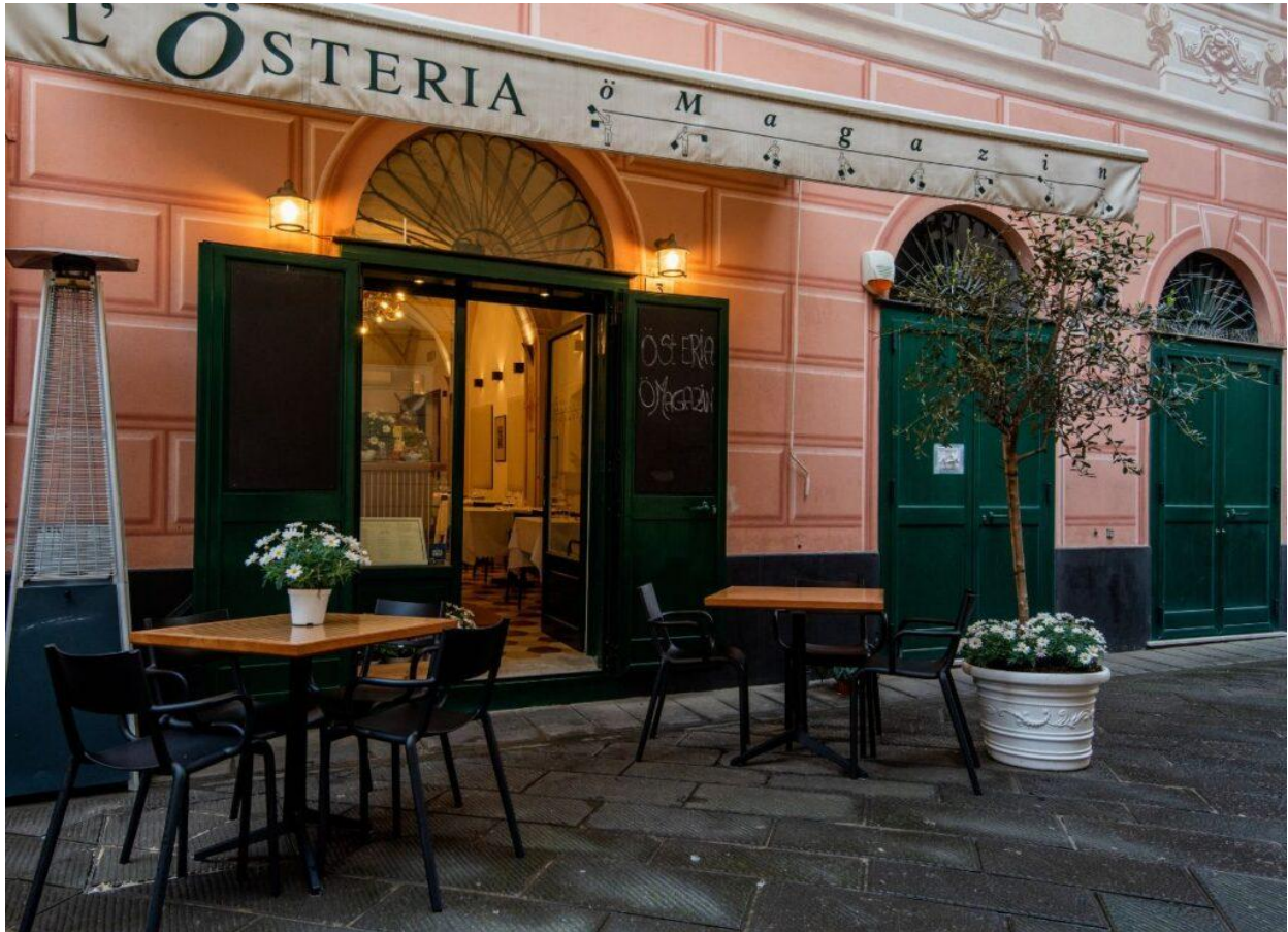
L'esterno di Ö Magazin Österia, a Santa Margherita Ligure.