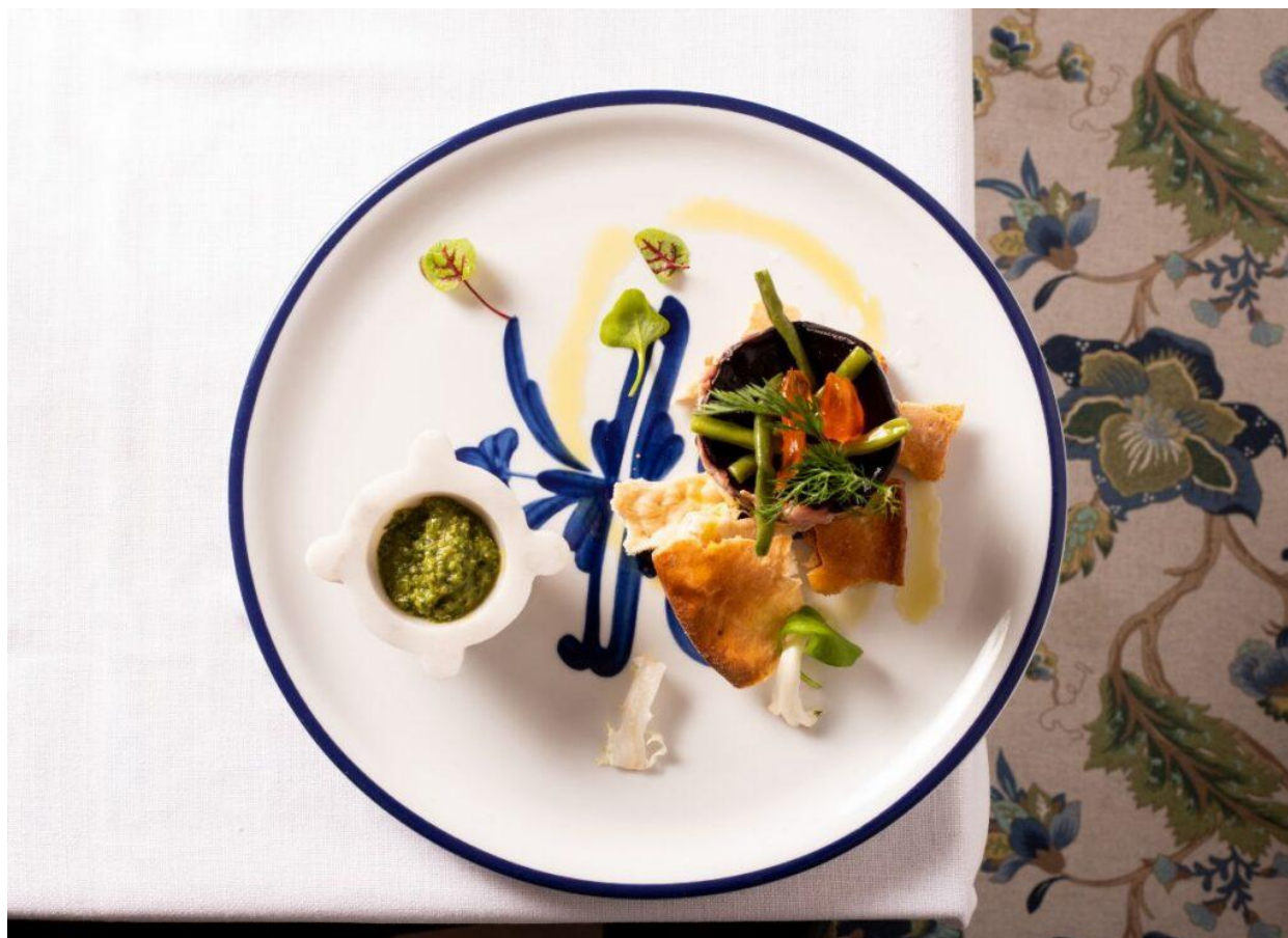
Il Cabòn magro o cappon magro.

Tra i primi piatti il menestrùn alla genovese , servito tiepido e accompagnato da pesto al mortaio racchiude tutta la freschezza degli orti liguri. I pansoti con salsa di noce sono un altro piatto simbolo della cucina regionale, dove la delicatezza della pasta ripiena si sposa perfettamente con la cremosità della salsa alle noci. I ravioli con il tocco alla genovese , preparati con stracotto di cabannina (razza bovina autoctona della Liguria) al Rossese cotto in terracotta, sono un assaggio intenso e ricco di tradizione.