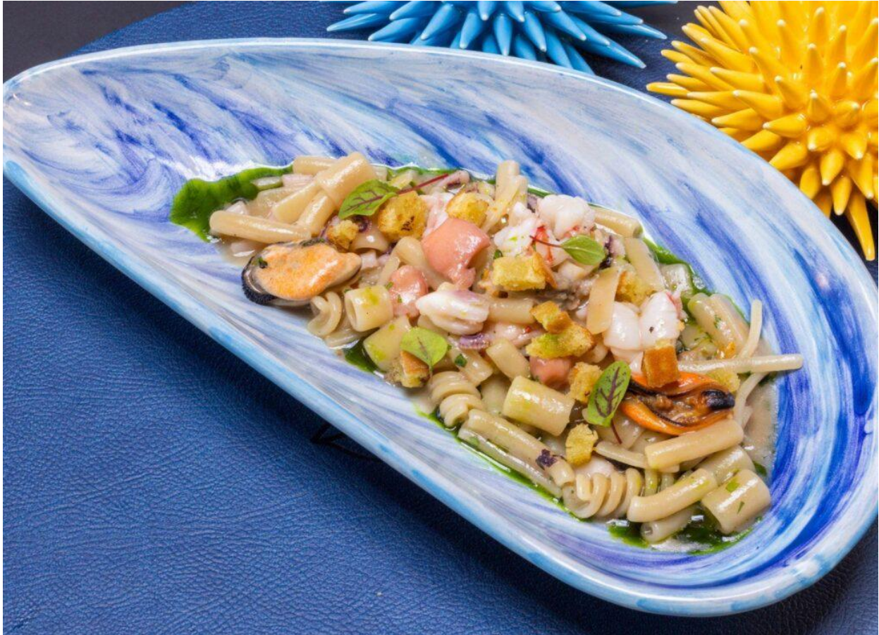
Pasta e patate con ricciola affumicata, polpo e ricci di mare.

Anche la carta dei vini offre un'ampia scelta di etichette che, dal territorio campano, si trasferiscono verso i migliori terroir piemontesi, senza trascurare il resto dell'Italia e della vicina Francia.