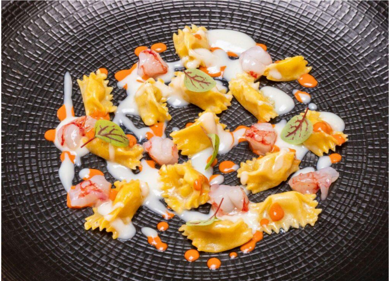
Plin cacio e pepe con crudo di gamberi.