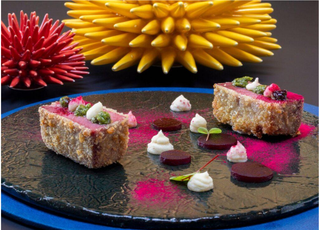
Lingua fritta con salsa verde, purea di sedano rapa e barbabietola.