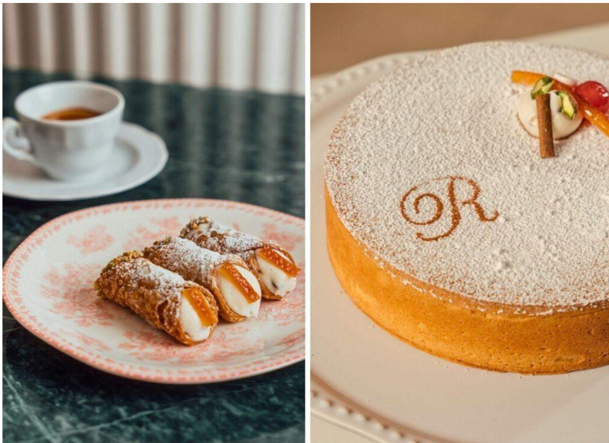
Cannoli con scorze di arancia candita e Cassata al forno siciliana.