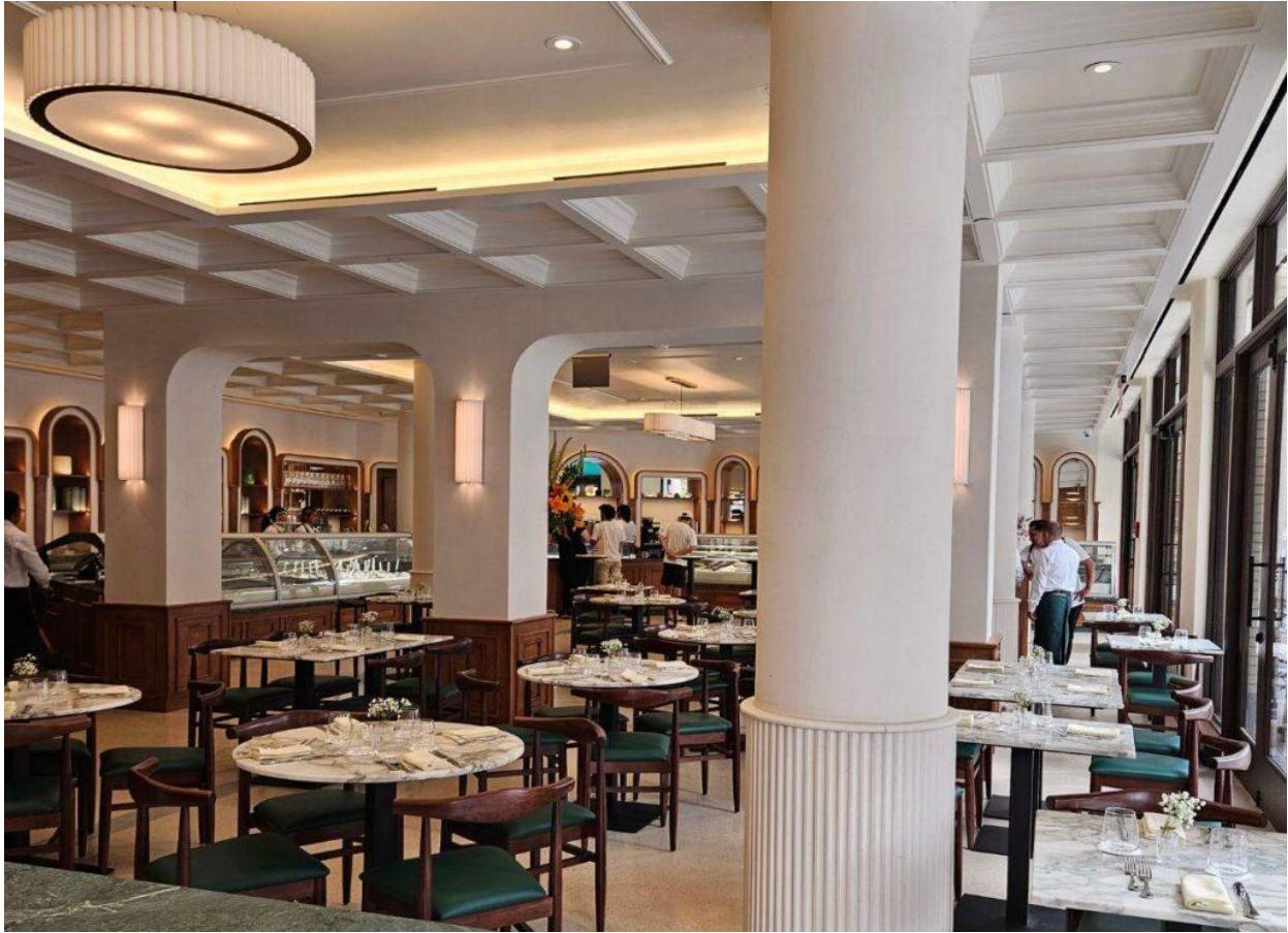
La sala progettata dall'architetto Deborah Mariotti.

lifestyle italiano degli anni '70 e '80 dove iniziava a delinearsi l'attenzione alla cultura del cibo e all'accoglienza. La prima inaugurazione è stata nell'elegante quartiere West Village.