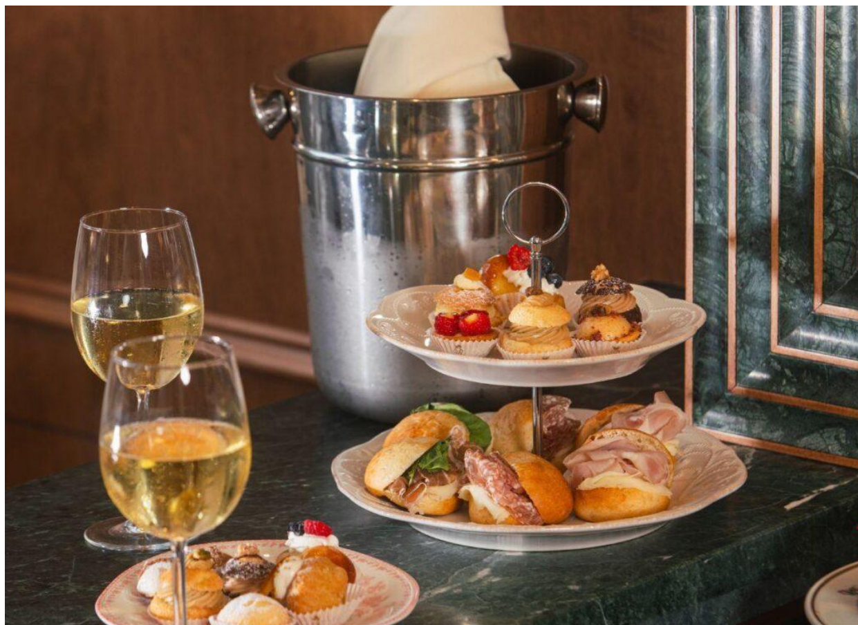
L'aperitivo Italian style.