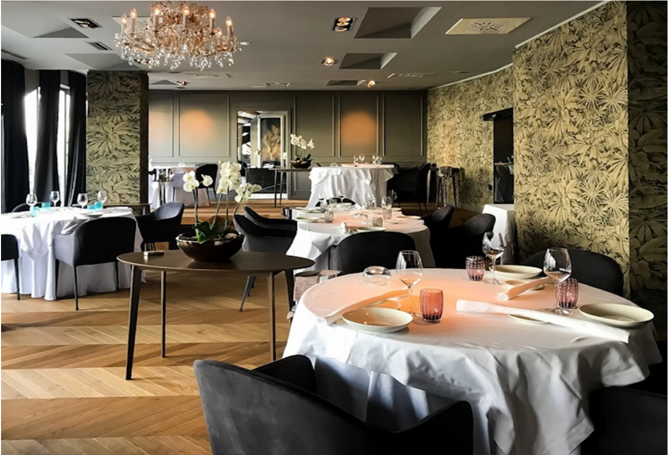
La sala del Ristorante DAM (Foto © Kevin Feragotto).

A ridosso del confine tra Italia e Slovenia , nella piccola città di Nova Gorica , si trova il ristorante DAM del giovane chef Uros Fakuc , uno dei principali esponenti della JRE – Jeunes Restaurateurs of Europe , l'associazione che incentiva la solidarietà, l'amicizia e lo scambio di idee ed esperienze fra i cuochi più innovativi.