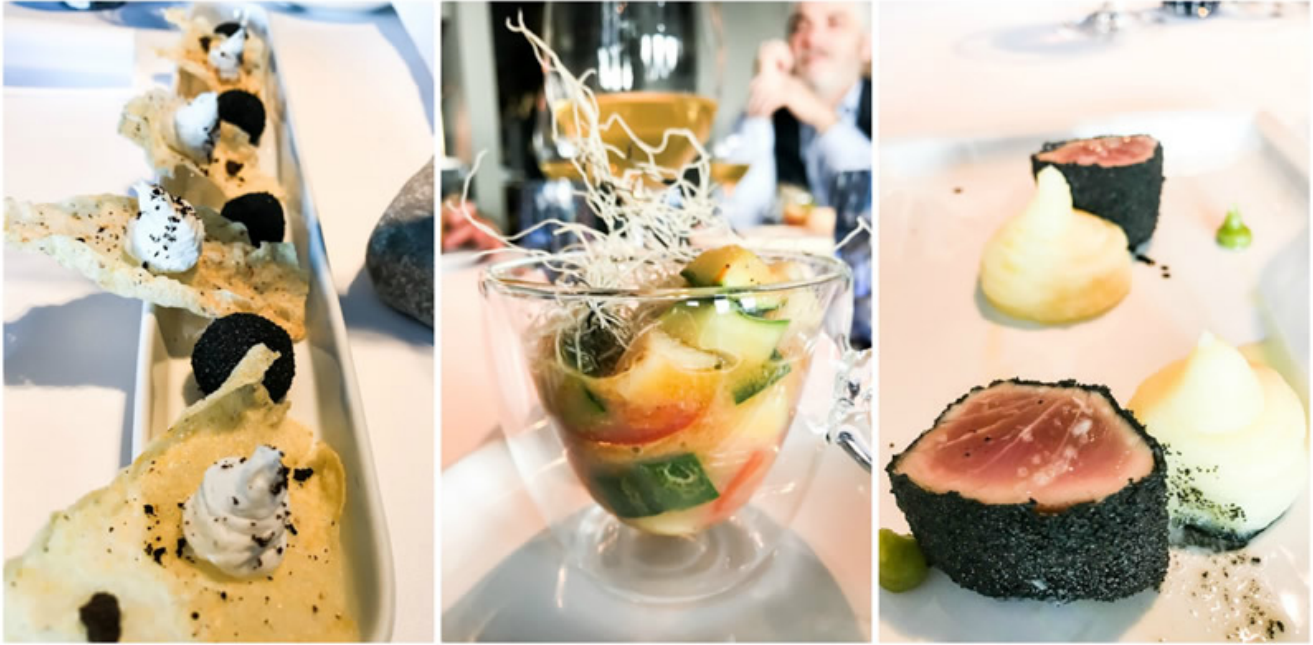
Alcuni piatti dello chef Uros Fakuc.

L'olio e il sale di Pirano, serviti con un filetto d'acciuga, fanno da prologo e sono seguiti da una scenografica entrée con tramezzini croccanti a base di olive e rosmarino , "finti tartufi" (cuore di formaggio morbido con granella di tartufo) e baccalà mantecato su nuvole di polenta .