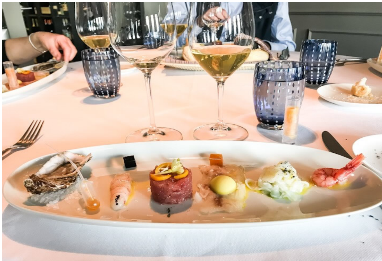
La crudité.

Il pranzo prosegue con un' insalata calda di capesante , colorata e dal sapore deciso. Poi, per un attimo, ci allontaniamo idealmente dalla costa per dirigerci verso l'entroterra, per assaggiare un uovo cotto in crosta integrale su crema al tartufo .