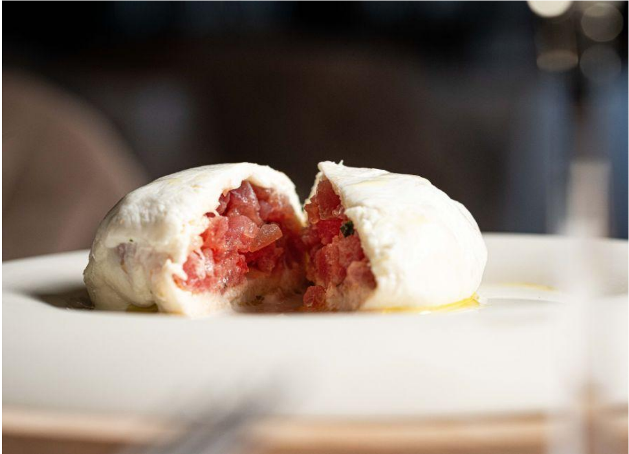
Mozzarella con tartare di tonno, capperi di Pantelleria e pomodoro di Sorrento.