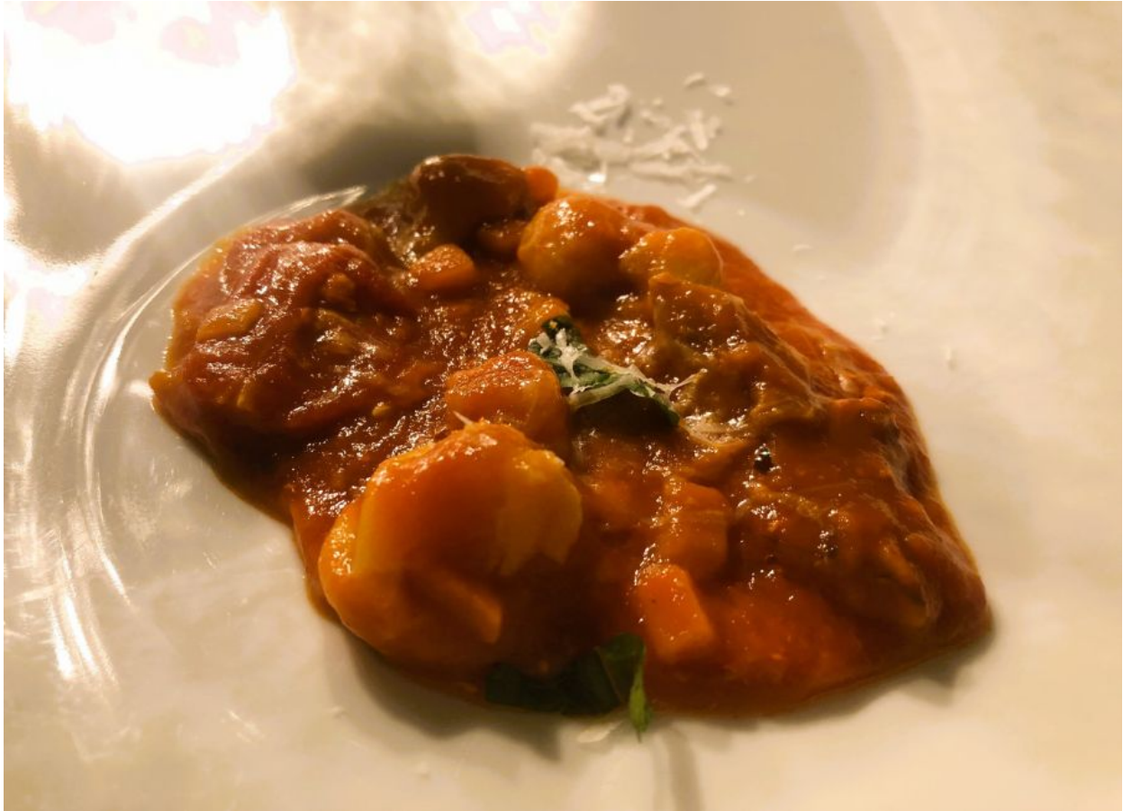
Trippa di baccalà, dedicata alla tradizione romana.