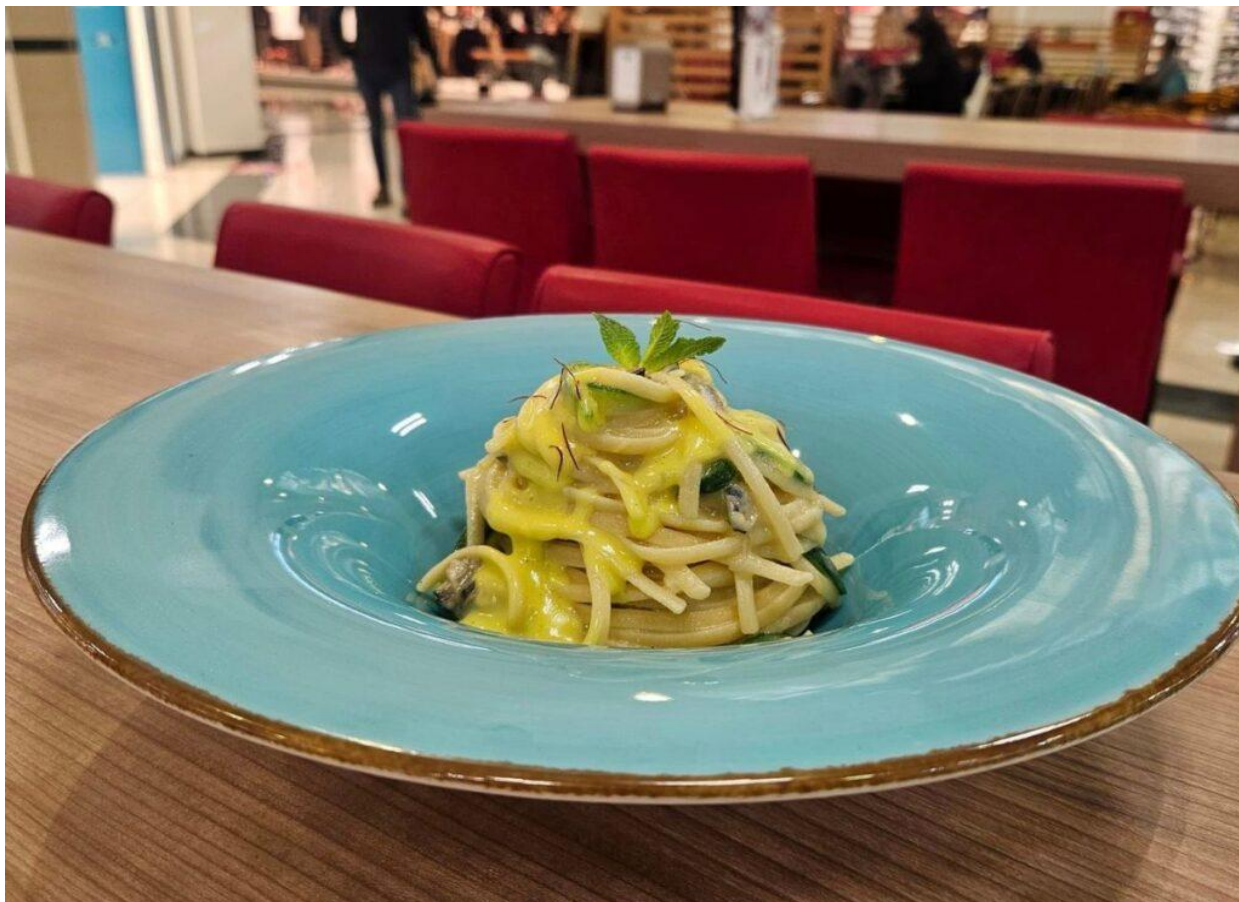
Sapore Mediterraneo è anche cucina di mare.

Sapore Mediterraneo demolisce il falso mito del centro commerciale come luogo di pasto fuggente e di fast food. Si realizza, invece, un'operazione non solo gastronomica ma culturale che promuove un ritorno all'alimentazione tradizionale e, con essa, ad uno stile di vita più consono all'esigenza di privilegi perduti.