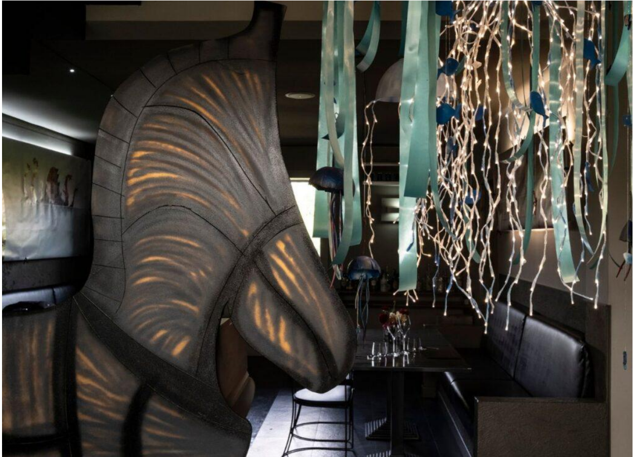
Gli interni del ristorante Satricvm.