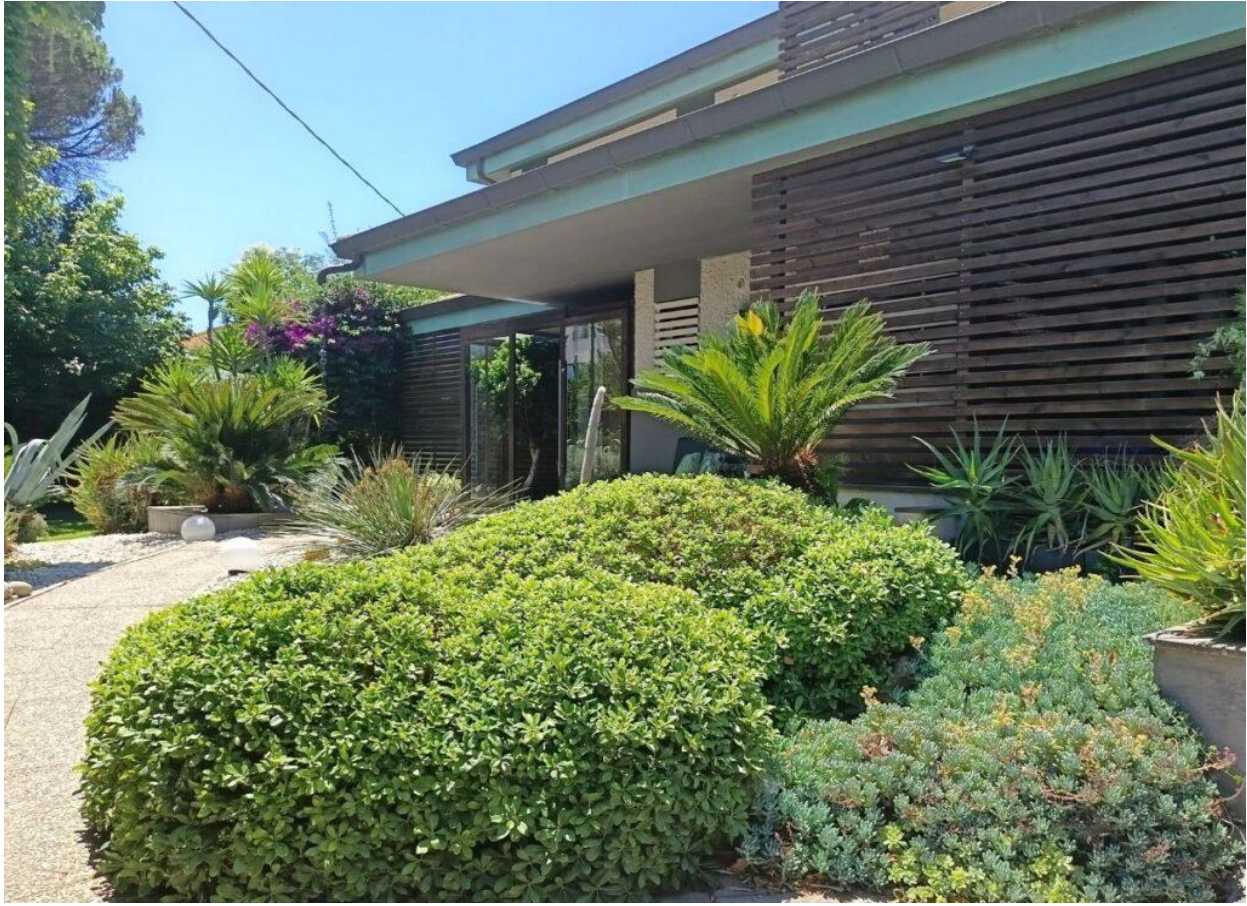
L'esterno del Satricvm.