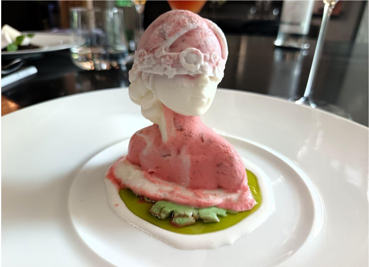
“Calipso”, il dessert con rosa di Damasco e olio di salvia.

Le “ Colonne d’Ercole ” sono rievocate da un cremoso all’argan, arricchito dalle note resinose della mirra e dalla croccantezza salata delle olive. Chiude la piccola pasticceria de “ L’Olimpo ” che corona il menu con delizie come i maamoul di mandorle e datteri, biscotti mediorientali dalla texture sabbiosa e sapore dolce e speziato, e i babà all’ arack , soffici e imbevuti del caratteristico liquore anisato.