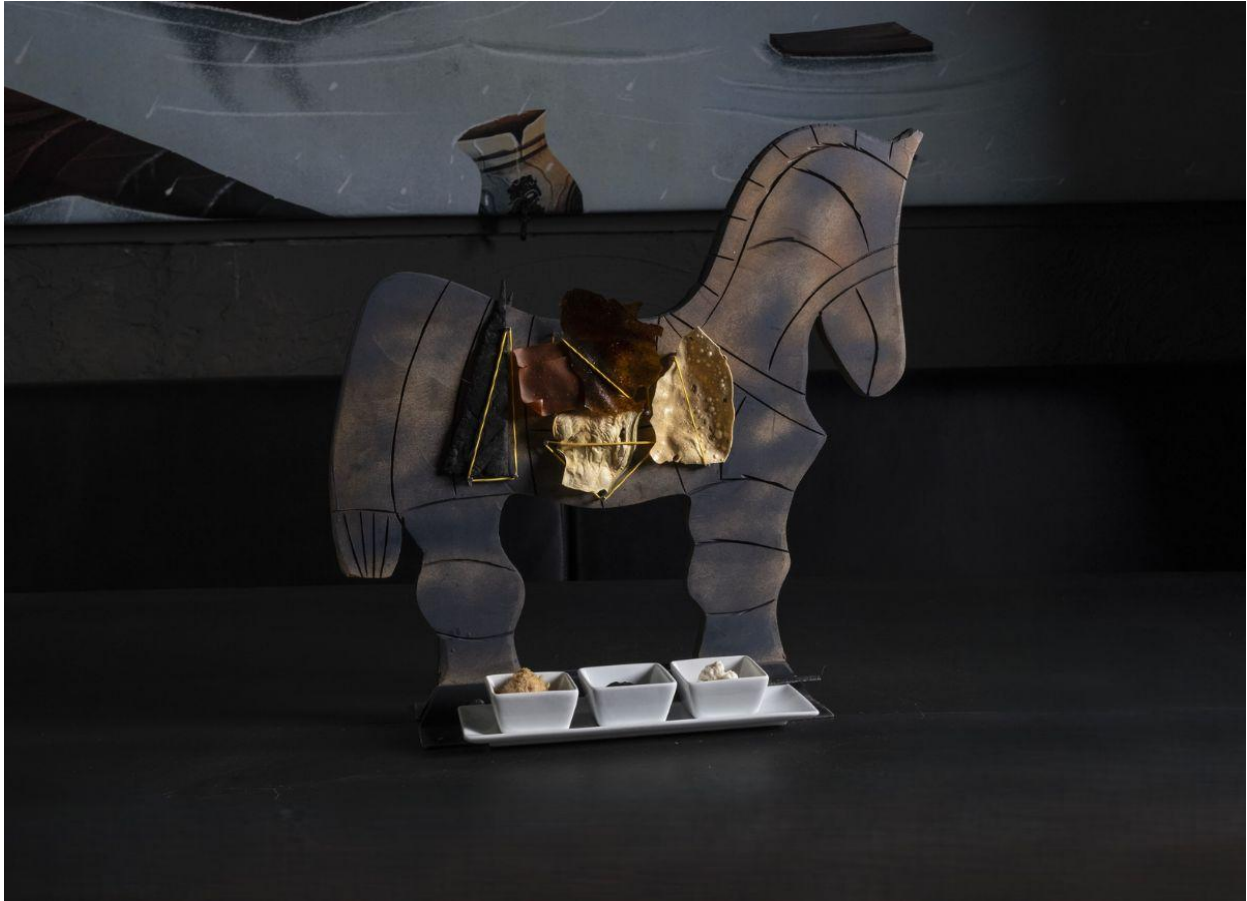
“Tutto partì da Troia”, l’antipasto che apre il viaggio culinario di Ulisse al Satricvm.