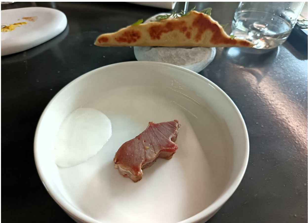
“Circe”, il profilo femminile del Circeo nel gyros di tonno, abbinato ad una terrine de cochon (Foto © Malinda Sassu).

In “ Circe ” viene ricreato il fascino ammaliante della maga dell’Odissea, che secondo la leggenda abitava sulle coste laziali. Il piatto si presenta come un elegante profilo femminile realizzato con un gyros di tonno crudo e cotto, un evidente richiamo al vicino promontorio del Circeo. L’abbinamento con la terrine de cochon aggiunge una nota di opulenza terrena, mentre la salsa di yogurt e resina di lentisco apporta una freschezza acidula con un tocco aromatico resinoso, richiamando i profumi della macchia mediterranea.