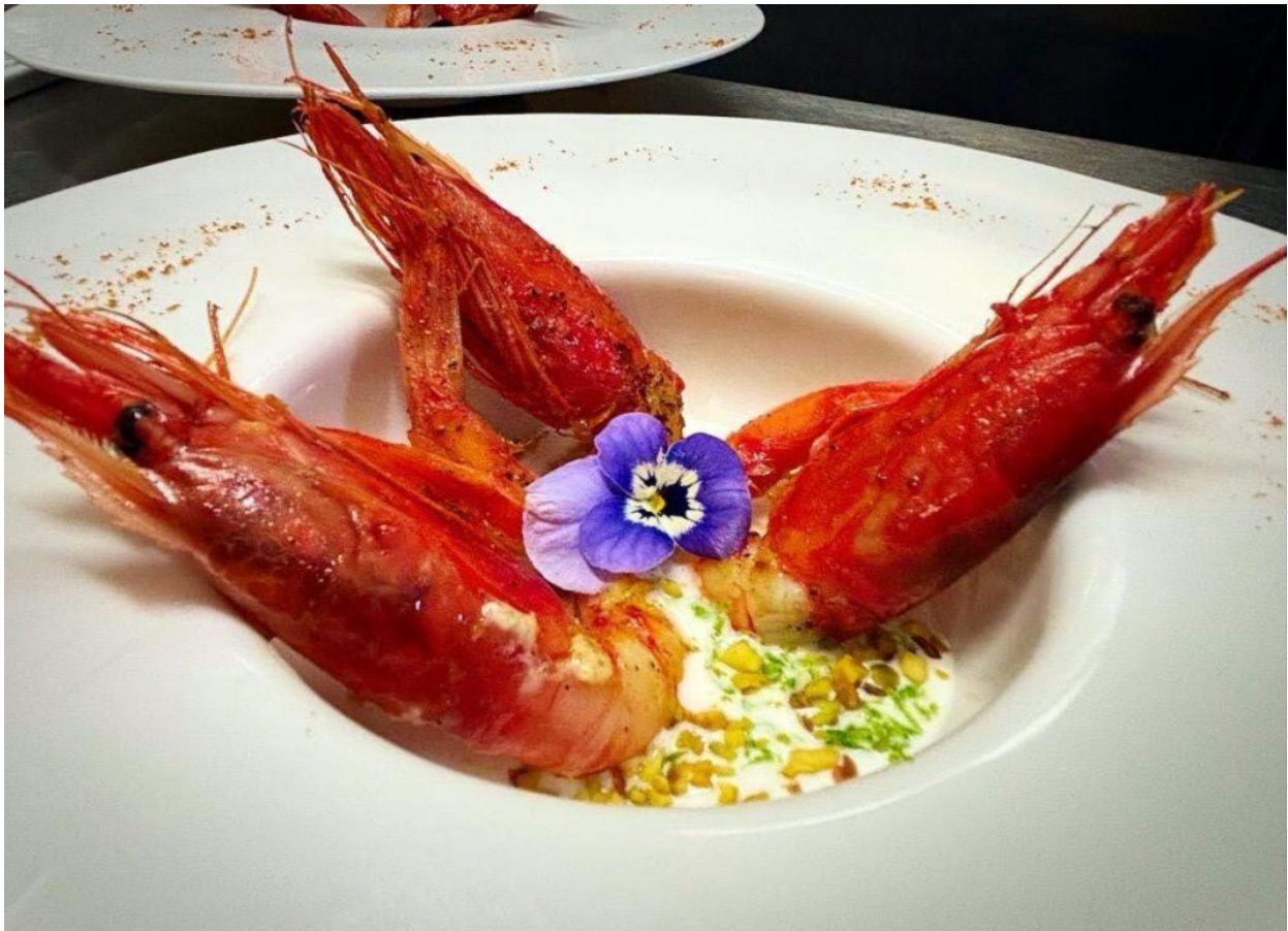
Gamberi rossi con stracciatella, cocco, pistacchi e zest di lime.

È un cuoco artigiano, crea, produce pane, pasta, oli aromatizzati al mandarino, dolci, gelato, le cialde per il tiramisù, salse asiatiche come teriyaki, ponzu, unagi, chutney e confetture, ottime quelle alla pera e zafferano, aceto alle more e lamponi. C'è un connubio tra Sardegna e Oriente nel miele cannonau soia e zenzero che insaporisce le costine di maiale mentre con le bacche di mirto raccolte a Perdasdefogu ha creato una salsa che utilizza per il petto d' anatra , un piatto impreziosito dalle pesche noci.