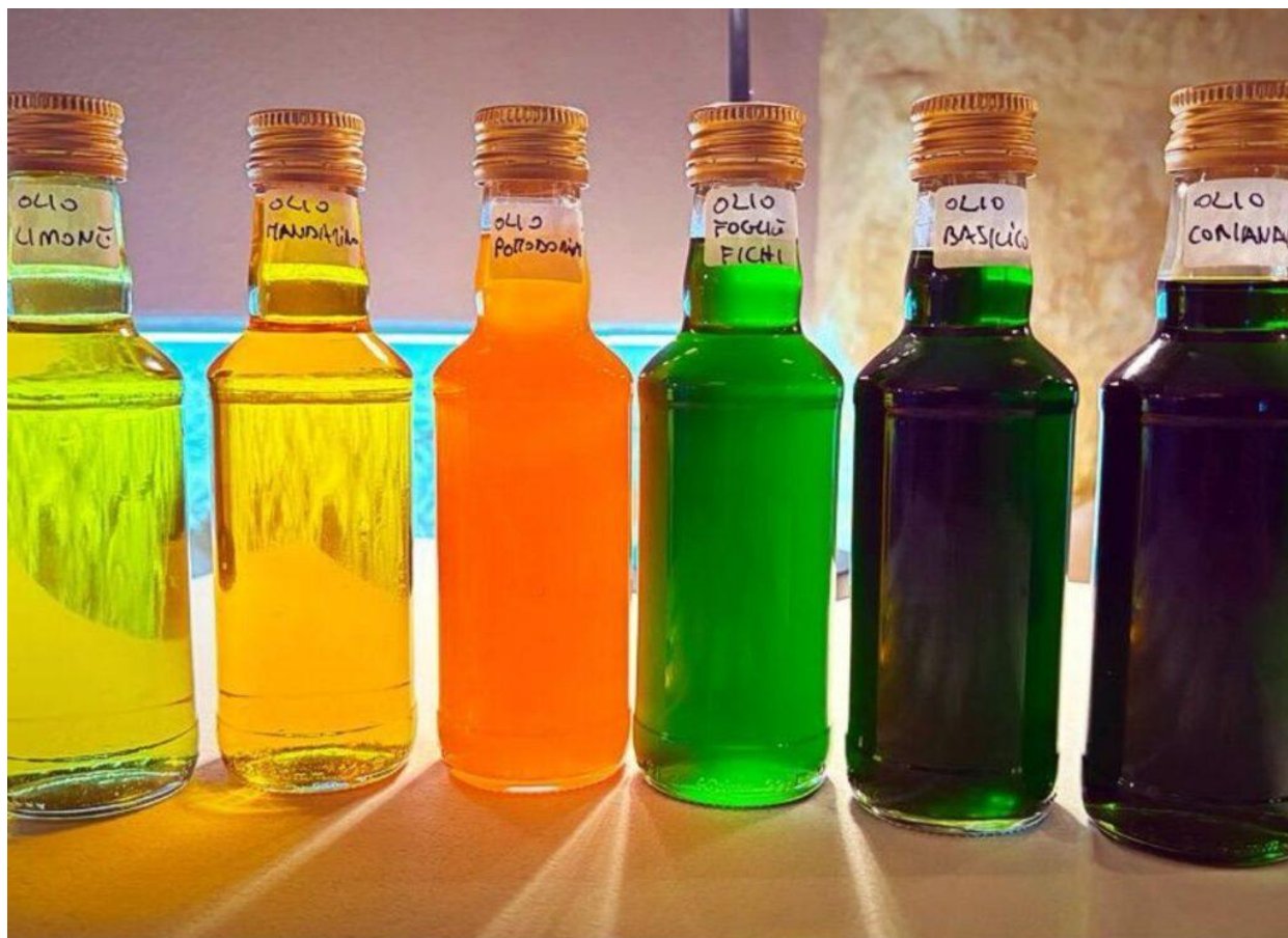
Gli oli particolari preparati dallo chef.

Ultra estivo il piatto a base di tentacoli di polpo fritto , melone arrosto , finocchietto selvatico , il tutto su un letto di salsa fumè: diverse consistenze, tocchi di freschezza, profumi di mare e una nota affumicata a dare ancor più carattere.