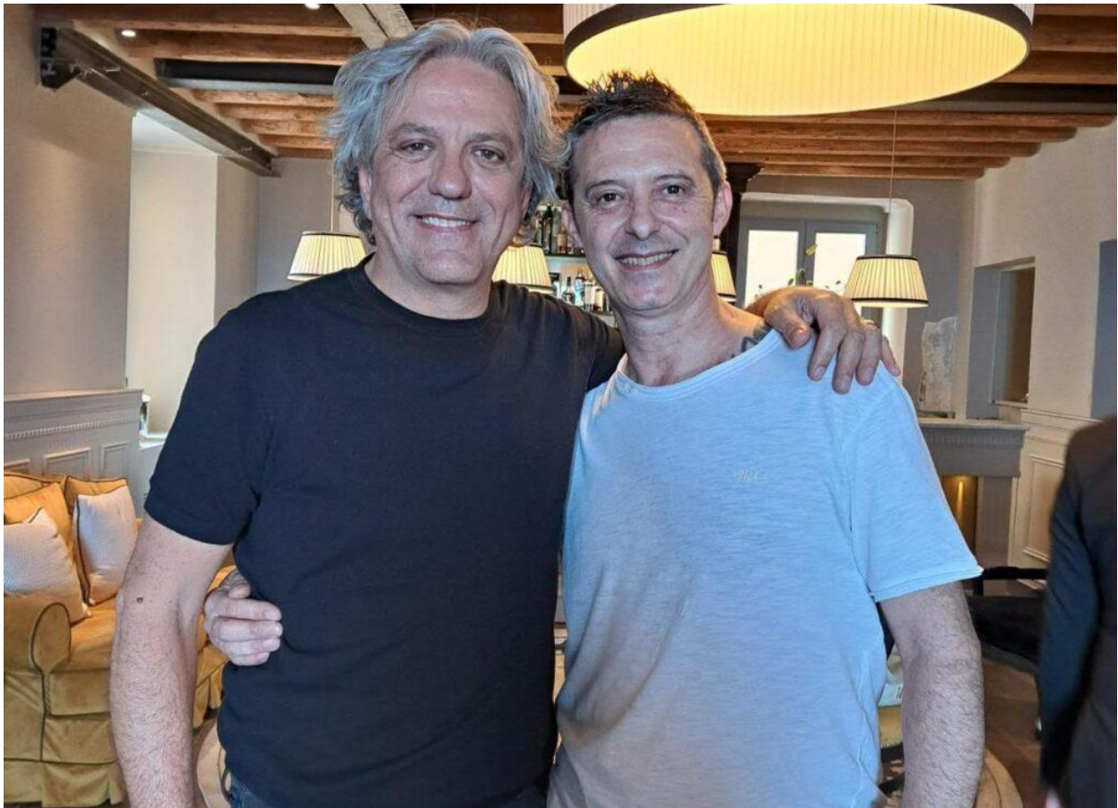
Luciano Lai con Giorgio Locatelli.

Il destino lo ha fatto incrociare con Giorgio Locatelli , più volte Stella Michelin e storico giudice di MasterChef .