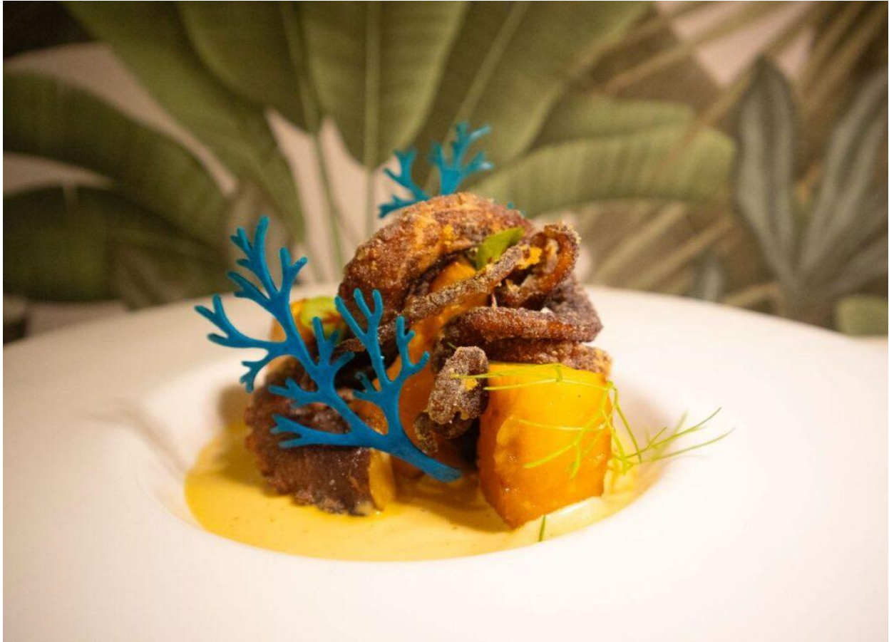
Tentacoli di polpo con melone arrosto e salsa fumè.

Il dessert è un invito al gioco: Tiramisù espresso con i savoiardi sardi , in una cialda croccante da rompere con il cucchiaino. È una piacevole esplosione di freschezza il dolce vegano cremoso, al cocco con mango al brandy e gateau di pistacchio .