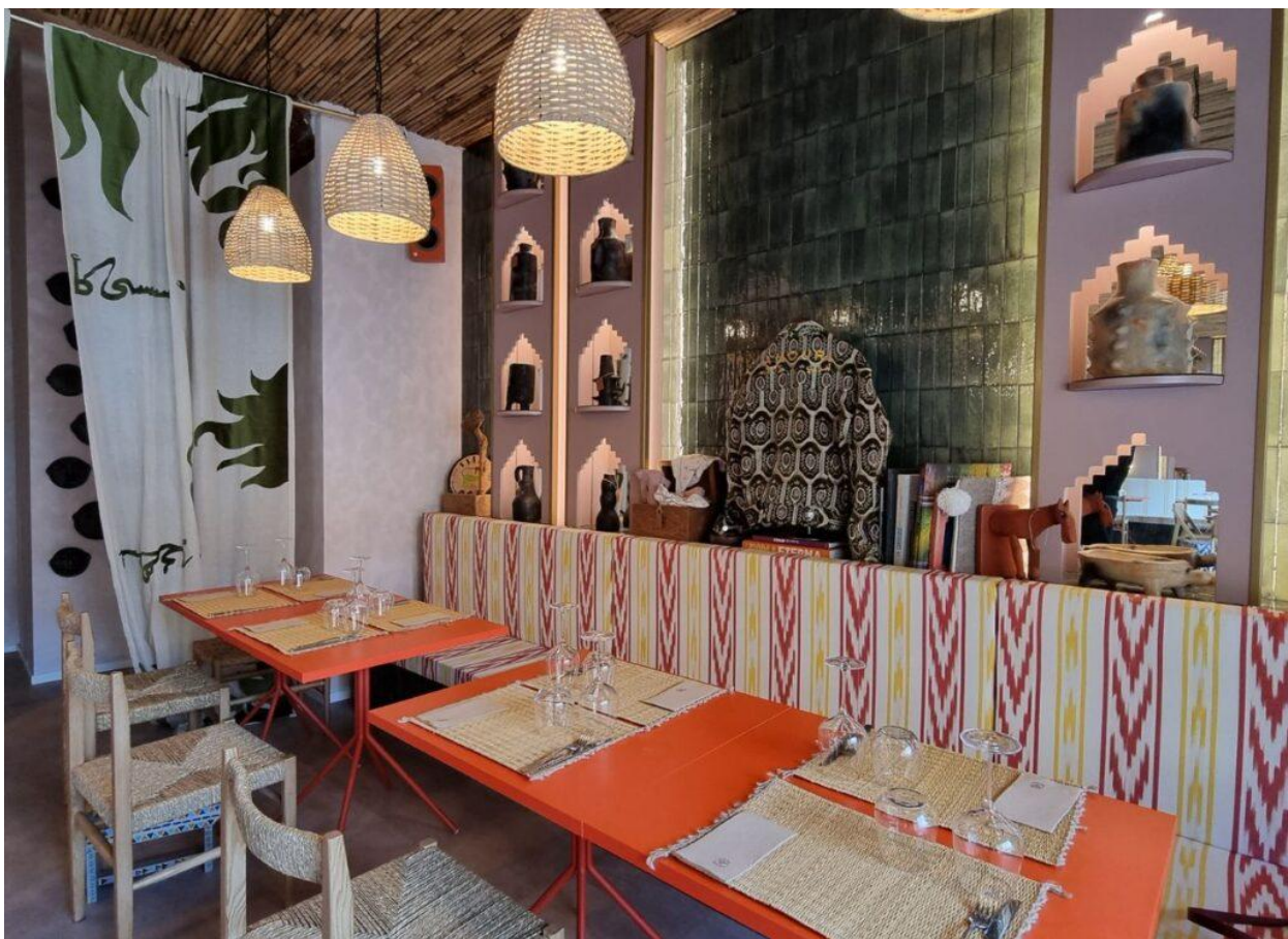
Altri dettagli del locale milanese (Foto © Sara Panizzon).

«Il nostro obiettivo è offrire un piatto salutare, inclusivo e culturalmente ricco», racconta Perrino. «Il cous cous permette davvero di unire gusto, benessere e identità diverse in un’esperienza in cui il cibo diventa linguaggio universale e occasione di incontro».