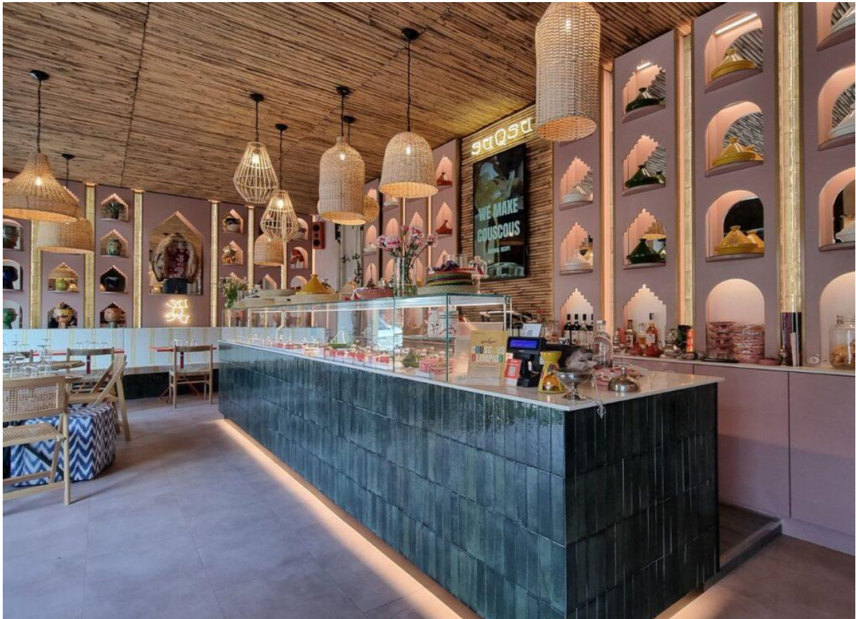
Gli interni del ristorante.