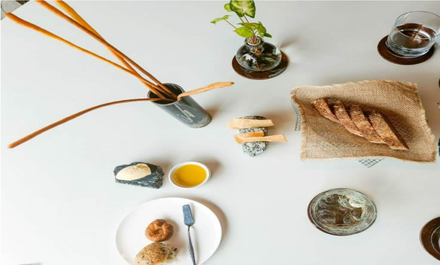
Pane, grissini, cracker e focacce (Foto © Giovanni Caldara).