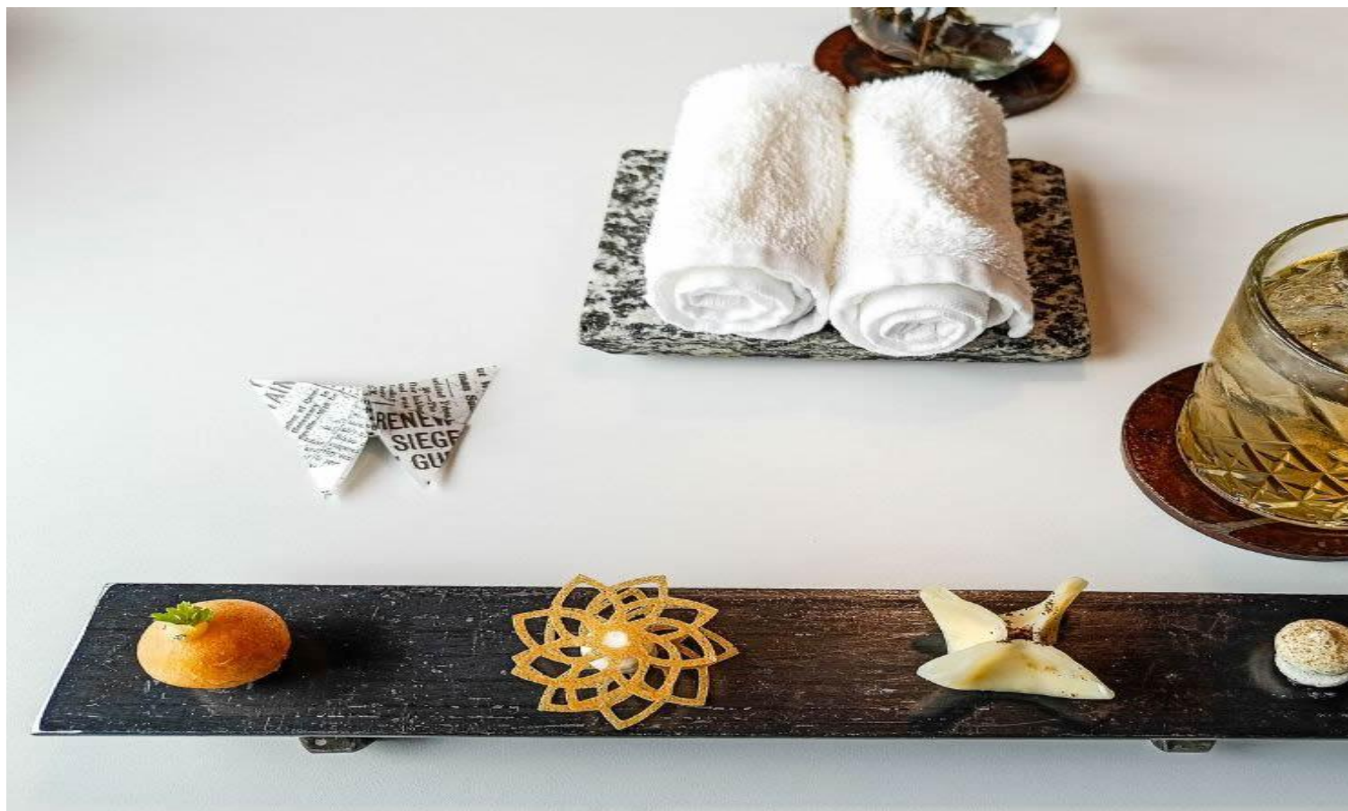
Amuse bouche.