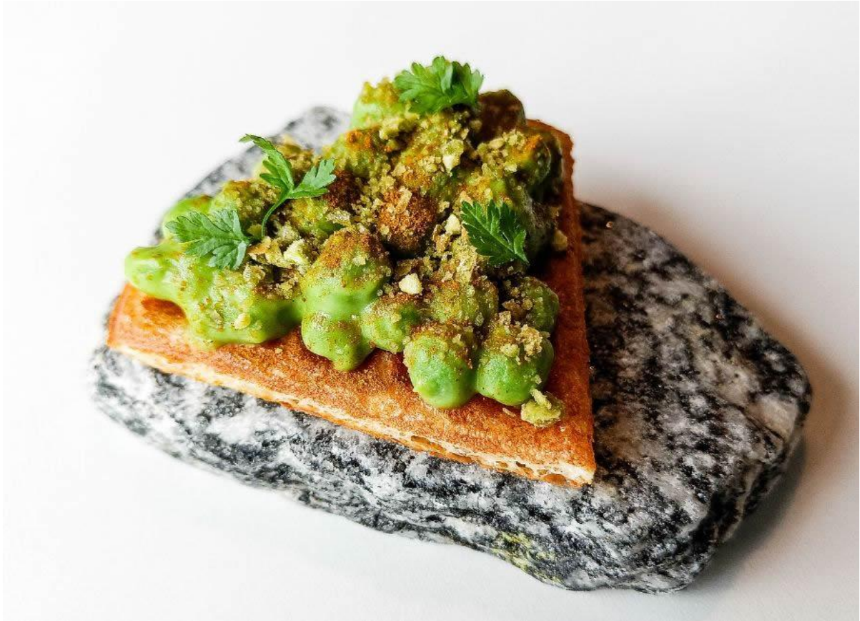
Waffle soffiato al parmigiano, piselli, curry e wasabi.