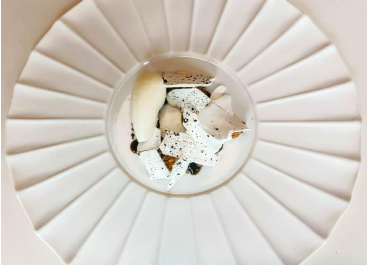
Bergamotto, mandorla e liquirizia.