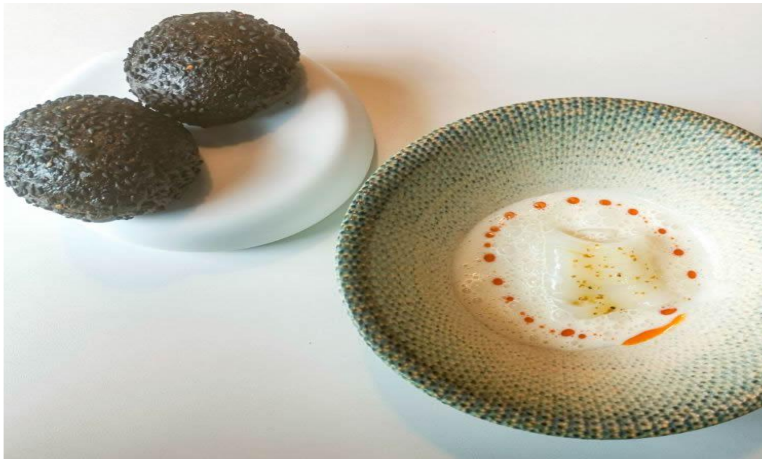
Seppia, 'nduja e beurre blanc.