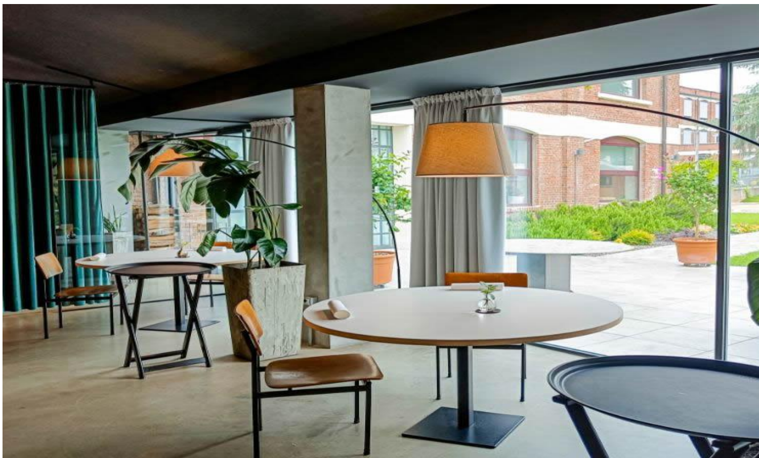
Un angolo del locale.