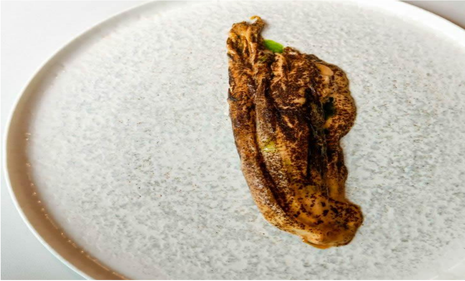
Cavolo cinese alla brace accompagnato da salsa kimchi e burro di arachidi.

Posto d'onore lo guadagnano le frattaglie , altro elemento povero se non di scarto, sebbene oggi in auge pressoché ovunque. Da Trattoria Contemporanea sono cucinate con sapienza e senza spaventare: diverte ed è buono il Cervello di vitello con composta di prugna e burro nocciola . Ma non è da meno lo Spiedino di cuore di vitello con il suo fondo, la maionese allo scalogno, il rafano e il diamante di capra .