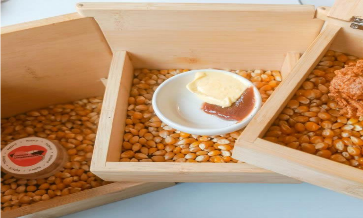
Cervello di vitello, composta di prugna e burro nocciola.