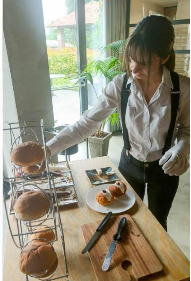
Gnocchetto di semola e trippe | Maritizzo.