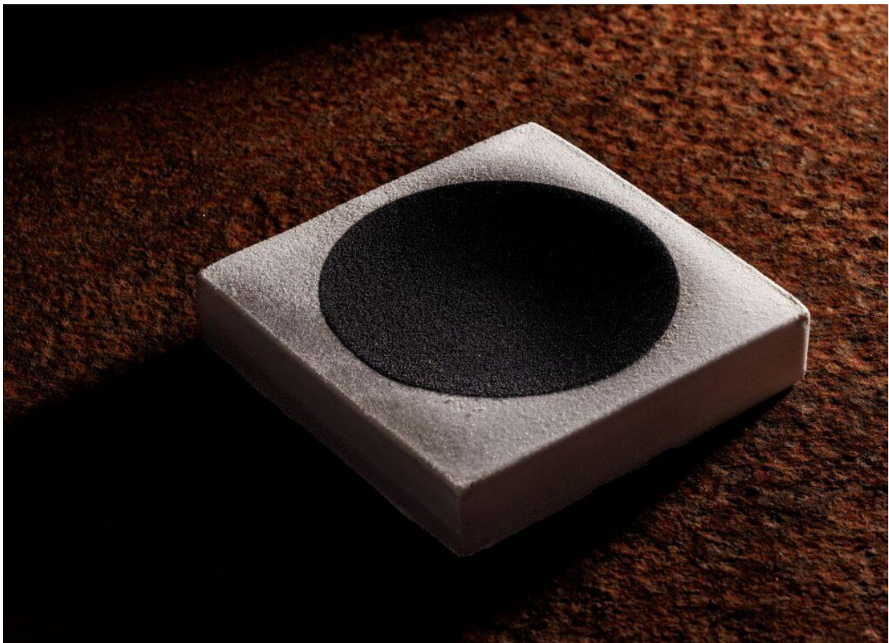
La torta Descension, omaggio all'artista Anish Kapoor del 2025 (Foto © Andrea Di Lorenzo).

«Qui subentra lo storytelling, il raccontare quello che stai mangiando. Altrimenti diventa un lavoro tecnico dove sai fare bene una mousse o una ganache. Questo lo possono fare in molti in Italia. Ma quali sono quelli che lasciano davvero un ricordo?»