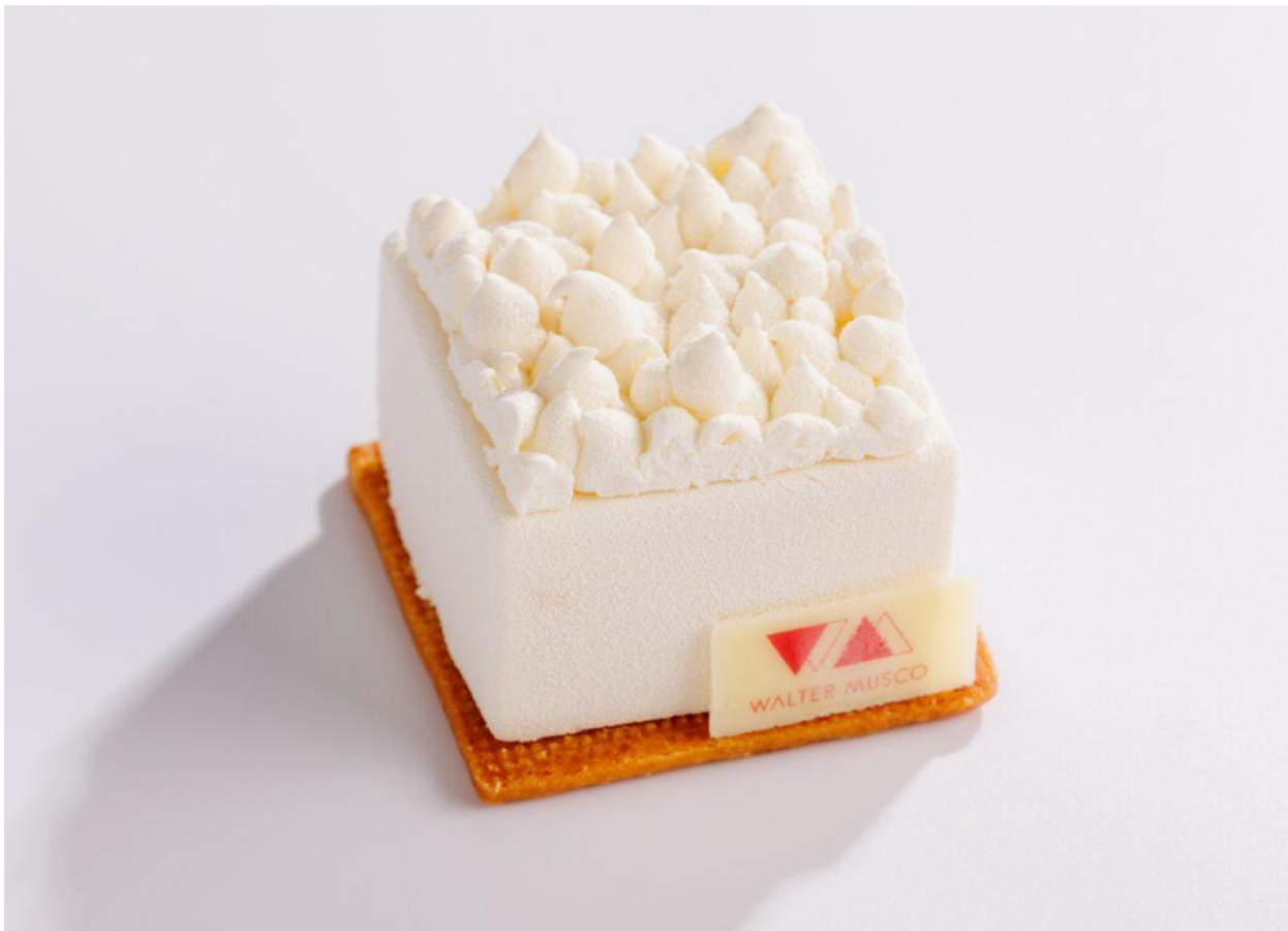
Achrome, ispirata a Piero Manzoni con mandorla di Sicilia in diverse consistenze.

Sulla stessa linea si colloca Quadrato Nero (2021) , omaggio a Kazimir Malevi? : biscotto morbido, mousse di panna acida al caviale Siberian e gelatina di vodka. Un lavoro che apre a un territorio in cui la pasticceria oltrepassa i propri codici formali.