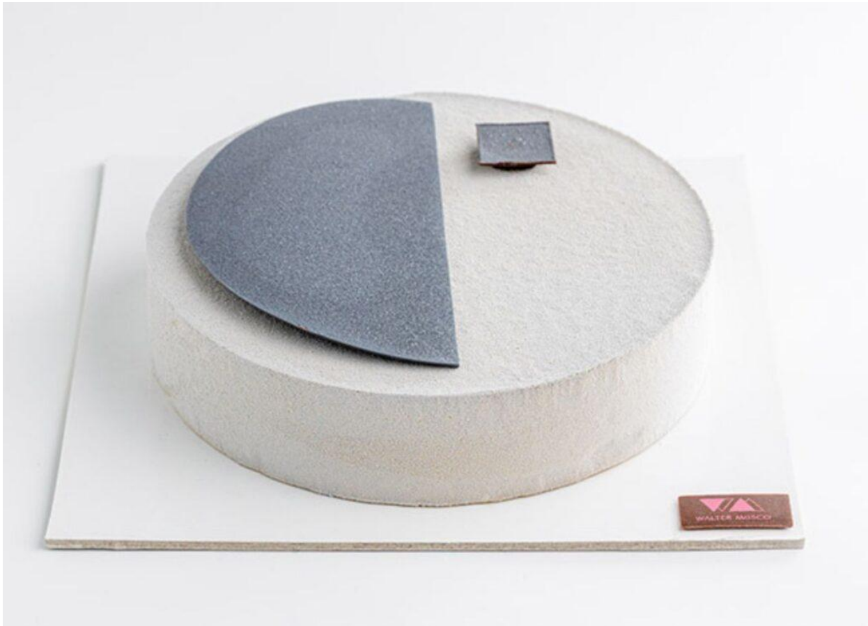
La torta Bauhaus, omaggio a Walter Gropius del 2012 (Foto © Andrea Di Lorenzo).

Al suo posto arriva Teobromina nel 2023. Qui il cioccolato diventa materia culturale: una struttura tridimensionale ispirata al calendario precolombiano che accoglie tre declinazioni di Andoa Grand Cru peruviano Valrhona (eclat bianco, mousse al latte, mousse fondente), saldando memoria simbolica e progettazione tecnica in un unico impianto.