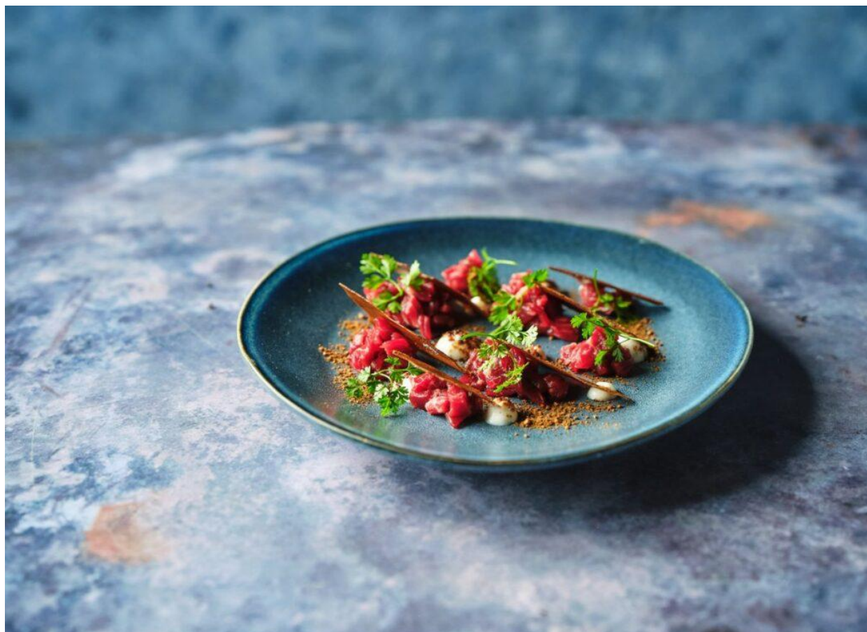
Tartare di manzo, emulsione di rafano, chips di patate bruciate e polvere di kogii.

Il resto della giornata spazia dai momenti riservati alle colazioni sotto i rinfrescanti e profumati auspici del glicine nel giardino-bistrot quindi i pranzi in stile casual-chic, ma senza dimenticare l'irrinunciabile aperitivo con cocktail ispirati alla Sardegna in onore del padrone di casa.