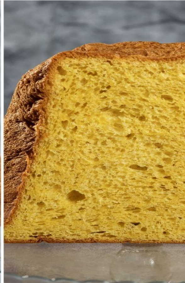
Top Ten migliori pandori: I classificato Caffè Pasticceria Nelly's