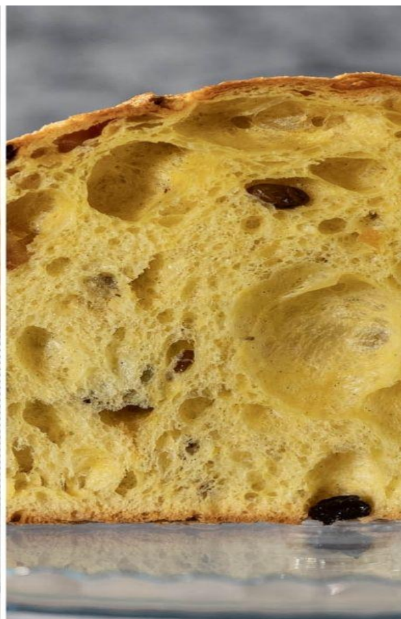
Top Ten Panettoni: I classificato Rubicondo Pasticceri