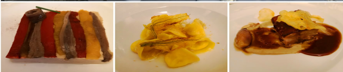
Il castello di Moasca e alcuni piatti della cena di gala.

Uno dei momenti più importanti della festa è stata la cena di gala che quest'anno si è svolta al Castello di Moasca con i piatti dello chef Gian Piero Vivalda , del ristorante stellato Antica Corona Reale di Cervere.