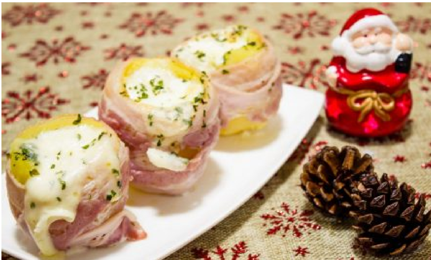
Patate al bacon con mozzarella.