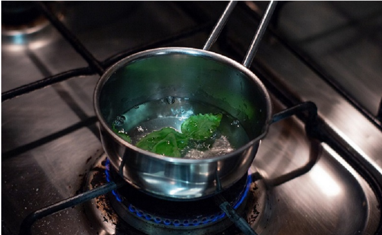
Bagna di zucchero e basilico (Foto © Lisa Corsoni).