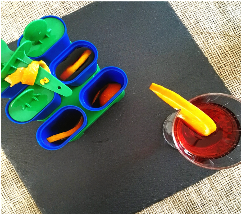
Preparazione dei Negroni pop-tail.