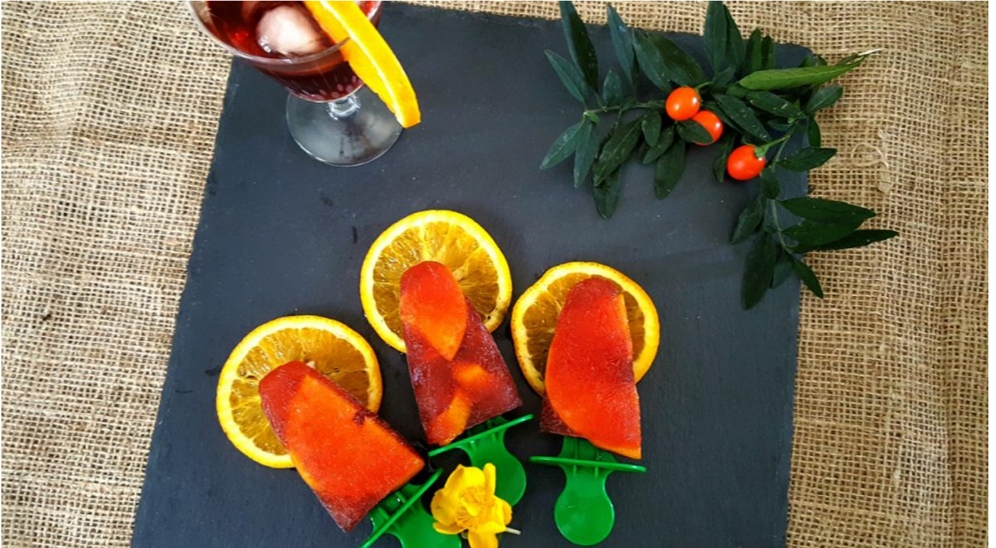
Ghiaccioli al Negroni

Da pochi anni anche in Italia si sono diffusi i poptail , un termine che nasce dall'unione di popsicle (ghiacciolo in inglese) e cocktail . Sono praticamente dei ghiaccioli colorati e dissetanti che si possono gustare anche come una granita al cucchiaino. Contengono frutta ma anche Caipirinha, Mojito, Margarita e, in questo modo, rallegrano le nostre serate. Tra questi poptail alcolici non può mancare il cocktail nazionale, il Negroni .