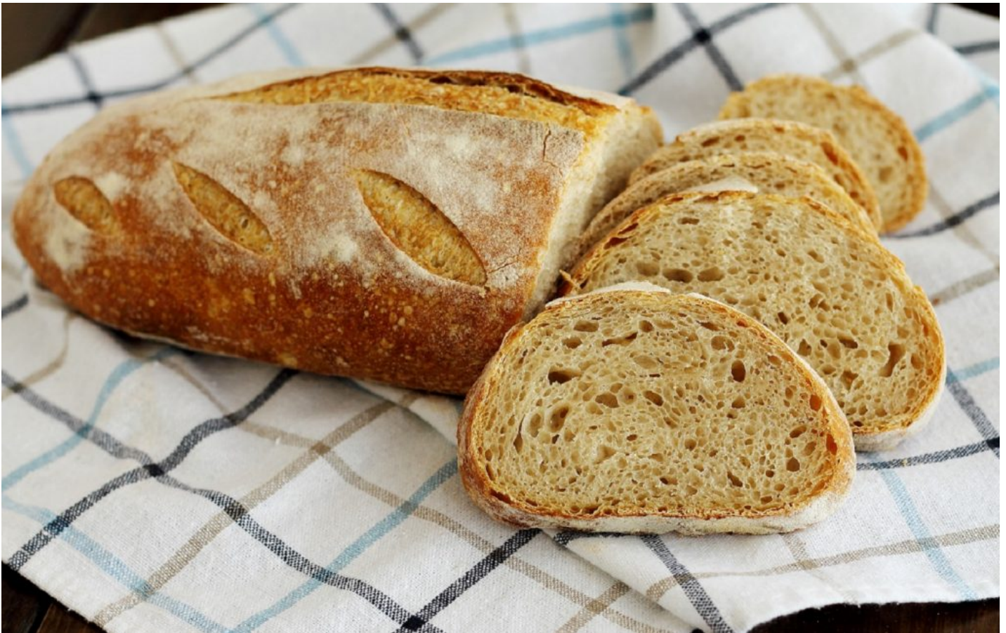
Pane con farina buratto e pasta madre.

Con la farina di buratto si produce un pane dal gusto eccellente e dalla crosta spessa, adatto per accompagnare salumi e formaggi, per creare deliziose bruschette e da gustare con marmellata o miele a colazione.