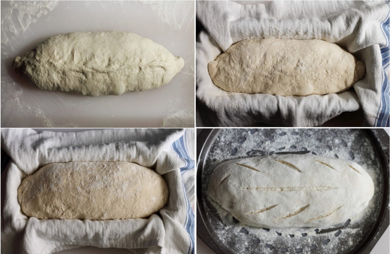
Formatura e tagli per il nostro filoncino di pane

Nel frattempo scaldare il forno a 220° C e, poco prima infornare, inserire una ciotolina con 3 cubetti di ghiaccio, per creare vapore durante i primi 15 minuti di cottura. Questo passaggio è importantissimo perchè consente di mantenere la crosta del pane elastica, permettendone lo sviluppo in altezza e la crescita, evitando che si spacchi dai lati.