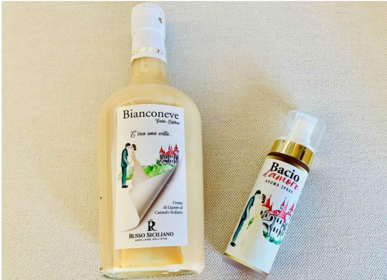
Il connubio tra Bianconeve e Bacio d'Amore.

cannolo siciliano di ricotta, e Bacio d'Amore aroma spray alla cannella, vaniglia e cioccolato.