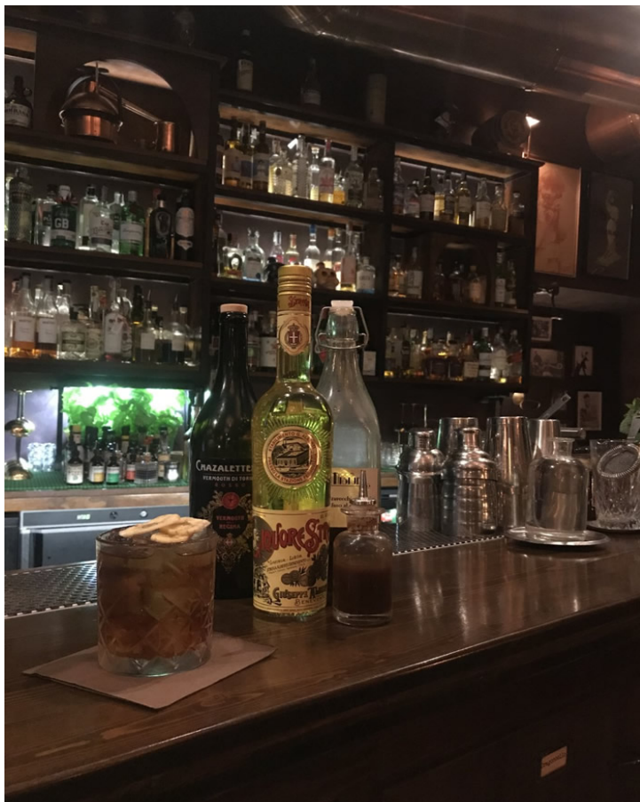
Cocktail “Lo sventato”