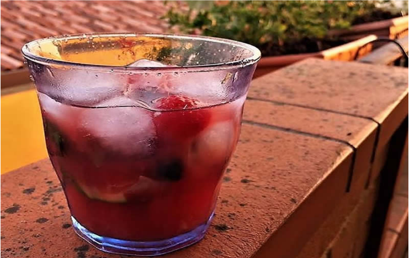
Mojto all'anguria.