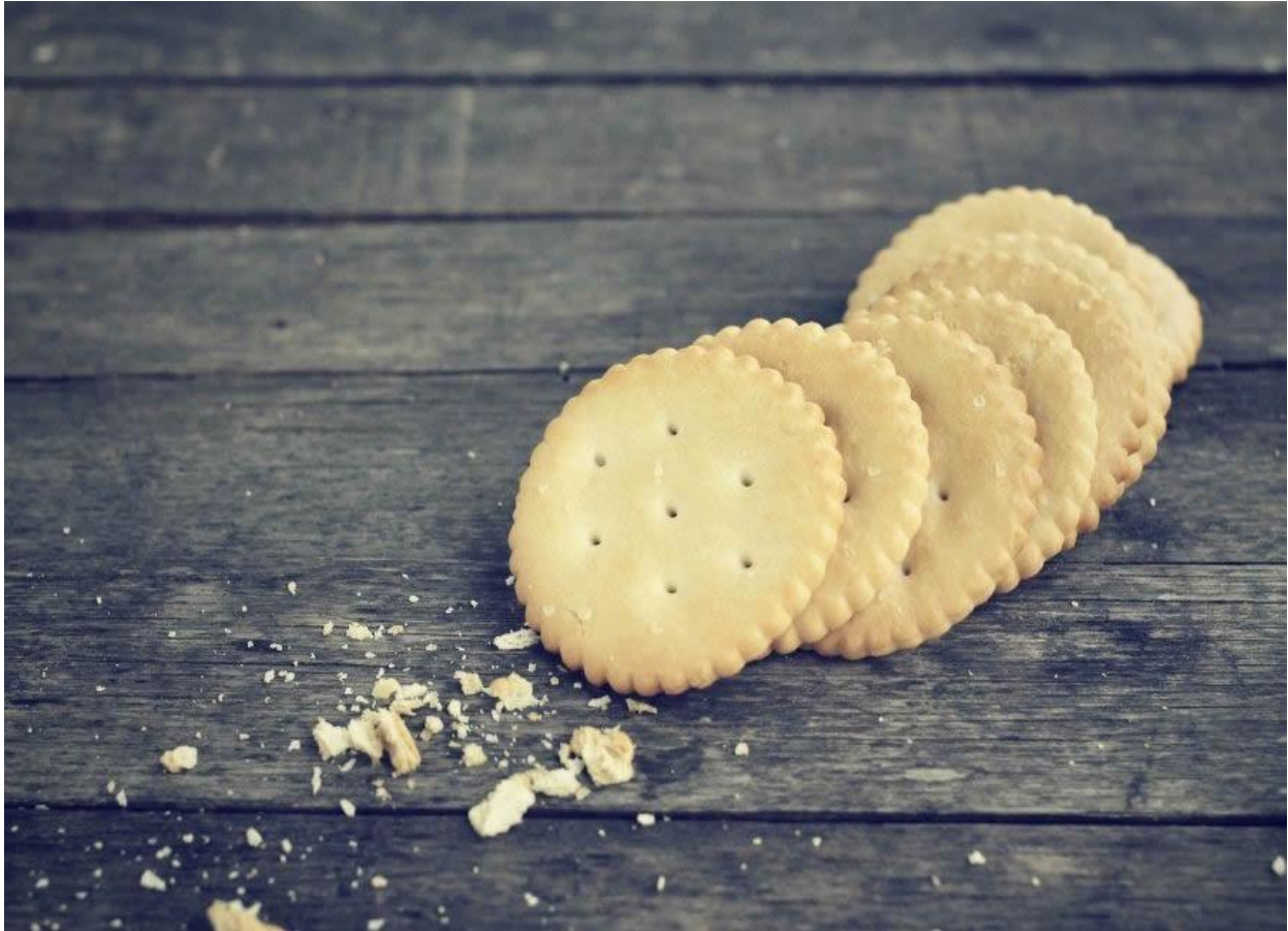
Galette del marinaio.

Lo stesso ingrediente si ritrova anche a Carloforte e Calasetta , in quella Sardegna che conserva ancora forti legami con Genova e con la storia dei marinai liguri diretti verso Tabarca e il commercio del corallo. La capponadda ligure porta quindi con sé anche una piccola geografia del Mediterraneo.