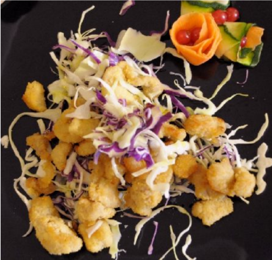
Pollo fritto con cavolo rosso e bianco.

Il Pollo fritto con cavolo rosso e bianco è un piatto molto appetitoso che si prepara con estrema rapidità. Anche i bambini non resisteranno e saranno attratti dal gusto sfizioso del pollo fritto e dai colori variopinti del cavolo che, tra le altre cose, ha ottime proprietà per la salute.