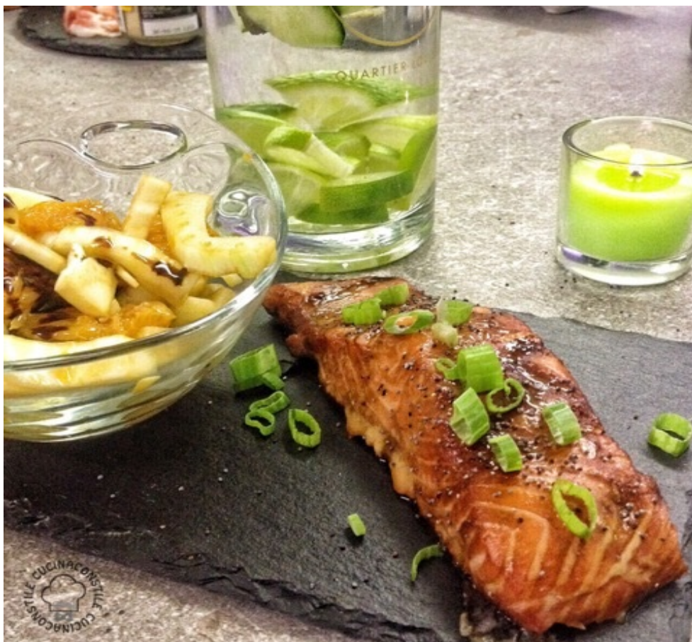
Salmone in salsa Teriaky.

Il buon sapore del salmone, arricchito dalla sofisticata e particolarissima salsa Teriaky ci consentirà di preparare un piatto da leccarsi i baffi.