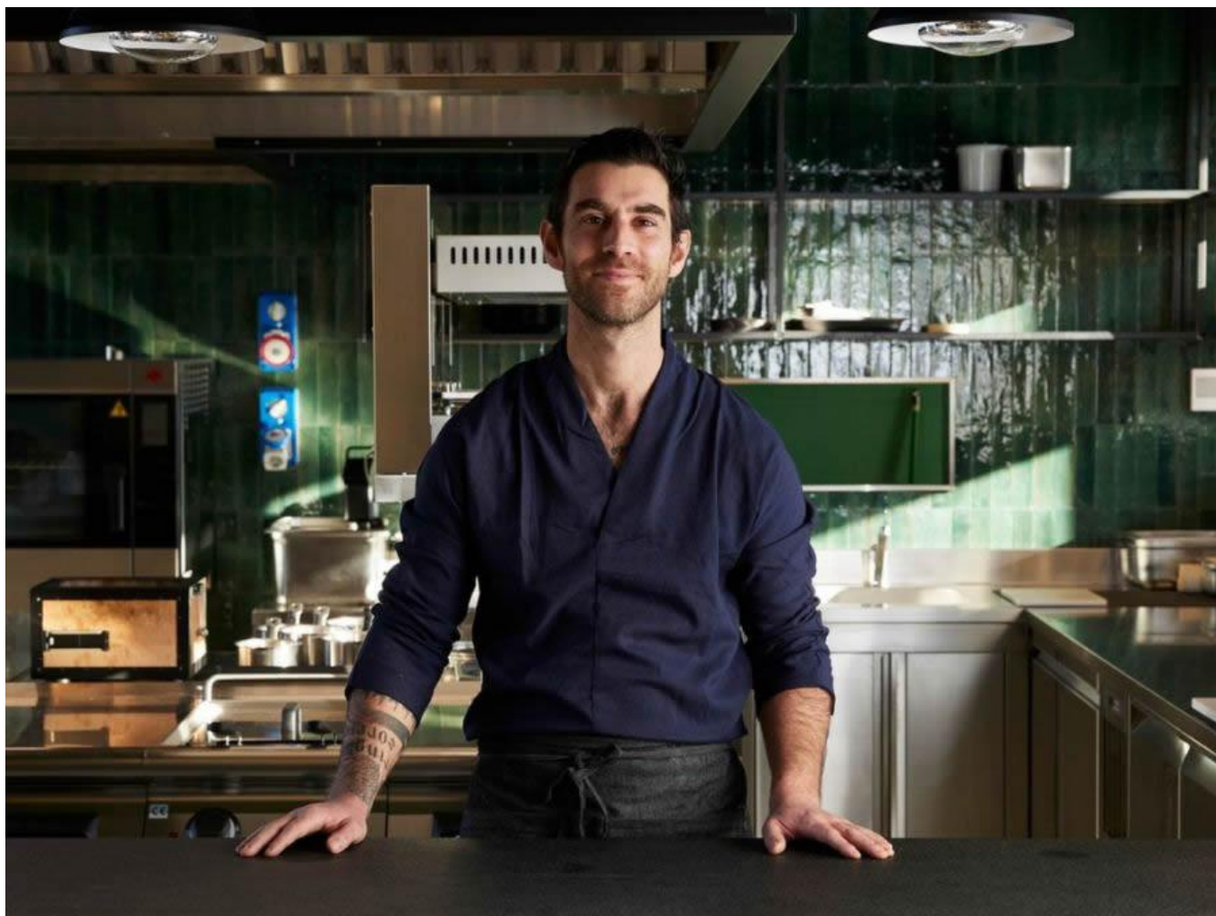
Lo chef nella sua cucina.