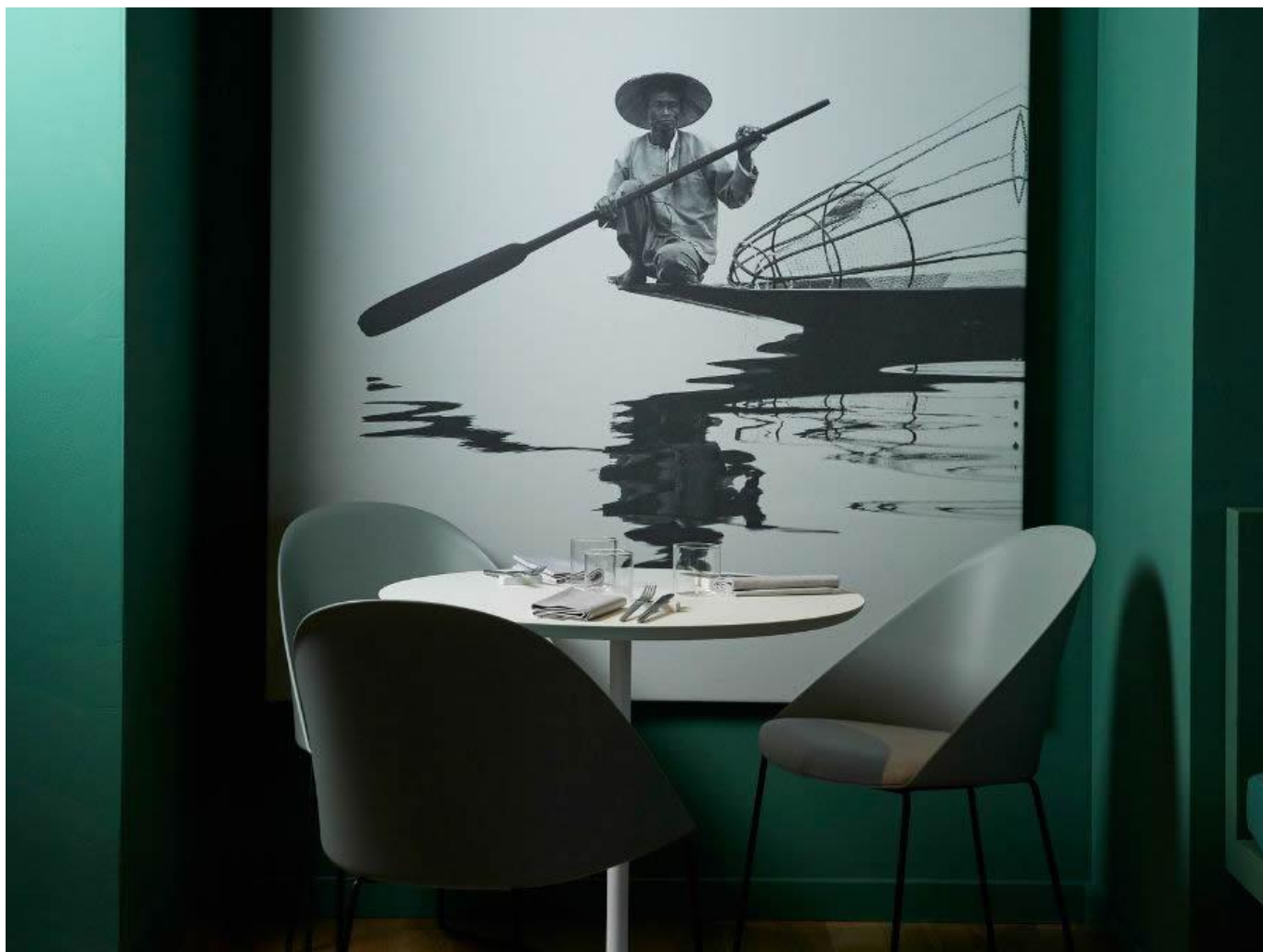
Un angolo del locale.