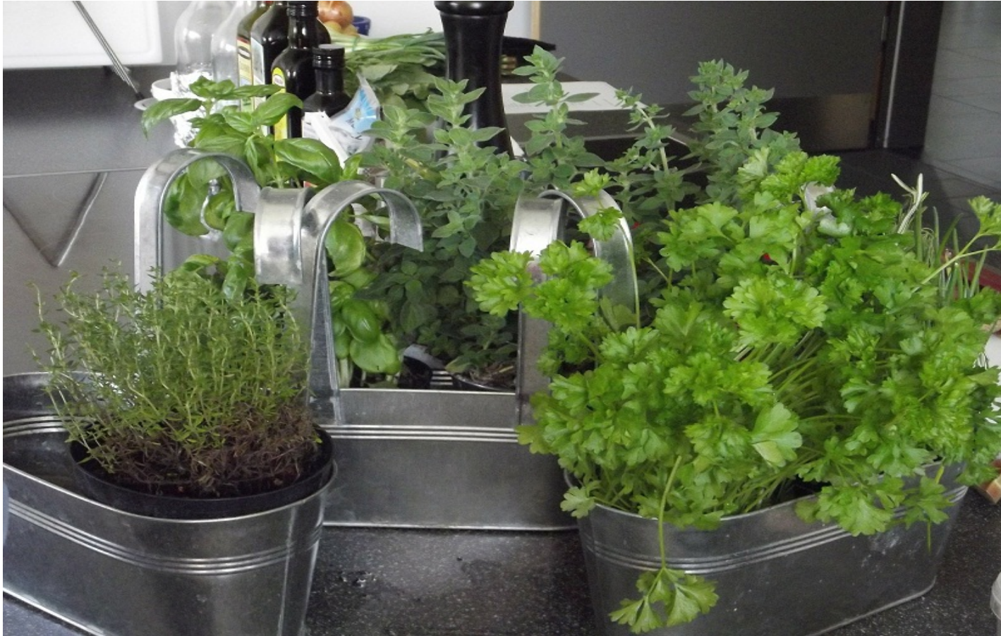
Alcune Erbe Aromatiche più frequenti.

Conosciute sin da tempi antichissimi, le erbe aromatiche venivano considerate preziose alleate quando il sale era una merce pregiata. Esse furono apprezzate, oltre che per le loro qualità gastronomiche, anche per i loro poteri digestivi e depurativi. L'uso di erbe aromatiche in cucina è cambiato nel tempo ed infatti, attualmente, sono più legate al tipo di odore e sapore che conferiscono ai cibi.