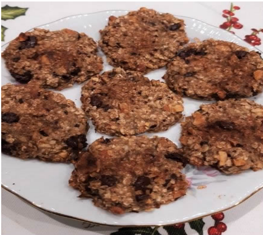
Biscotti di avena, banana e cioccolato