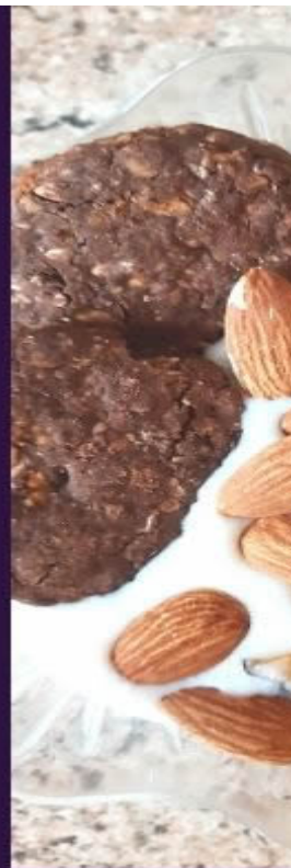
Kefir con mandorle e biscotti

Alcune preparazioni con alimenti fermentati con funzione "probiotica".