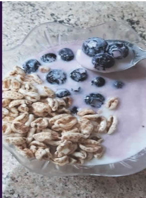
Kefir con mirtilli e cereali soffiati