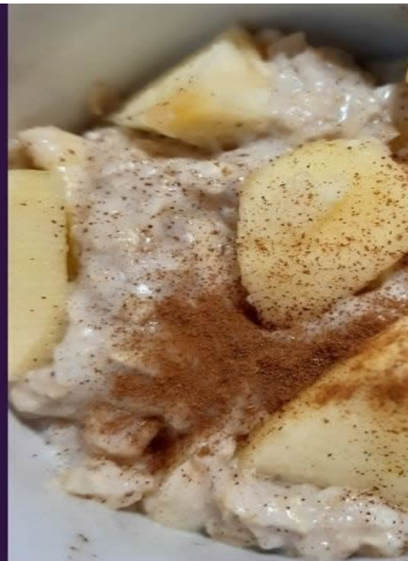
Porridge con fiocchi mele e cann

Ricette con ingredienti a base di fibre solubili.