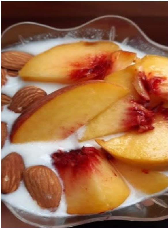
Kefir con mandorle e pesche

Gli alimenti definiti " probiotici " contengono una buona concentrazione di microrganismi vivi , che conferiscono benefici se consumati con una certa regolarità. Una volta ingeriti, questi microrganismi hanno la particolarità di arrivare vivi al colon. In questa sede, aderiscono all'intestino, si riproducono, stimolano il sistema immunitario e contrastano i patogeni.