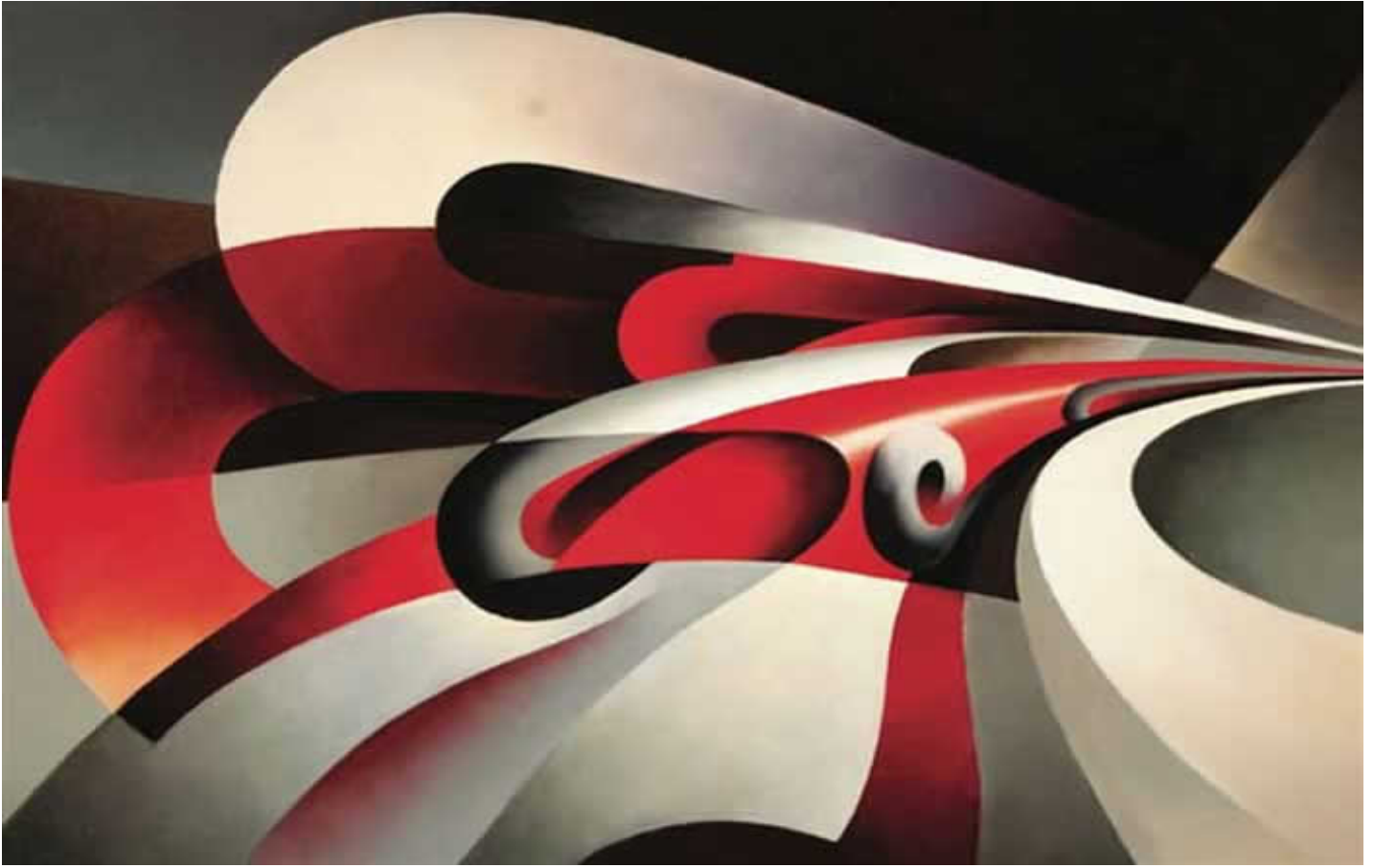
“Le forze della curva” di Tullio Crali, 1930.

Sorseggiare il «Rubino» ti catapulta all’inseguimento sfrecciante e sinusoidale della geometria cromatica dell’opera di Tullio Crali “ Le forze della curva ” del 1930.