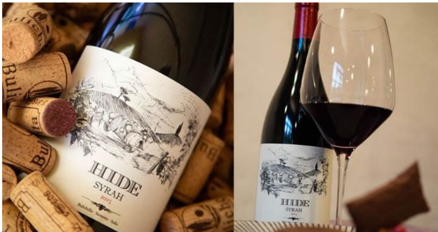
«Hide» Syrah IGT Costa Toscana.