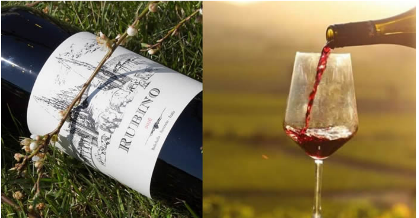
«Rubino» IGT Costa Toscana.

Dopo una breve macerazione prefermentativa a freddo, le uve sono fatte fermentare a 24°. Successivamente avviene l'affinamento in acciaio, seguito da un breve passaggio in barrique di secondo e terzo passaggio.