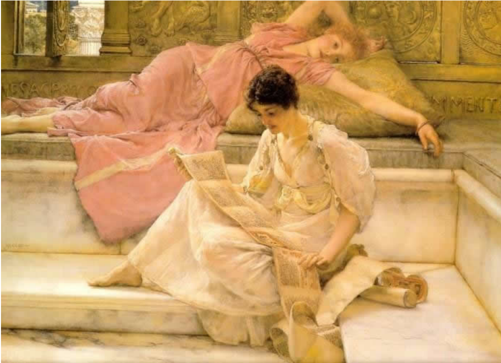
Lawrence Alma-Tadema, Il poeta preferito (1888).