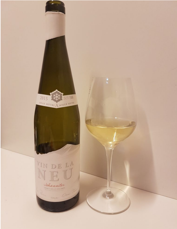
Vin de La Neu 2015 IGT.