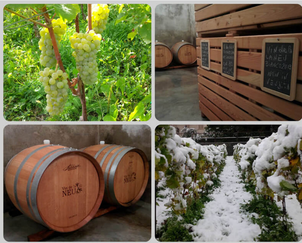
Grappoli, vigneti e cantina (Foto © Amanada Arena).

Vin de La Neu è un sapiente binomio di intelligenza e cuore; ha un carattere deciso, penetrante. Il suo equilibrio si snoda in un'ottimale alternanza tra freschezza e morbidezza. Rivela, chiaramente, l'identità dei terreni della Val di Non, composti da dolomia principale e strati di calcare, marna e argilla .