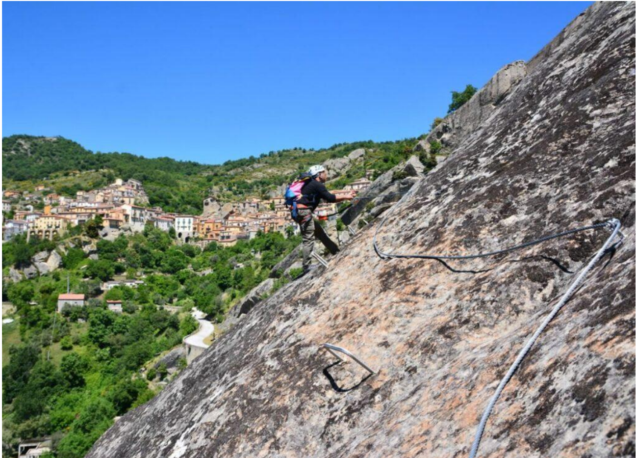
Via Ferrata Marcirosa – Pietrapertosa.

Per chi cerca l'emozione dell'altezza e il fascino della roccia, le Vie Ferrate delle Dolomiti Lucane rappresentano un'esperienza indimenticabile. Si snodano per oltre 3,6 km lungo le pareti che dividono Castelmezzano e Pietrapertosa, regalando scorci spettacolari e l'incredibile sensazione di camminare sospesi tra terra e cielo.