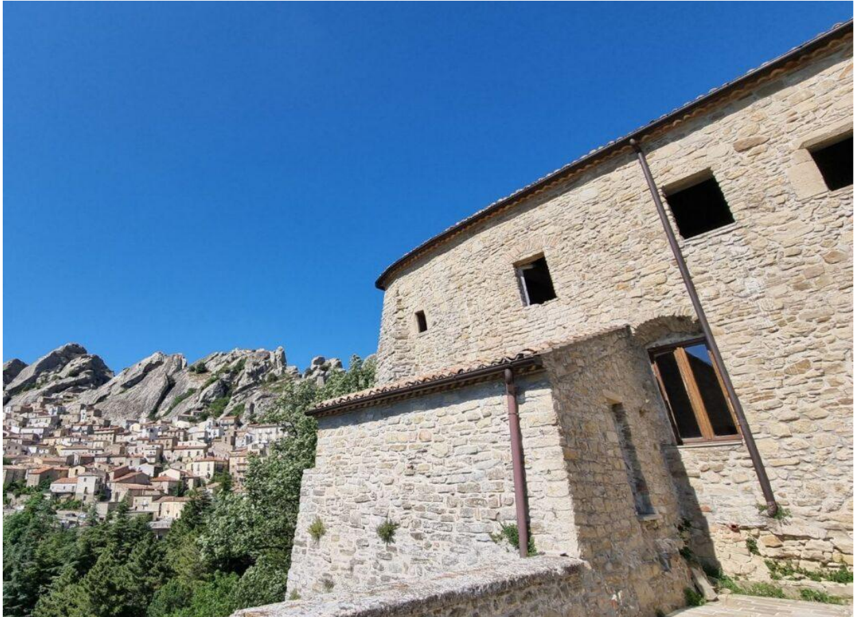
Convento di San Francesco.

La chiesa annessa, a navata unica con copertura a capriate, custodisce un prezioso Polittico attribuito a Giovanni Luce da Eboli e numerosi affreschi , tra cui un ciclo cristologico e scene della vita di San Francesco, oltre a un coro ligneo seicentesco di straordinaria bellezza.