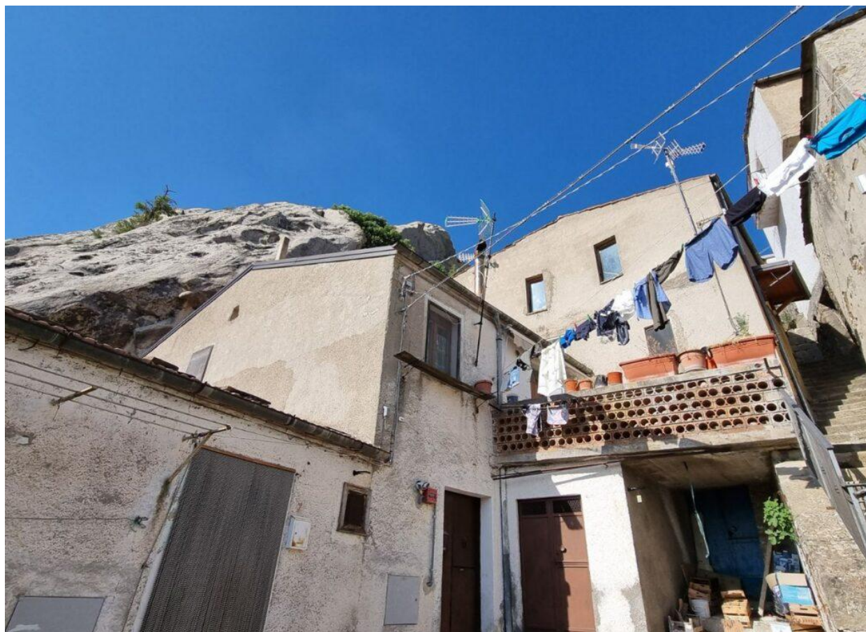
L'antico quartiere dell'Arabata (Foto © Sara Panizzon).

Alla periferia del borgo si trova il Convento di San Francesco d'Assisi , fondato nel 1474 e articolato intorno a un suggestivo chiostro quadrato.