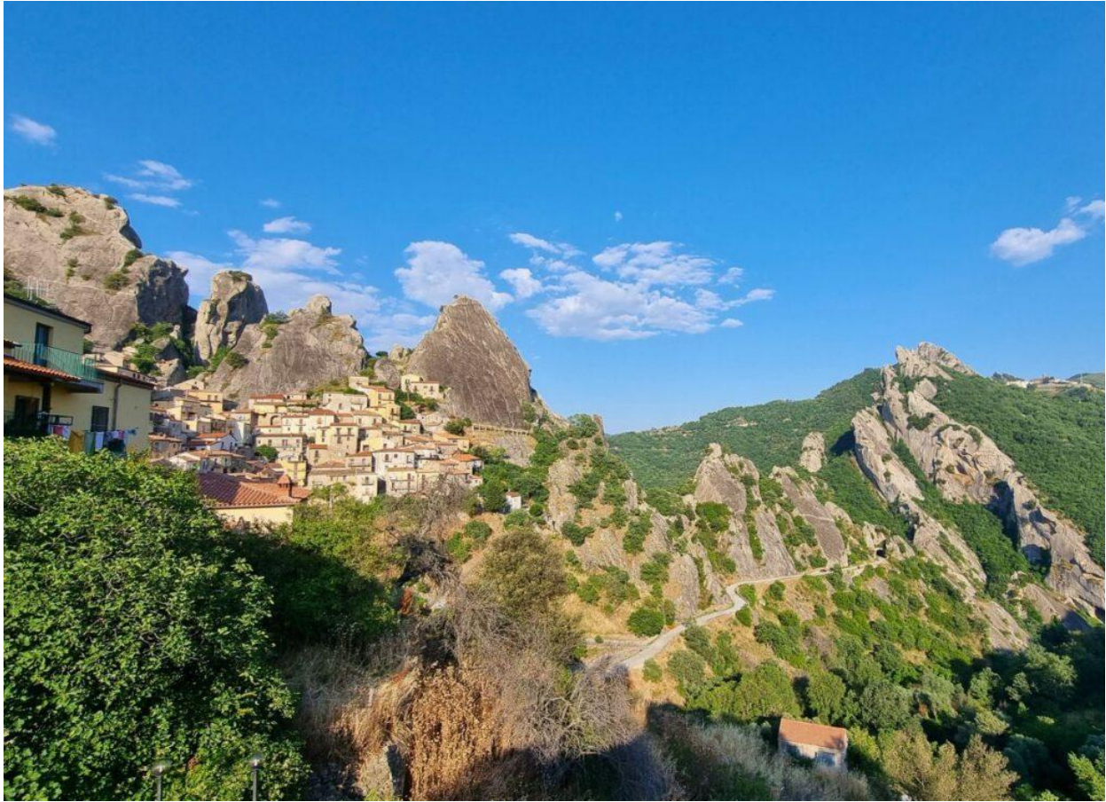
Panorama sulle Dolomiti Lucane.

ancora l'originario impianto medievale, con vicoli, piazzette e sottoportici scavati nella roccia, ieri come oggi considerati un punto di ritrovo per la vita sociale del paese.