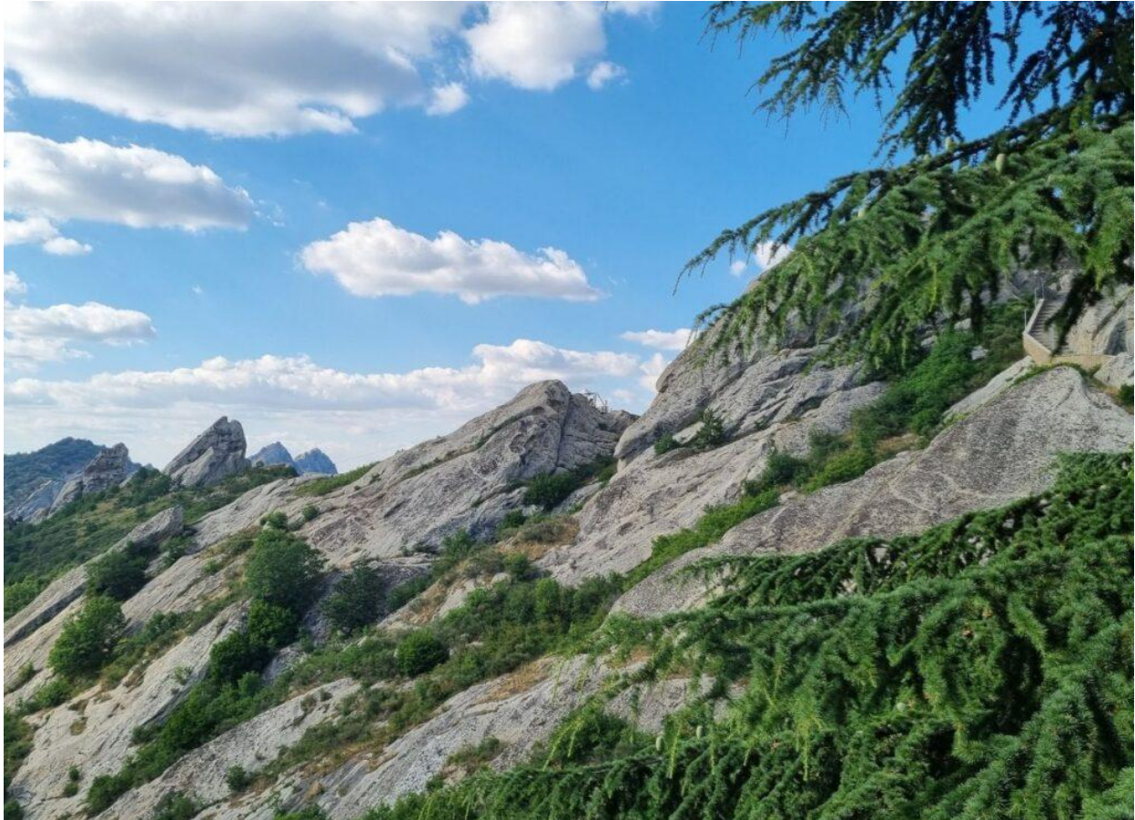
Il punto di partenza del Volo dell'Angelo.

Chi sceglie di provarlo si ritrova appeso a un cavo d'acciaio, disteso in posizione orizzontale, lanciato a tutta velocità nel vuoto. Il panorama intorno si apre all'improvviso: montagne, boschi e cielo si fondono in un'unica prospettiva. Il volo raggiunge i 120 km/h e regala una scarica di adrenalina pura, difficile da dimenticare, ma anche chi resta con i piedi per terra può vivere un momento magico. Basta avvicinarsi alla stazione di arrivo, dove i "volatori" sfrecciano sospesi tra cielo e terra. Il suono del carrello anticipa il loro arrivo: un piccolo punto colorato che cresce, velocissimo, fino a fermarsi pochi metri più avanti. Un attimo di stupore e la consapevolezza di aver assistito a qualcosa di unico. Un'esperienza che non è solo per chi vola, ma anche per chi osserva.