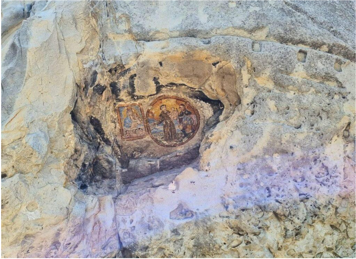
Gli affreschi nella roccia dedicati a San Rocco.