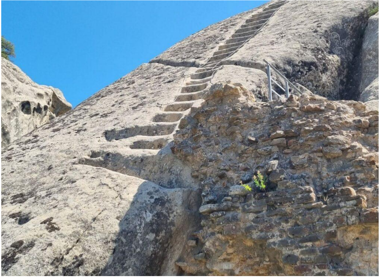
La scalinata normanna scavata nella roccia.

Durante l'estate, tra i resti del castello va in scena lo spettacolo "La Grande Madre" , un'esperienza immersiva tra luci, suoni e parole, proiettata direttamente sulle guglie di arenaria. Un racconto che esalta il patrimonio materiale e immateriale delle Dolomiti Lucane, regalando al pubblico un'emozione sospesa tra paesaggio, mito e memoria.