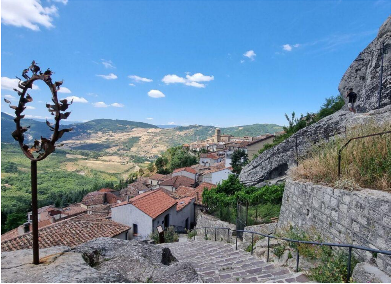
Il borgo di Pietrapertosa.

Camminando tra le stradine, non è raro incontrare anziani – anche centenari – pronti ad accogliere i visitatori con un sorriso e un caloroso “benvenuto” in dialetto. Il cuore del borgo è l’ antico quartiere dell’Arabata , una piccola casbah scolpita nella pietra, che ogni anno a metà agosto si anima con la rievocazione storica “ Sulle tracce degli arabi ”: una festa tra musiche orientali, mercatini, danzatrici del ventre e degustazioni.