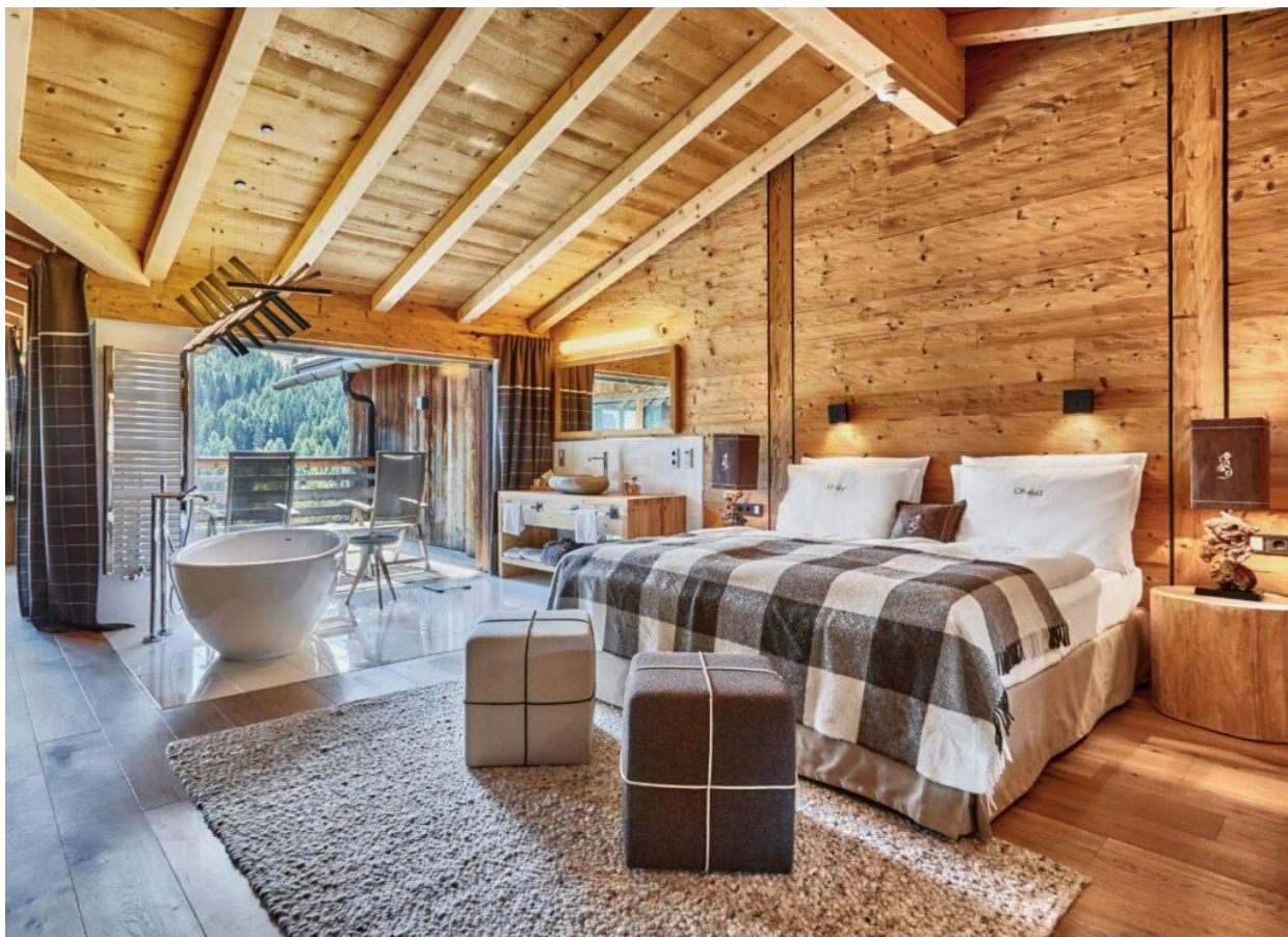
L'interno di uno chalet.

Una delle prime evoluzioni risale al 1972, quando il resort fu tra i primi in Alto Adige a dotarsi di un'area wellness con sauna, idromassaggio e bagno turco, oltre a una piscina all'aperto. Questo spirito pionieristico ha caratterizzato l'hotel fino ad oggi, con la realizzazione di numerose opere che hanno arricchito ulteriormente l'esperienza degli ospiti.