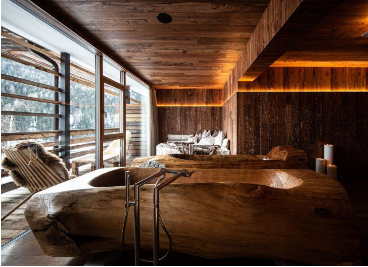
L'area wellness con vasca in un tronco.