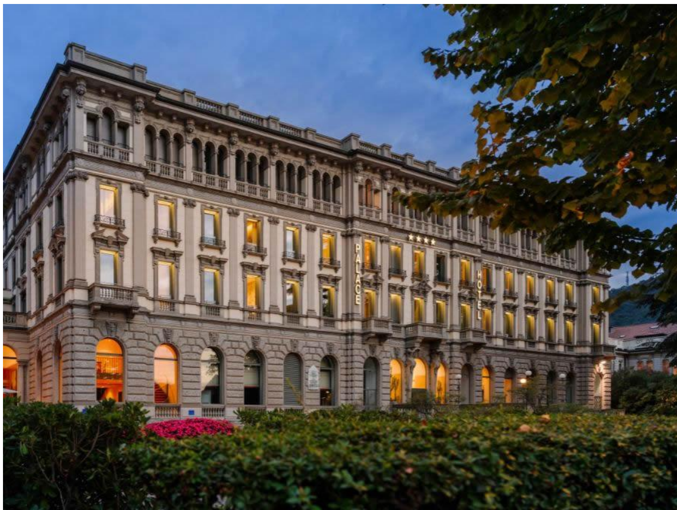
L'esterno del Palace Hotel di Como.

L'esperienza prevede una notte con colazione inclusa e una cena gourmet nel Ristorante Antica Darsena con menù pensato dallo chef Ercole Sandionigi . Un'esperienza culinaria indimenticabile, grazie anche all'accostamento di etichette pregiate. La cena a lume di candela con vista lago, un giardino che accoglie la vecchia darsena e una romantica terrazza, il tutto accompagnato da musica dal vivo, con una performance che includerà voce femminile e chitarra.