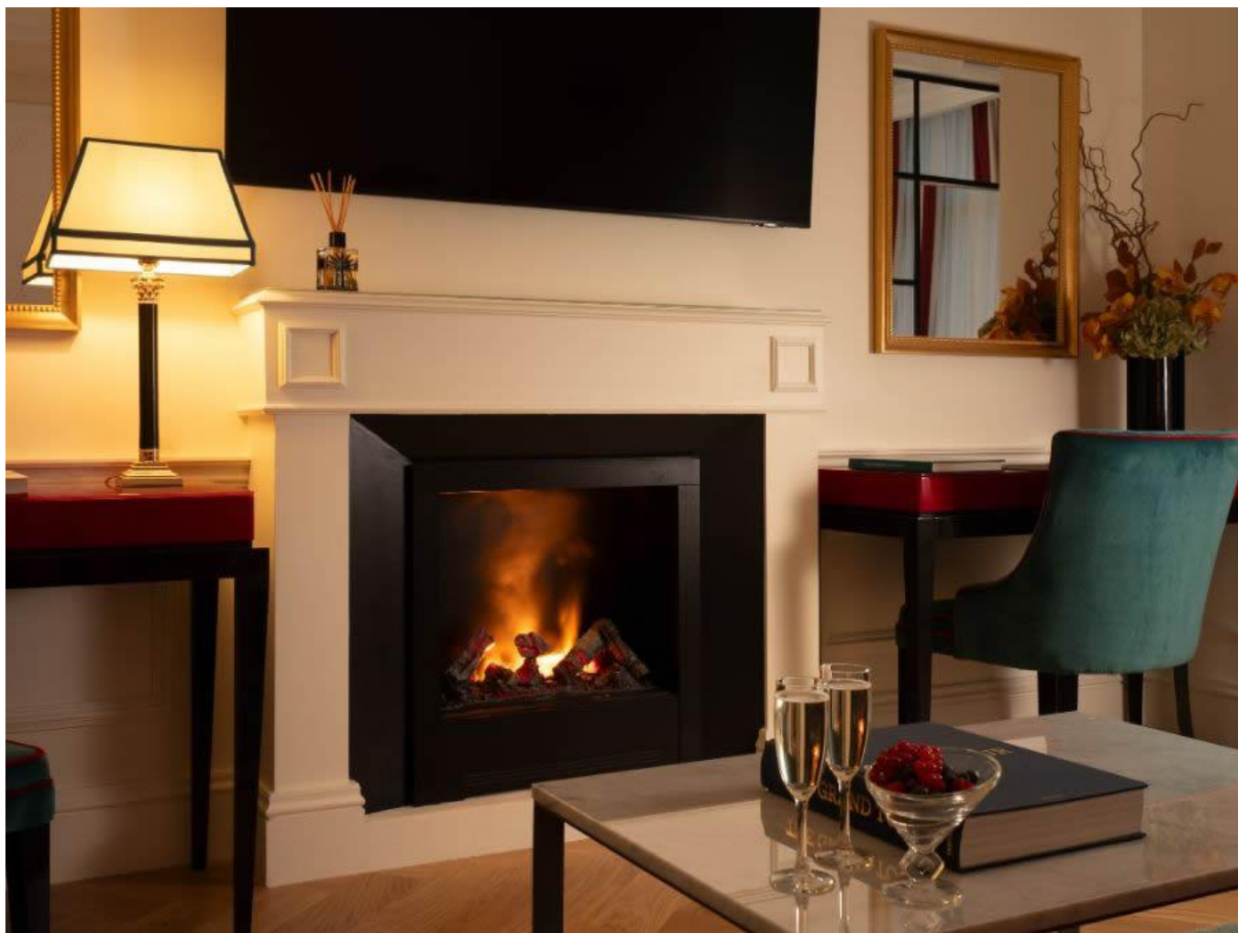
Gli interni di Palazzo Ripetta a Roma.

magica, ricca di storia. Palazzo Ripetta Roma è un 5 stelle inaugurato a settembre 2023 e già entrato a far parte della famiglia Relais & Chateaux .