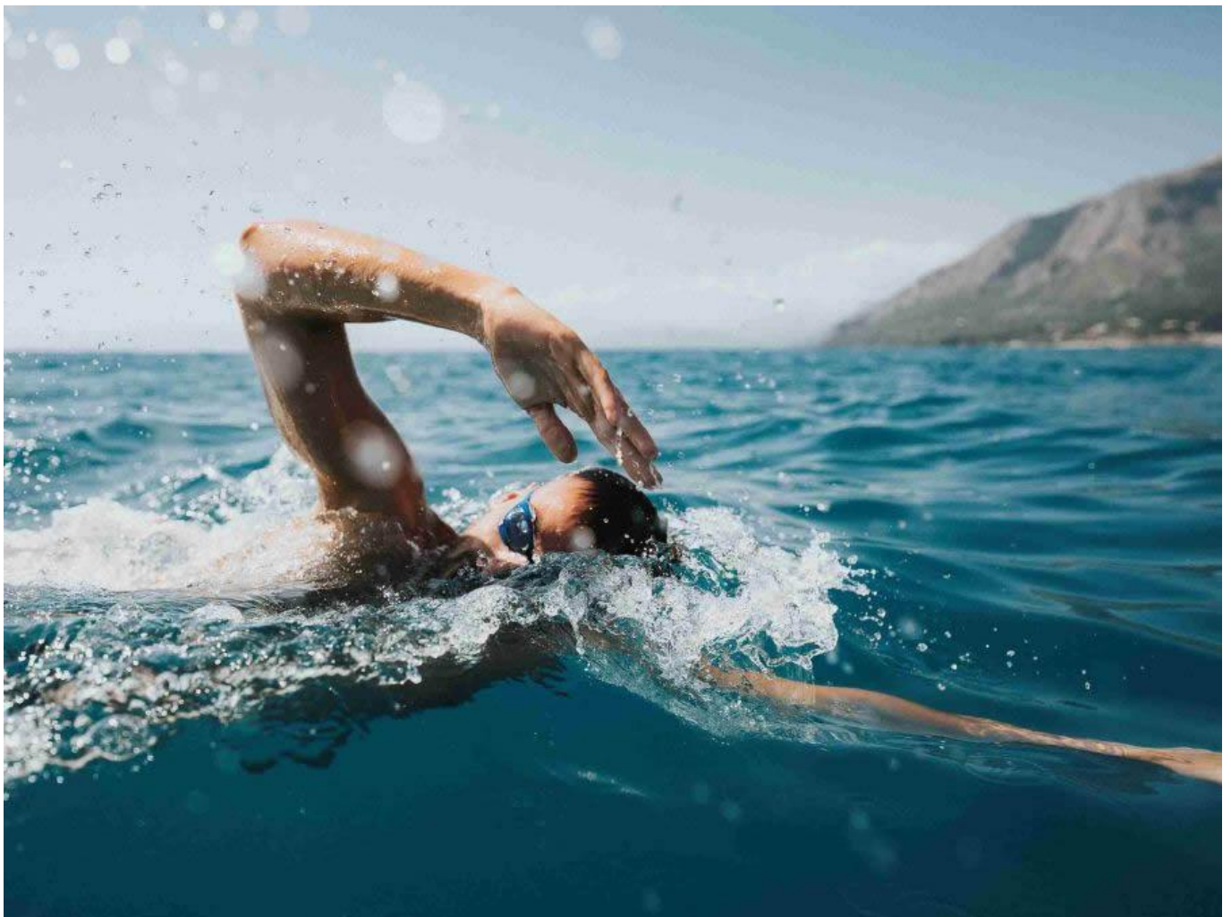
Domenico Acerenza a Maratea.

Perchè visitare la Basilicata? Il video “Basilicata, State of Mind” presentato a Rimini, in anteprima, risponde a questa domanda tramite una sequenza di immagini che raccontano il profondo legame di armonia che si stabilisce tra uomo, storia e natura. Il regista Luca Curto ha perfettamente integrato gli scenari lucani, fatti di bellezza, salubrità e accoglienza, con 5 testimonial d’eccezione , gli sportivi lucani Domenico Acerenza (nuotatore), Francesca Palumbo (schermidora), Terryana D’Onofrio (karateka), Claudio Coviello (danzatore) e Domenico Pozzovivo (ciclista), perfettamente evocativi della bellezza, della salubrità e dell’accoglienza.