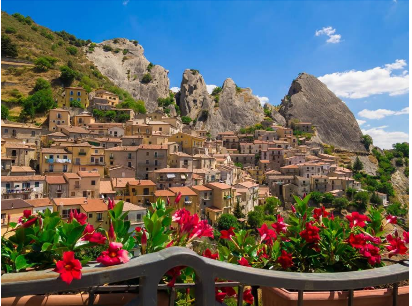
Le Dolomiti Lucane.