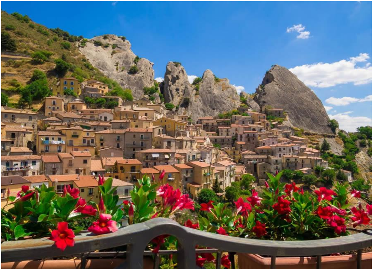
Le Dolomini Lucane.

Ma “Basilicata, State of Mind” non è l’unica novità presentata sul turismo lucano. Nella conferenza stampa al TTG di Rimini, infatti, sono stati illustrati anche il progetto Turismo delle Passioni e i nuovi strumenti di promozione territoriale, come le guide “ Camminare in Basilicata ” e “ Parchi della Basilicata ”, quest’ultima realizzata insieme al Touring Club Italiano , oltre alla seconda edizione di Roots-In , la borsa internazionale del turismo delle radici in programma a Matera il 20 e 21 novembre prossimi .