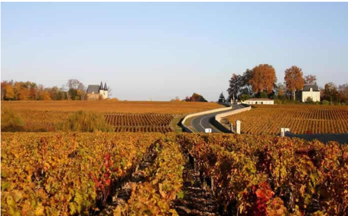
Vigneti di Bordeaux (Foto © www.bordeaux-turismo.it ).

"Bordeaux e vino" è un binomio scontato ma, se possibile, in questo 2020 sarà ulteriormente valorizzato con il più grande evento enoturistico d'Europa. Dal 18 al 21 giugno, infatti, si svolge " Bordeaux Fête le Vin ", un festival che mescola le degustazioni di eccellenti etichette bordolesi alle specialità gastronomiche, con la possibilità di ammirare e visitare i grandi velieri storici ( Info: www.bordeaux-turismo.it ).