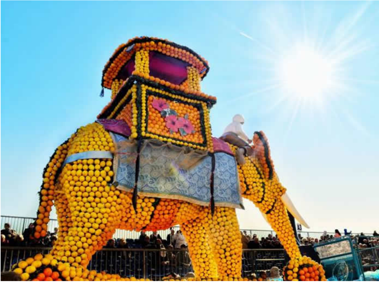
La Festa del Limone di Mentone.

Anche a Mentone, Mauro Colagreco dà sfogo alla sua geniale maestria culinaria nello spettacolare Mirazur , il tre stelle Michelin eletto miglior Ristorante del Mondo secondo The World's 50 Best Restaurant (Info: www.menton-riviera-merveilles.fr ).