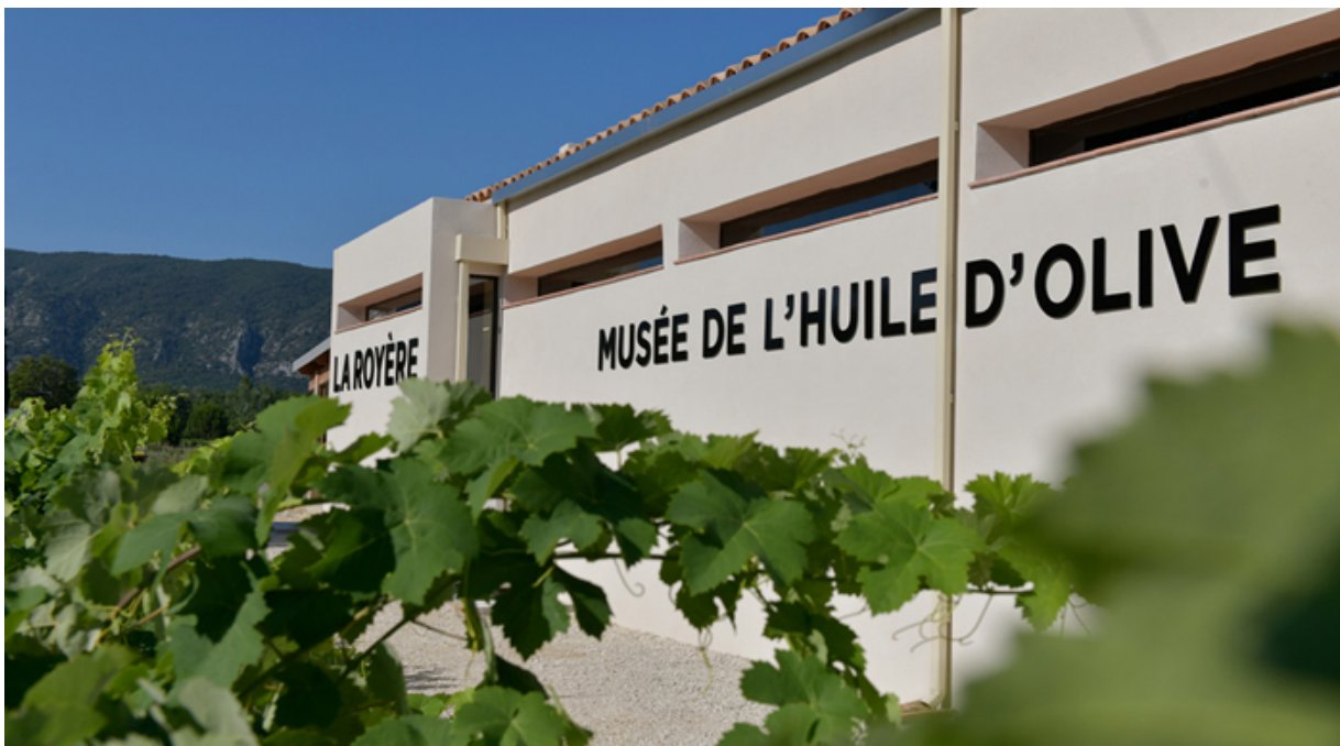
Il Museo dell'oliva a Luberon Coeur de Provence.

Un nuovo museo dell'oliva che unisce olio e vino, le cantine aperte ai wine lover per degustare gli eccellenti vini francesi e i percorsi da attraversare a piedi o in bicicletta nel Parco Naturale Regionale . Queste e tante altre sono le proposte del 2020 nel Luberon Coeur de Provence.