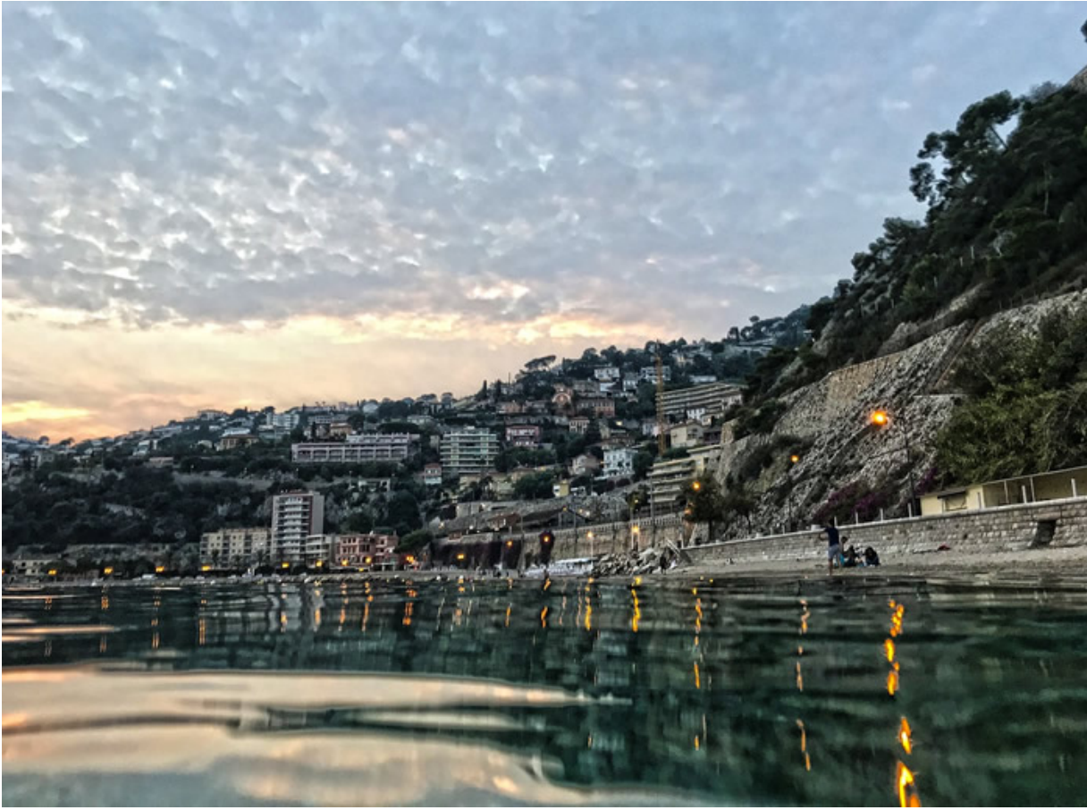
Un panorama di Saint Tropez.

Quest'anno, tuttavia, Saint Tropez vuole diventare una destinazione di eccellenza, se non la prima, della cucina vegana e vegetariana per assecondare le esigenze di un turismo di oltre 5 milioni di visitatori all'anno. Già famosi ristoranti, come "L'acacia" dello Château de la Messardière, "La Cucina" dell'Hotel Le Byblos, la brasserie Sénéquier e l'Hotel de la Ponche, propongono esclusivi e raffinati piatti vegetali (Info: www.sainttropeztourisme.com ).