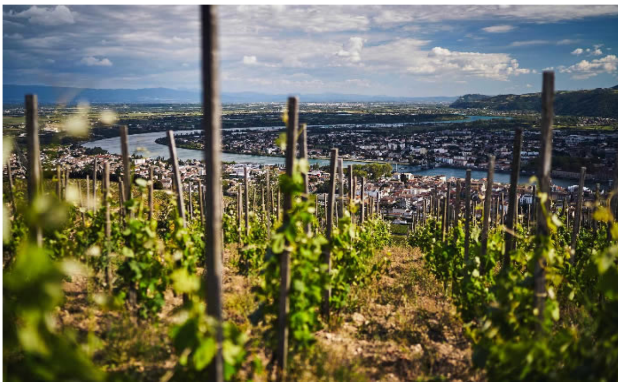
La nuova Valle dell'enogastronomia.

L' Alvernia-Rodano-Alpi è conosciuta per la sua anima verde e per lo spettacolare Parco dei Vulcani ma, in tema gastronomico, la novità dell'anno è il lancio della Valle della Gastronomia che comprende anche la Borgogna-Franca-Contea e Provenza-Alpi-Costa Azzurra. Questa nuova destinazione propone percorsi golosi tra le perle culinarie di queste tre regioni ed è un ottimo pretesto per visitare la Francia nel 2020 (Info: www.valleedelagastronomie.com ).