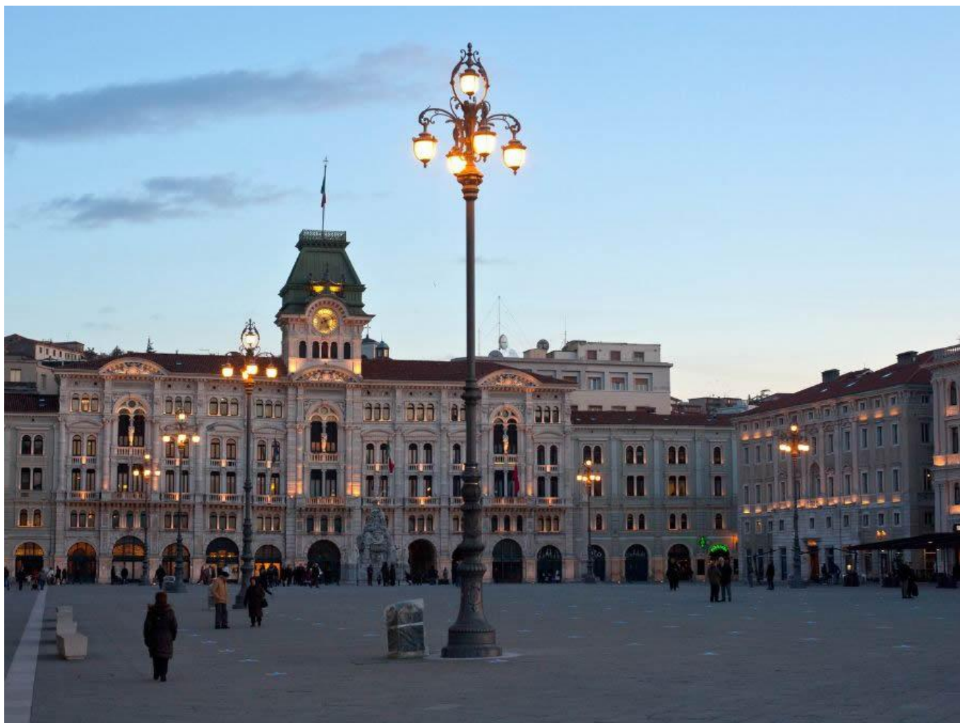
Piazza Unità d'Italia.