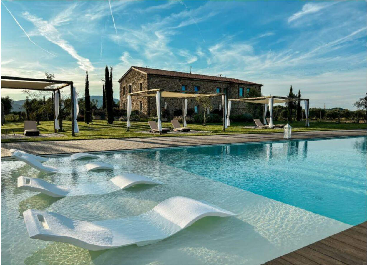
La bellissima piscina della struttura (Foto © Podere Pietravento).

Sembra aver seguito alla lettera questi consigli impliciti Podere Pietravento , che da luglio 2023 accoglie i suoi entusiasti ospiti nel cuore della campagna toscana, a Campiglia Marittima, in provincia di Livorno.