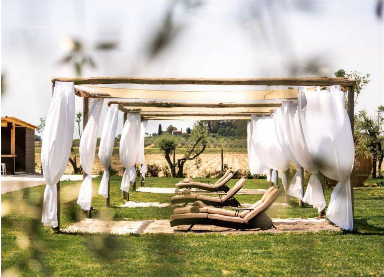
I Gazebo del Podere, fronte piscina.