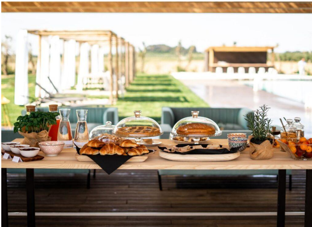
Torte fatte in casa, succhi, marmellate e pane integrale: la colazione.

Pranzo e cena, su richiesta, valorizzano il buono a tavola della Toscana. Da importanti piatti di degustazione con salumi e formaggi del territorio fino a piatti tipici come la Panzanella o le Tagliatelle con ragù di Cinta Senese, poi schiaccie e insalate. Il tutto è accompagnato da una carta di birre artigianali, cocktail o vini di produzione propria! A chiudere? Un'intrigante selezione di amari di aziende locali vicine.