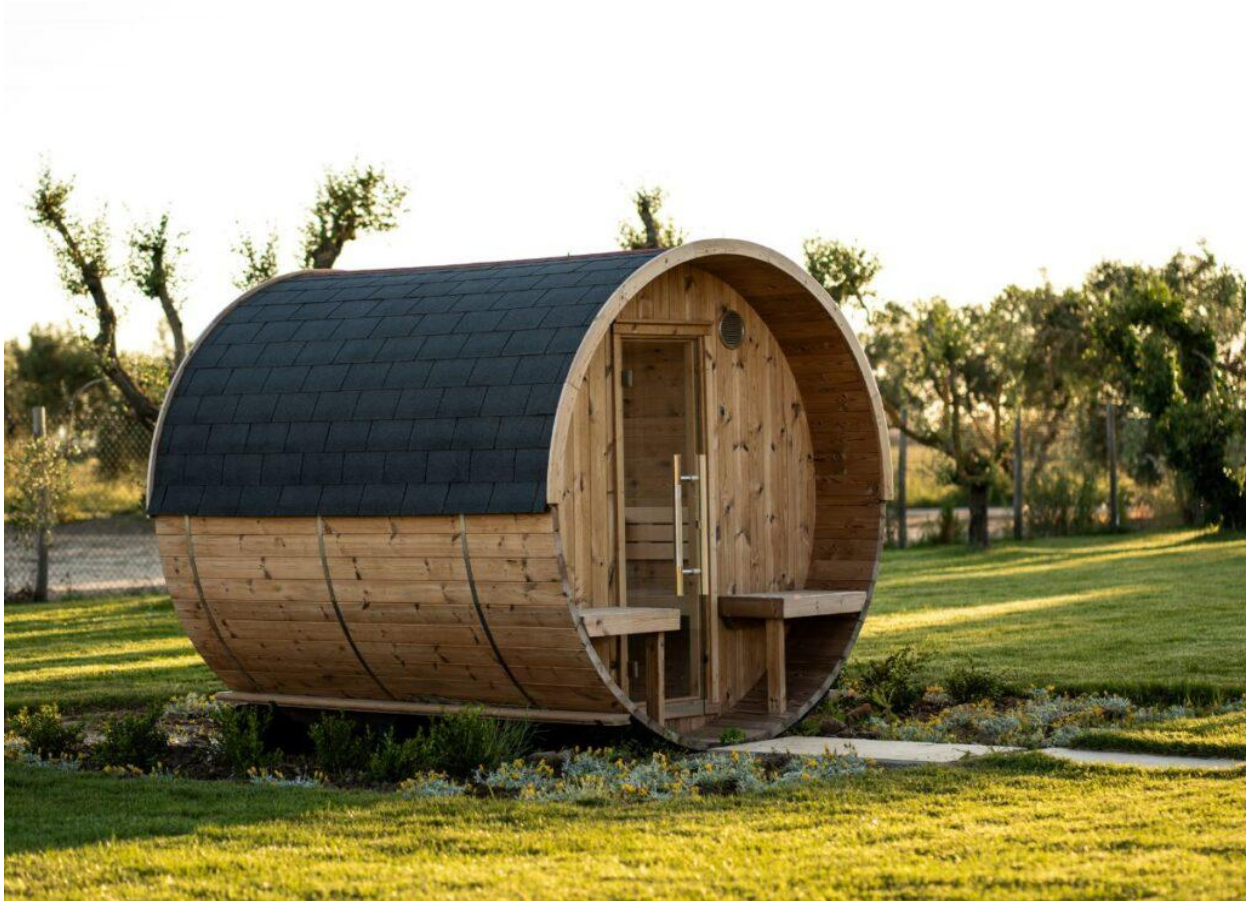
Un'intima sauna per rilassarsi o rigenerarsi.