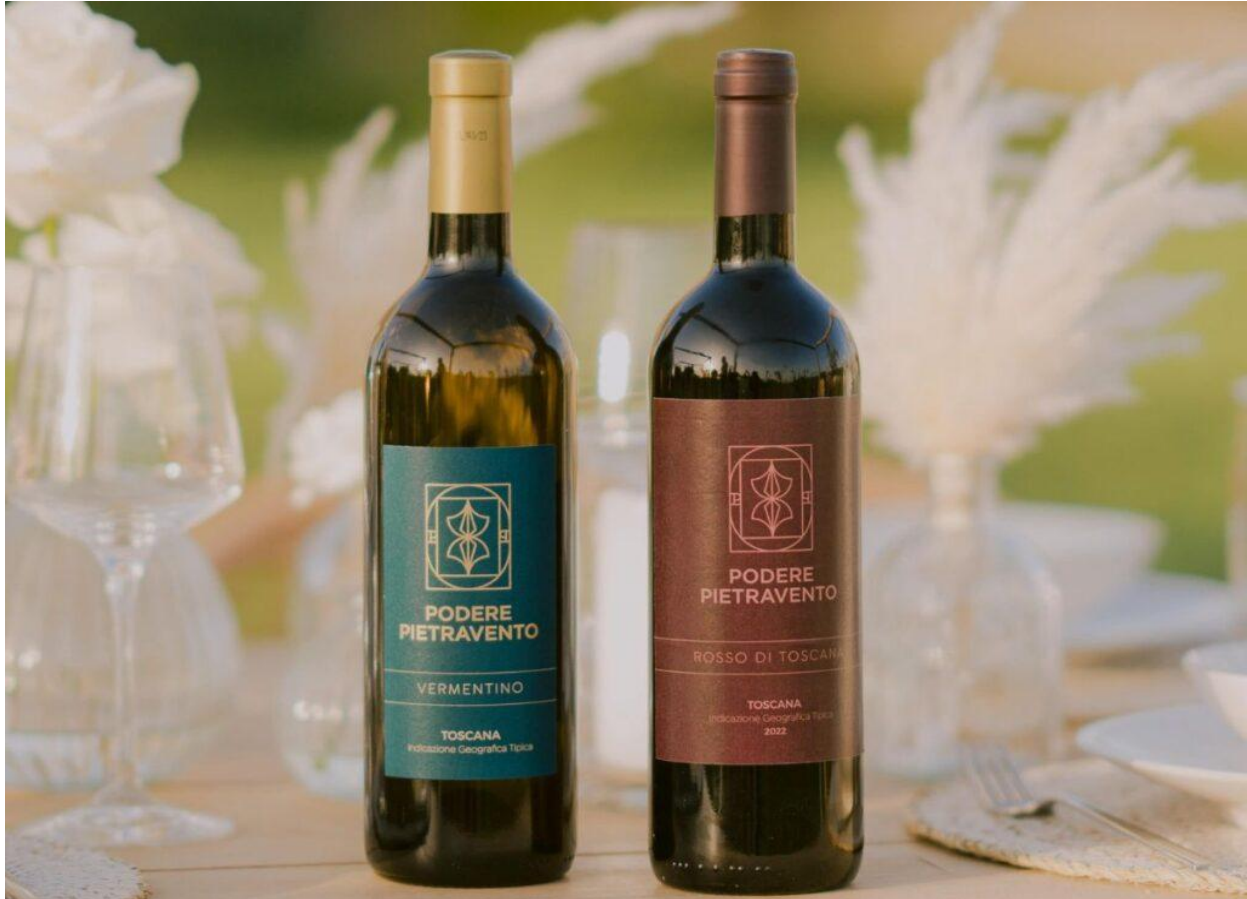
Due etichette prodotte da Podere Pietravento.

Se ci si pensa, Podere Pietravento si presenta come il luogo ideale per prendersi una pausa . Un mondo a sé lontano dal caos urbano dove trascorrere una piacevole giornata tra relax, bagni, letture e, perché no, aperitivi serviti direttamente al proprio gazebo.