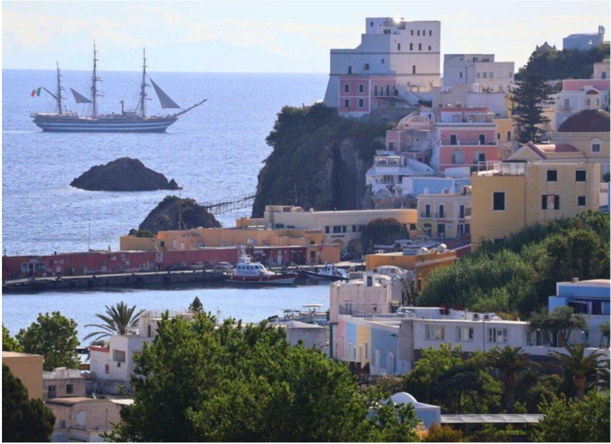
L'Amerigo Vespucci a Ponza.