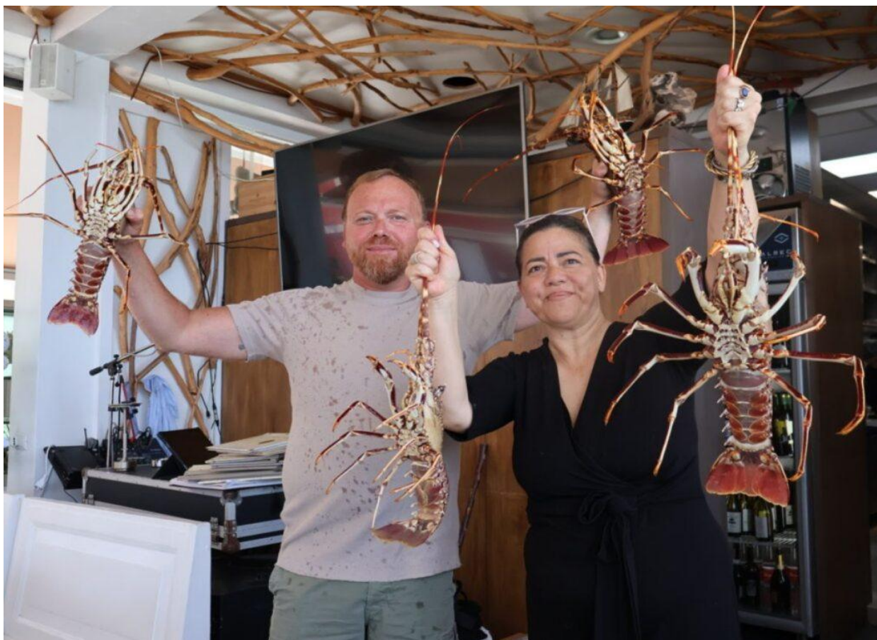
Il Rifugio dei naviganti (Foto © Dario Raimondi).