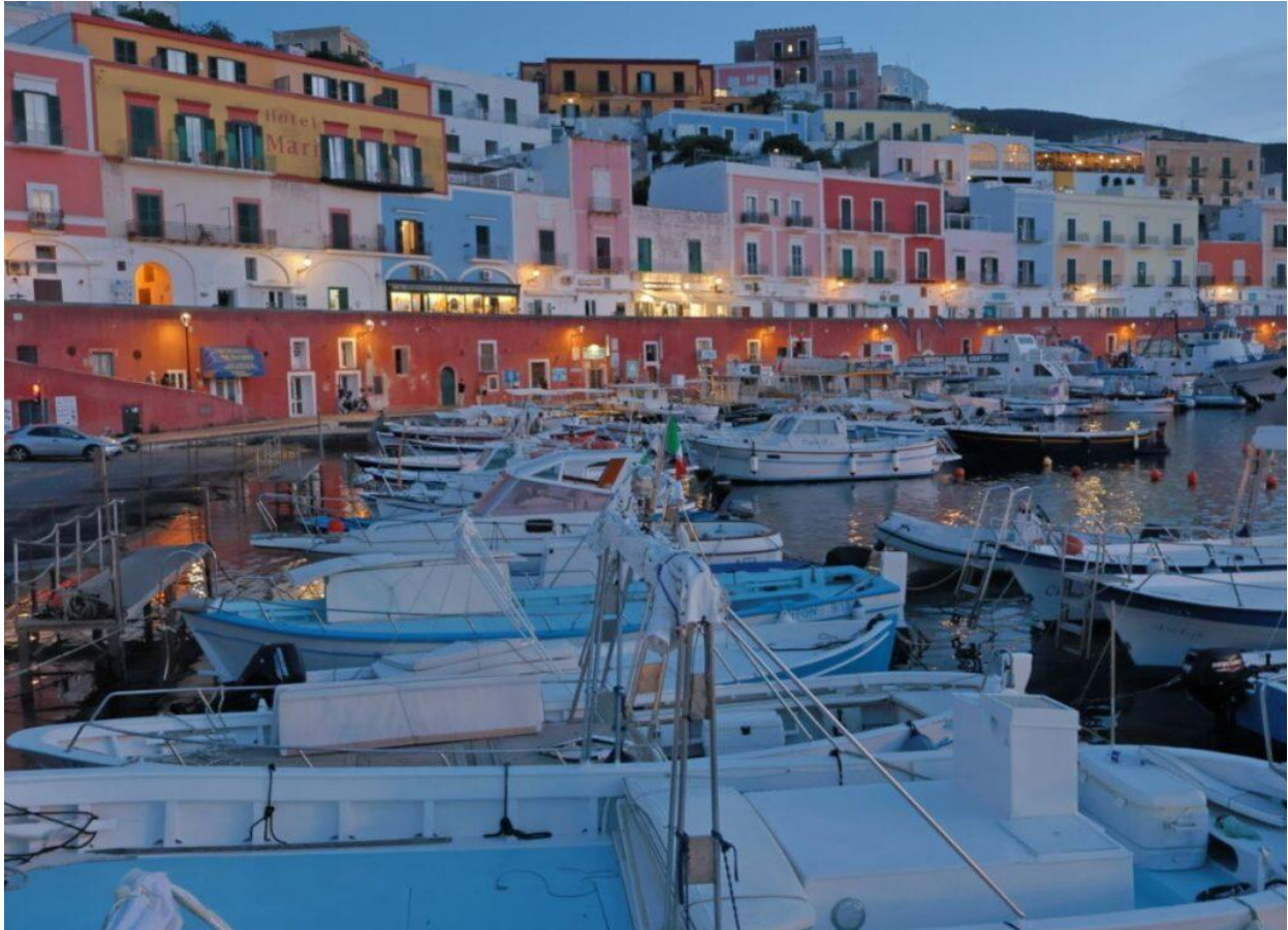
Il Porto di Ponza.