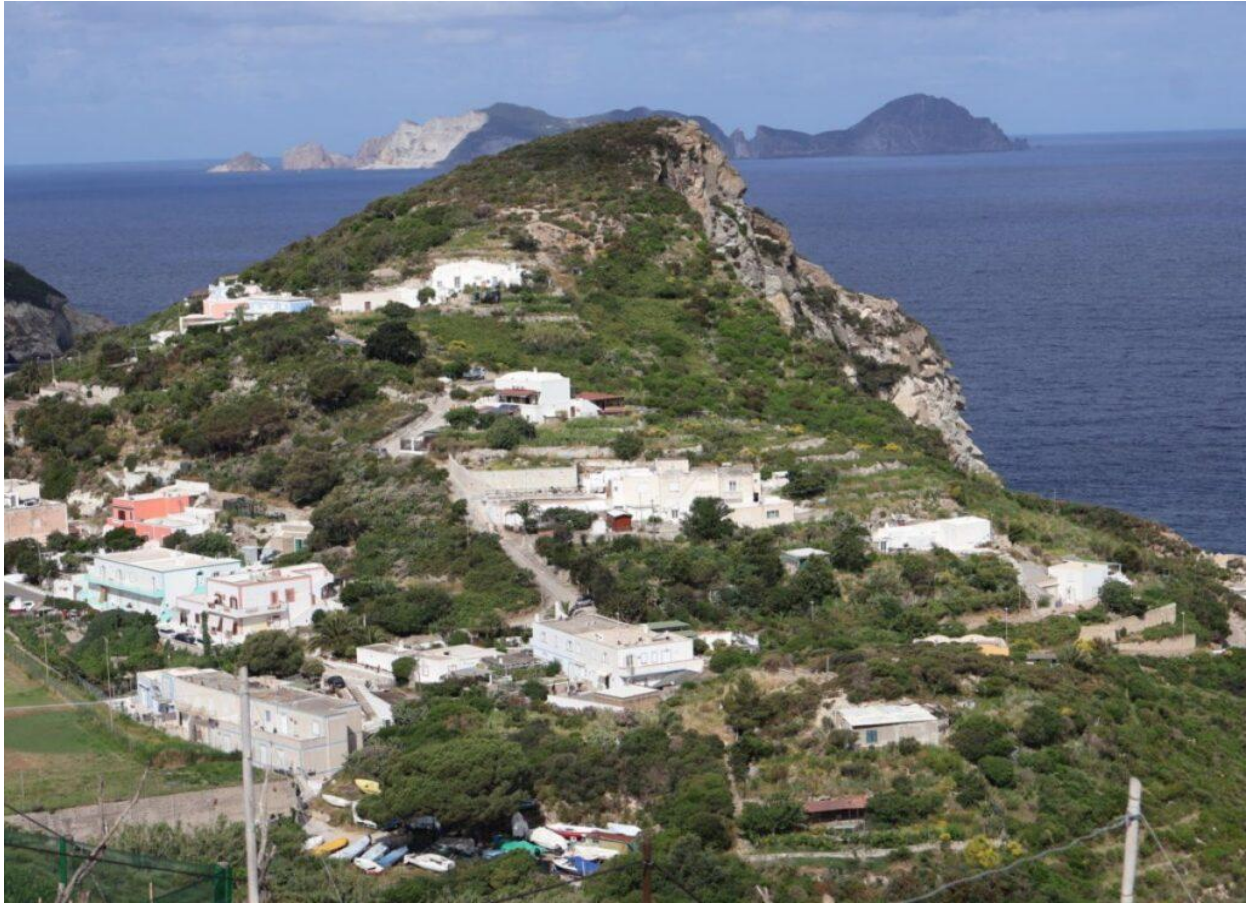
L'Isola offre diversi percorsi di trekking.