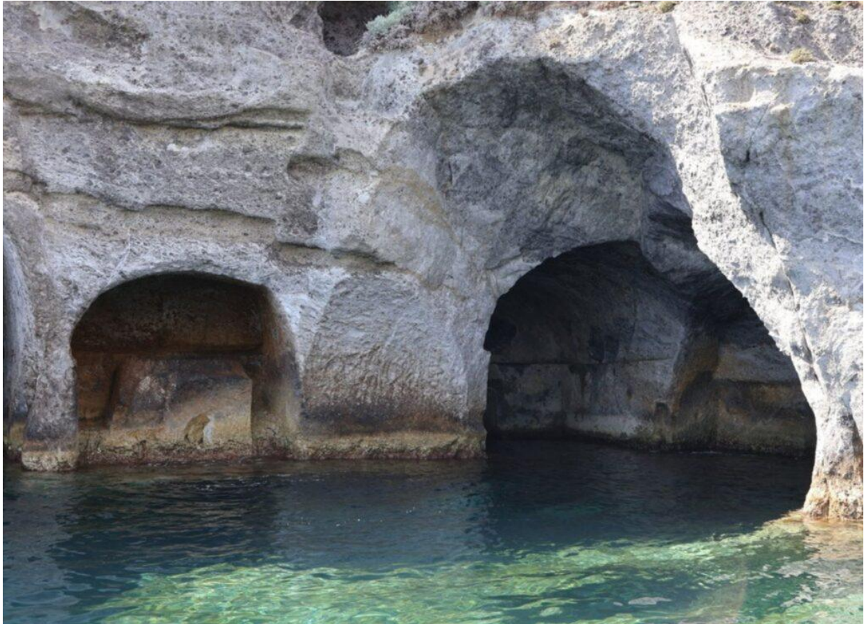
Le grotte di Pilato (Foto © Dario Raimondi).