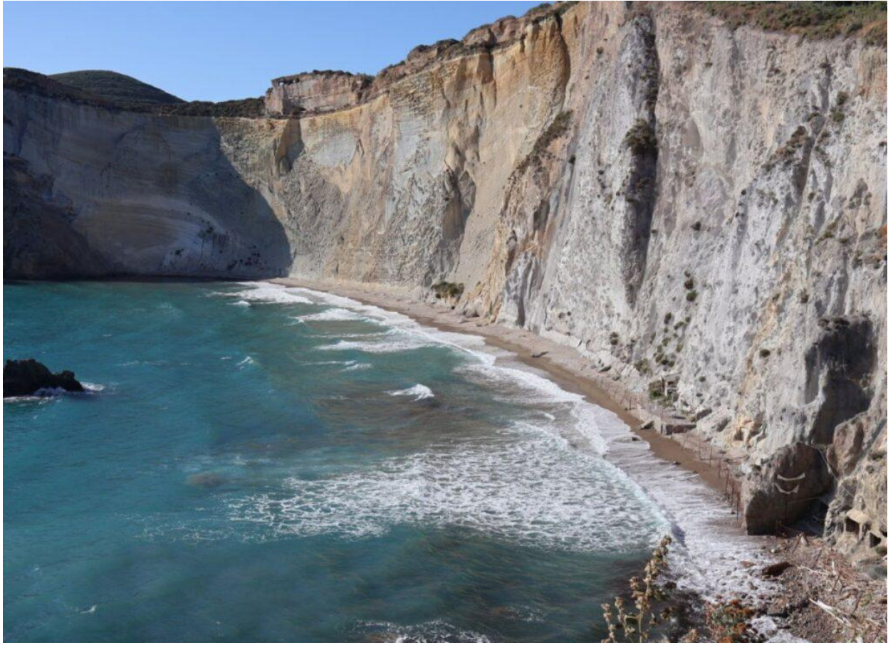
La spiaggia di Chiaia di Luna.

Le grotte di Pilato poi – che appartenevano alla sontuosa villa romana della figlia dell'imperatore Augusto i cui resti sono tutt'ora visibili – sono un complesso di caverne scavate a livello del mare: le cinque vasche ricavate nella roccia sono collegate tra di loro da cunicoli sottomarini (in parte erano coperte, in parte aperte) e servivano per lo più per l'allevamento delle murene, pesci considerati sacri dai romani. Meraviglie che scopriremo in un'intensa giornata tra le acque cristalline grazie alle barche di Ponzesi per scelta (Info: gite.ponzesiperscelta.it ).