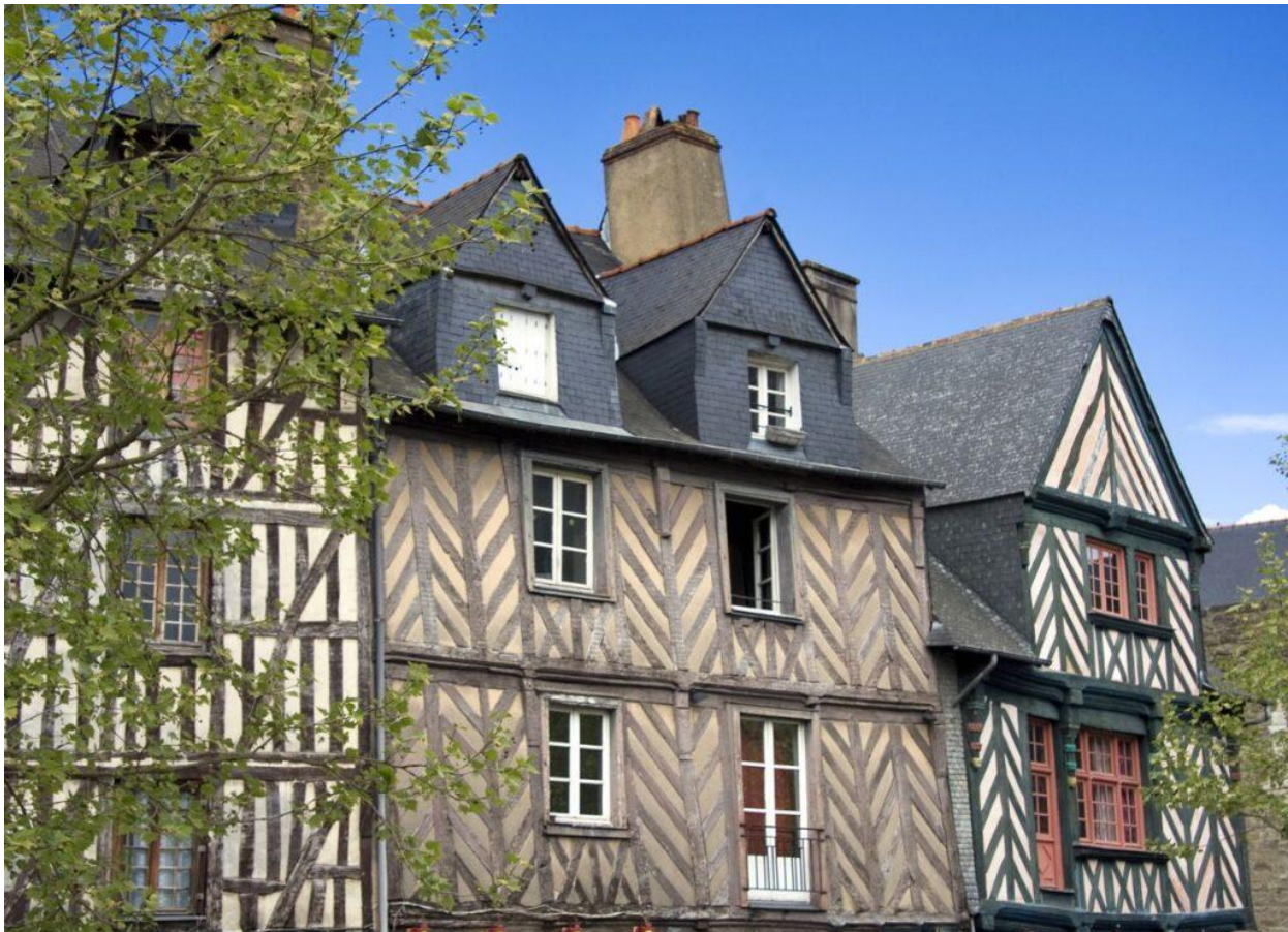
Rennes è famosa per le sue case a graticcio.

Famosa per le case a graticcio (286 case medievali in legno) e uno straordinario Parlamento (XVII secolo), Rennes animerà l'estate 2025 inaugurando la mostra " Les yeux dans les yeux " (dal 14 giugno al 14 settembre), ospitata nel Convento dei Giacobini (90 opere tra dipinti, foto e sculture della Collezione Pinault). Strategica per raggiungere Parigi (a 1 ora e 25 minuti in TGV), la città bretone, verde e festaiola, propone itinerari green lungo i fiumi, nei boschi, oppure la ciclabile che corre lungo l'Atlantico. Info: www.tourisme-rennes.com