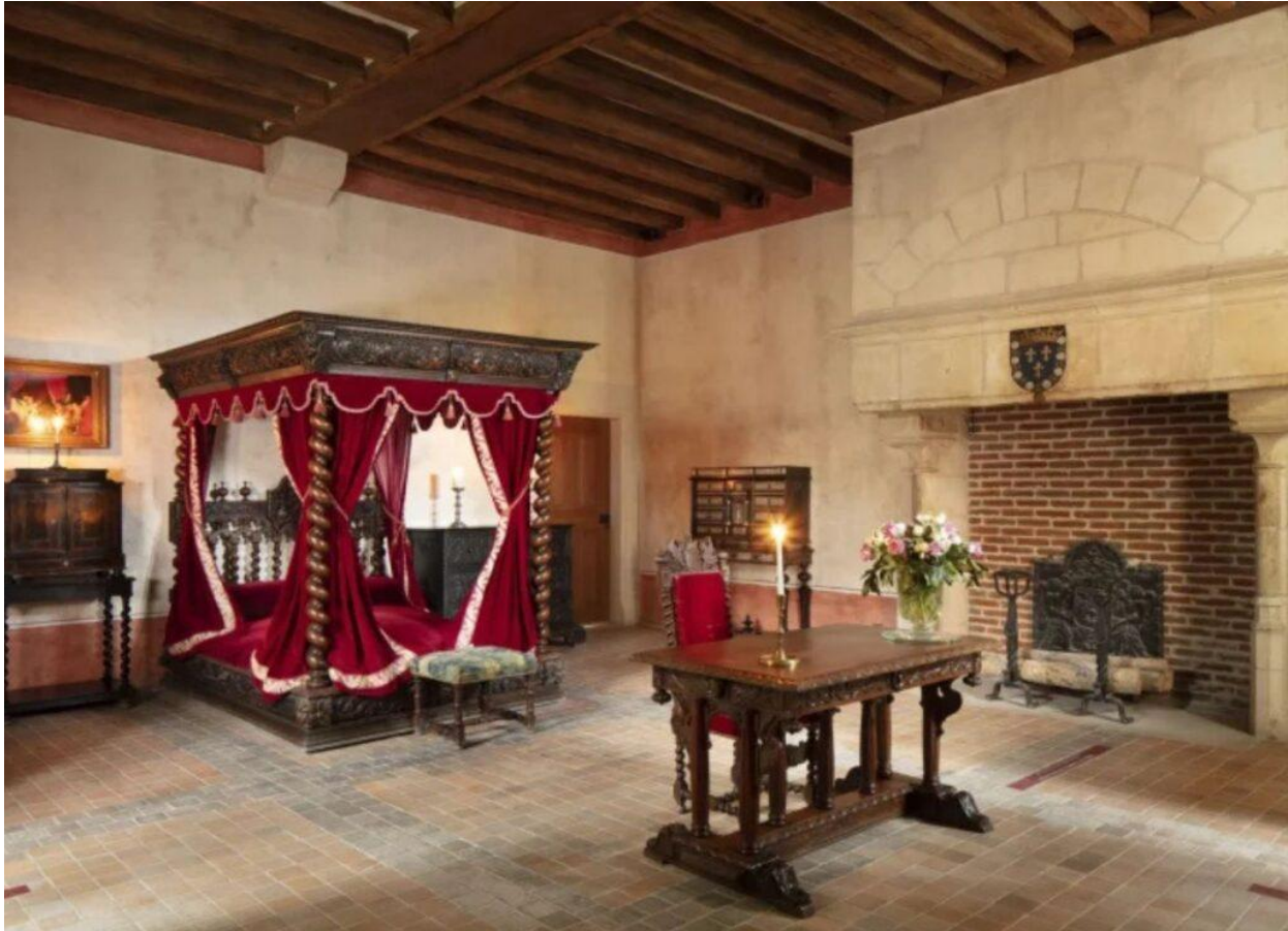
Il Castello di Clos Lucé fu la dimora di Leonardo Da Vinci fino alla morte.

Maestoso e con una bella vista sulla Loira, il Castello di Chaumont riunisce gusto, arte e natura. La tenuta – 32 ettari tra castello, parco e scuderie – ospita ogni anno il Festival Internazionale dei Giardini (da aprile a novembre), punteggiati di creazioni artistiche. Un luogo magico, dove bellezza e natura dialogano in perfetto equilibrio, regalando splendide visioni: giardini perenni, collezioni naturali, opere inedite di artisti di fama internazionale, collocata in diversi spazi: Castello, Galleria del Fienile, Asineria, Scuderia). E per gli ospiti che vogliono gustare l'atmosfera della tenuta, il Bois des Chambre , hotel des Arts and Nature, facilita l'esperienza sensoriale, che il Grand Chaume (ristorante interno) realizza proponendo una cucina tipica e raffinata. Info: www.domaine-chaumont.fr