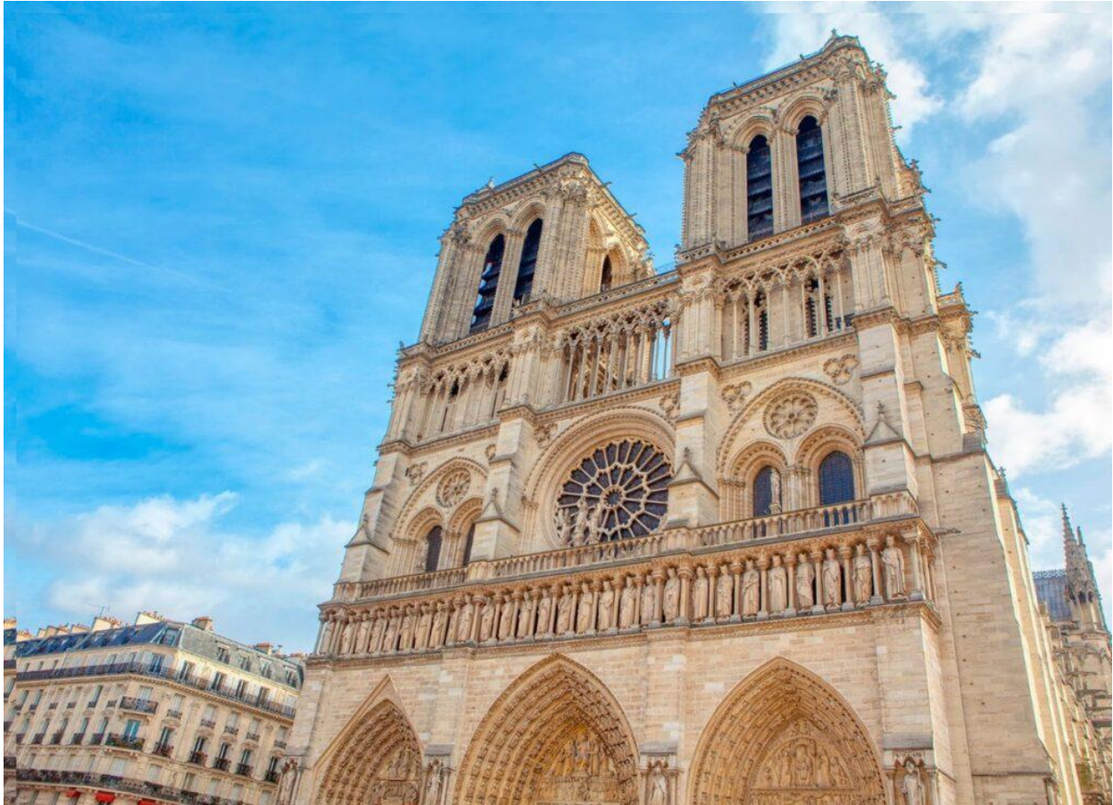
La Cattedrale di Notre Dame.

pubblico delle Torri di Notre Dame . Romantica e vivace, la città della Luce brilla a primavera, quando la mitezza del clima facilita le escursioni o le gite in battello, gli assaggi nelle brasserie, la socialità e lo shopping.