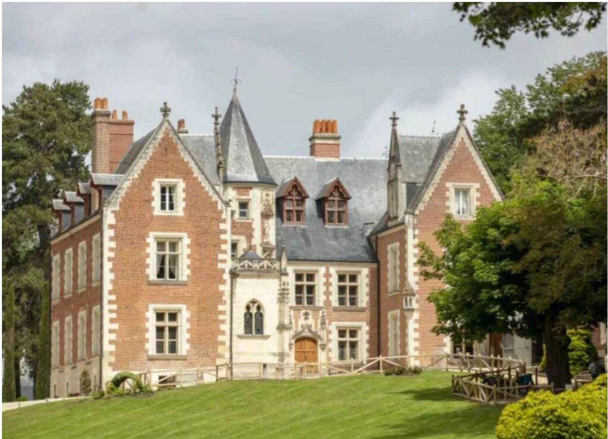
Il Castello di Clos Lucé

Il mondo visionario di Leonardo Da Vinci , appare in tutta la sua genialità nel Castello di Clos Lucé (sua dimora fino alla morte avvenuta nel maggio 1519), che ospita installazioni, macchine a grandezza naturale e un ponte girevole. Il percorso, in tre tappe, entra nell'intimo (visitabili gli appartamenti e il laboratorio) benchè siano le originali rappresentazioni a conquistare il pubblico. Novità per l'estate 2025, la mostra temporanea "Leonardo da Vinci e la biomimetica. Trarre ispirazione dagli esseri viventi" dal 7 giugno all'11 settembre. Info: www.vinci-closluce.com