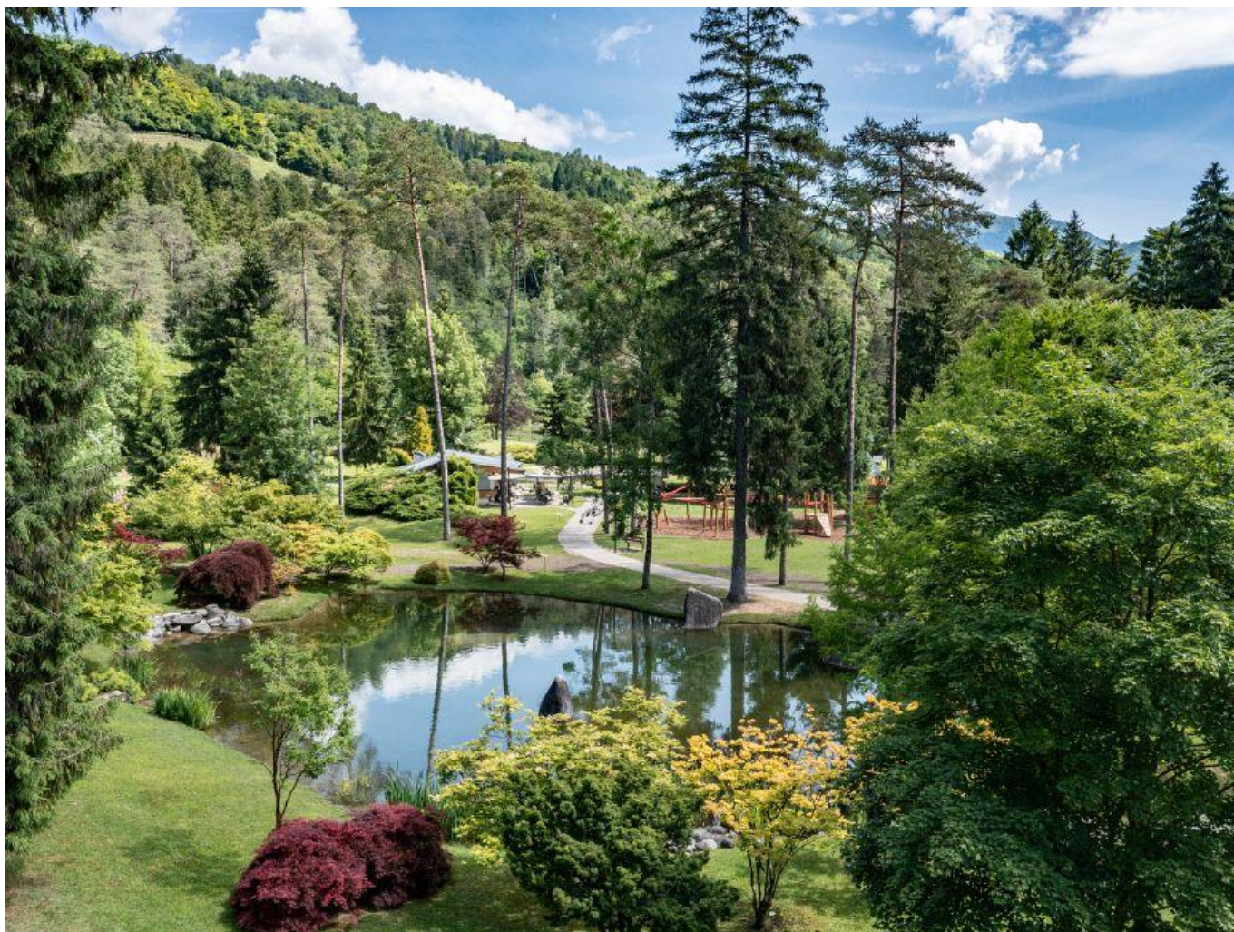
Il grande parco termale di 14 ettari.

Una passeggiata guidata consente di riconnettersi ai piaceri semplici della vita: camminare a piedi nudi sull'erba, ascoltare il gorgoglio dell'acqua, osservare il volo degli uccelli, o percepire con le dita la superficie della corteccia di un albero. Piccole emozioni sensoriali dimenticate che possono ridurre stress e depressione, abbassare la pressione sanguigna, la frequenza cardiaca, agire sul nostro sistema immunitario potenziandone la funzionalità.