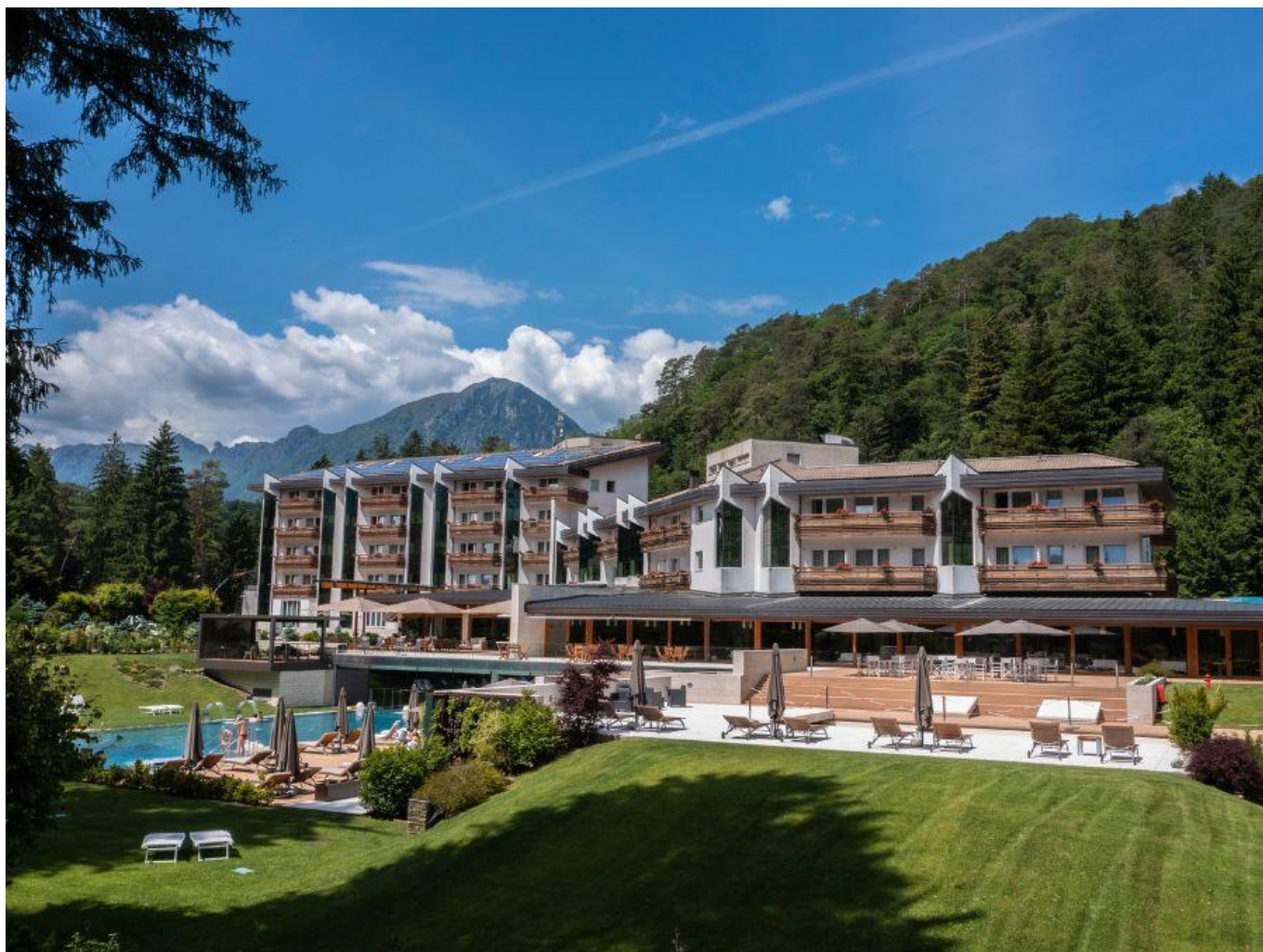
Una panoramica esterna della struttura.