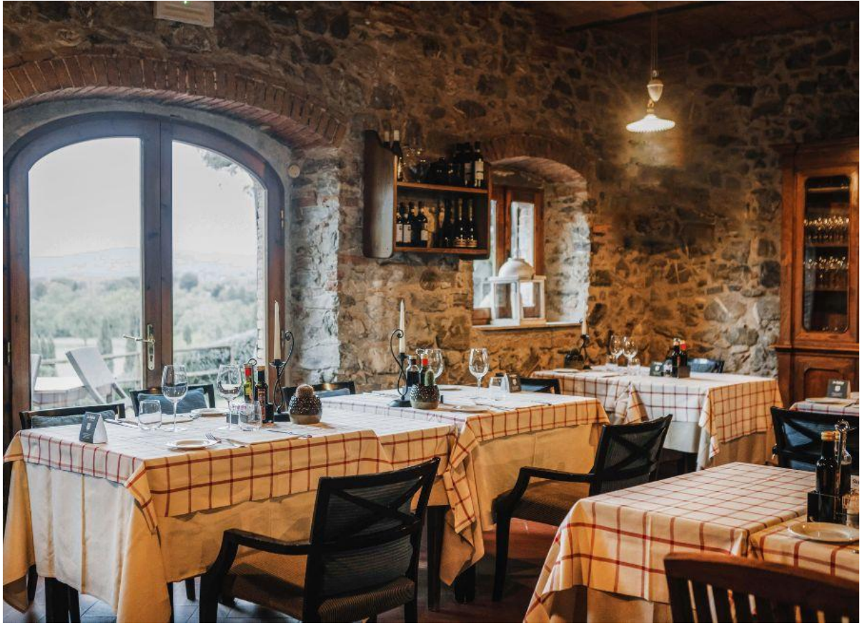
Trattoria La Stellata, all'interno delle Terme di Saturnia.