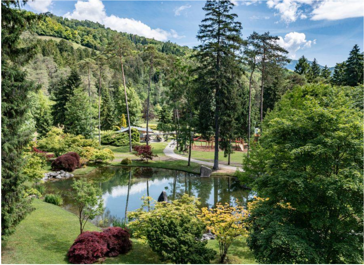
Il grande parco termale di 14 ettari.

Una passeggiata guidata consente di riconnettersi ai piaceri semplici della vita: camminare a piedi nudi sull'erba, ascoltare il gorgoglio dell'acqua, osservare il volo degli uccelli, o percepire con le dita la superficie della corteccia di un albero. Piccole emozioni sensoriali dimenticate che possono ridurre stress e depressione, abbassare la pressione sanguigna, la frequenza cardiaca, agire sul nostro sistema immunitario potenziandone la funzionalità.