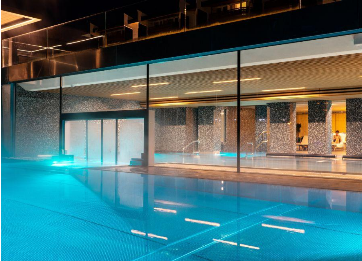
Una delle piscine, per relax e per trattamenti terapeutici.