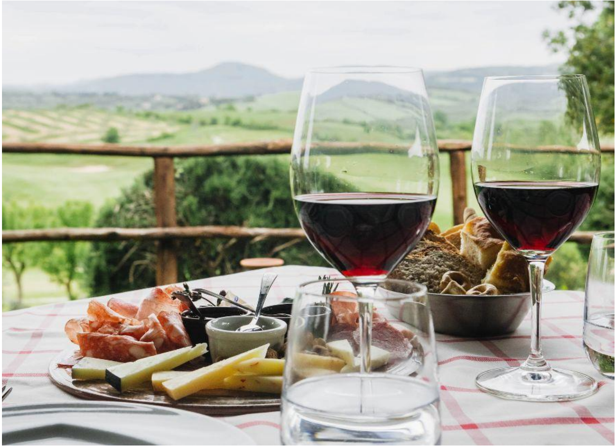
Un menu all'insegna della buona cucina toscana.