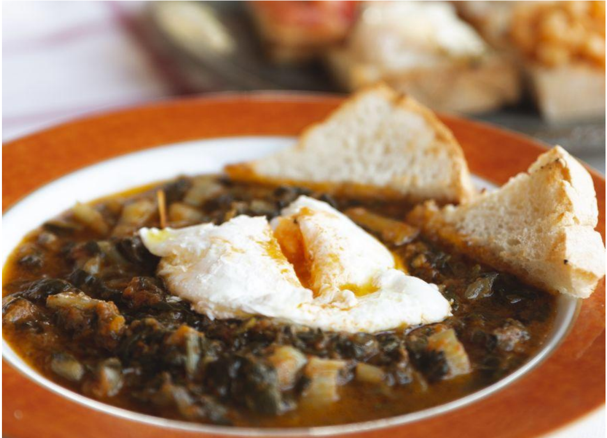
Uno dei buoni piatti del menu.