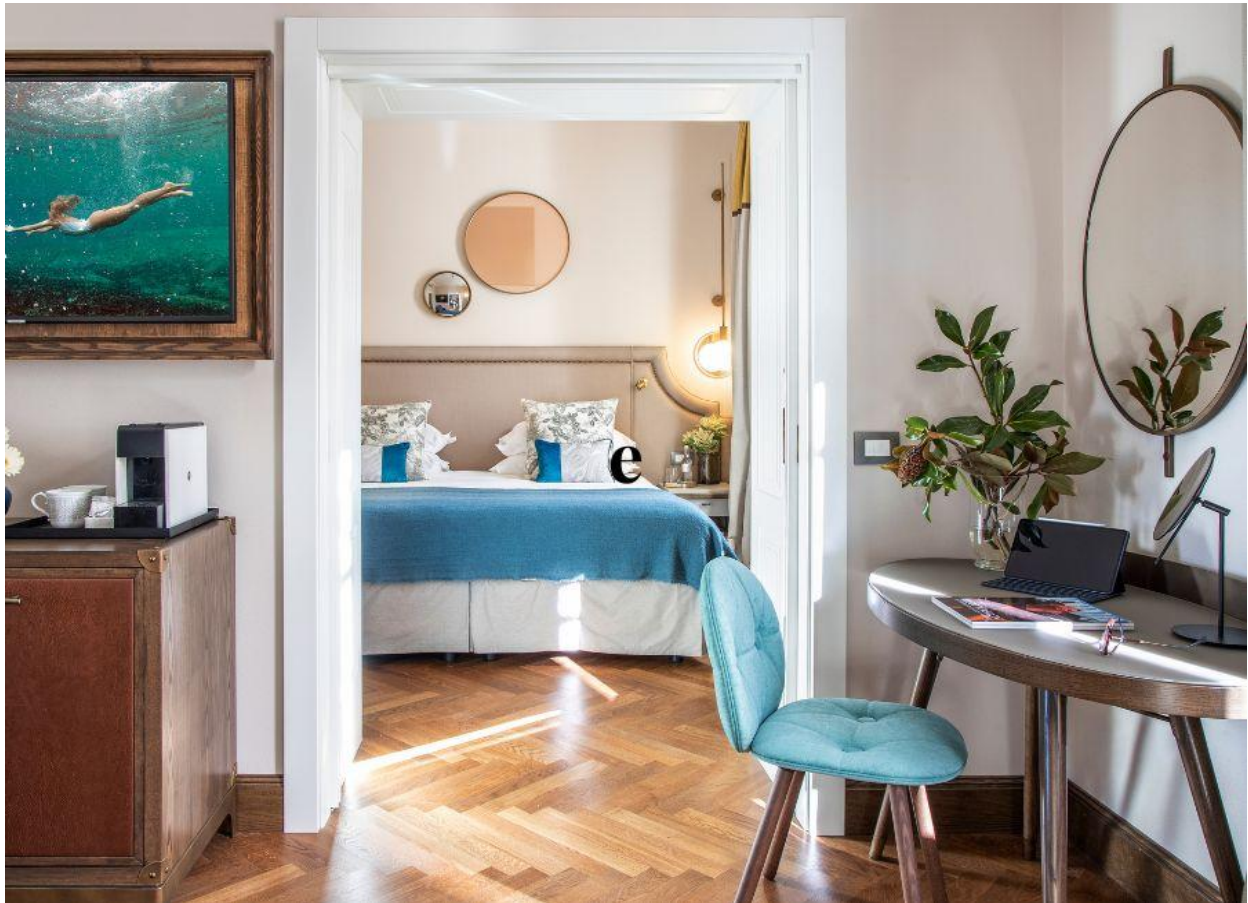
Una delle suite dell'elegante hotel 5 stelle.

Last but not list, Terme di Saturnia è un luogo Pet Friendly : gli amici a quattro zampe sono benvenuti, viziati e coccolati.