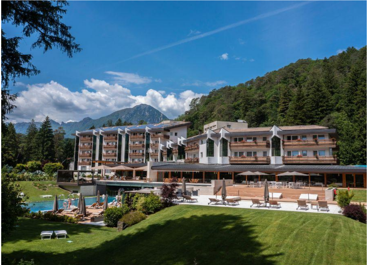
Una panoramica esterna della struttura.