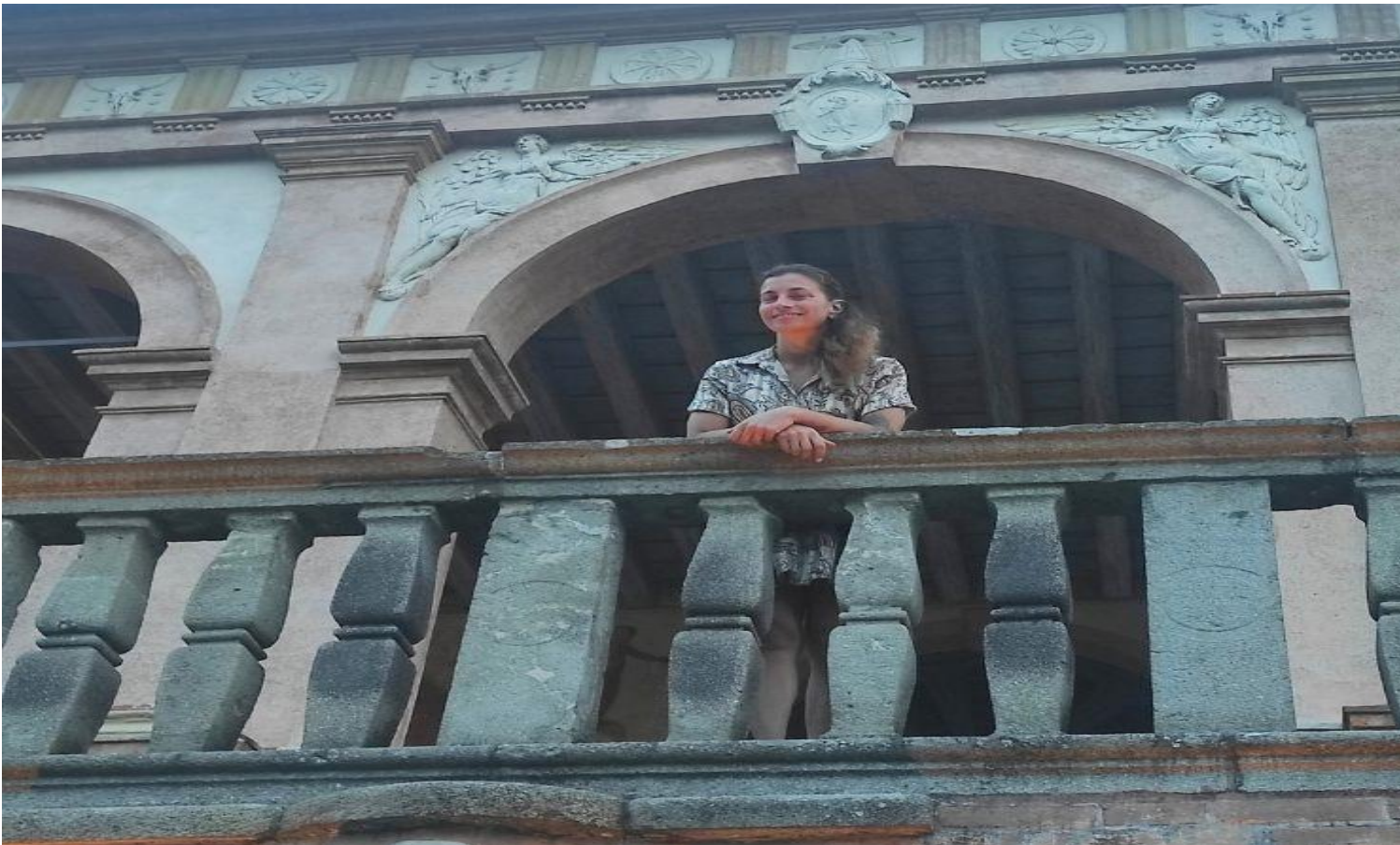
Villa dei Vescovi.

Il concepimento dell'opera fu affidato nel primo '500 al veneziano Alvise Cornaro da parte del Vescovo di Padova che voleva creare un circolo intellettuale raccolto attorno al valore del paesaggio e fu progettata dall'architetto veronese Falconetto. La Villa è giunta intatta fino ai giorni nostri e ha conservato nel tempo una preziosa armonia con l'ambiente circostante , tratto ribadito dall'ampio ciclo di affreschi del pittore fiammingo Lambert Sustris.