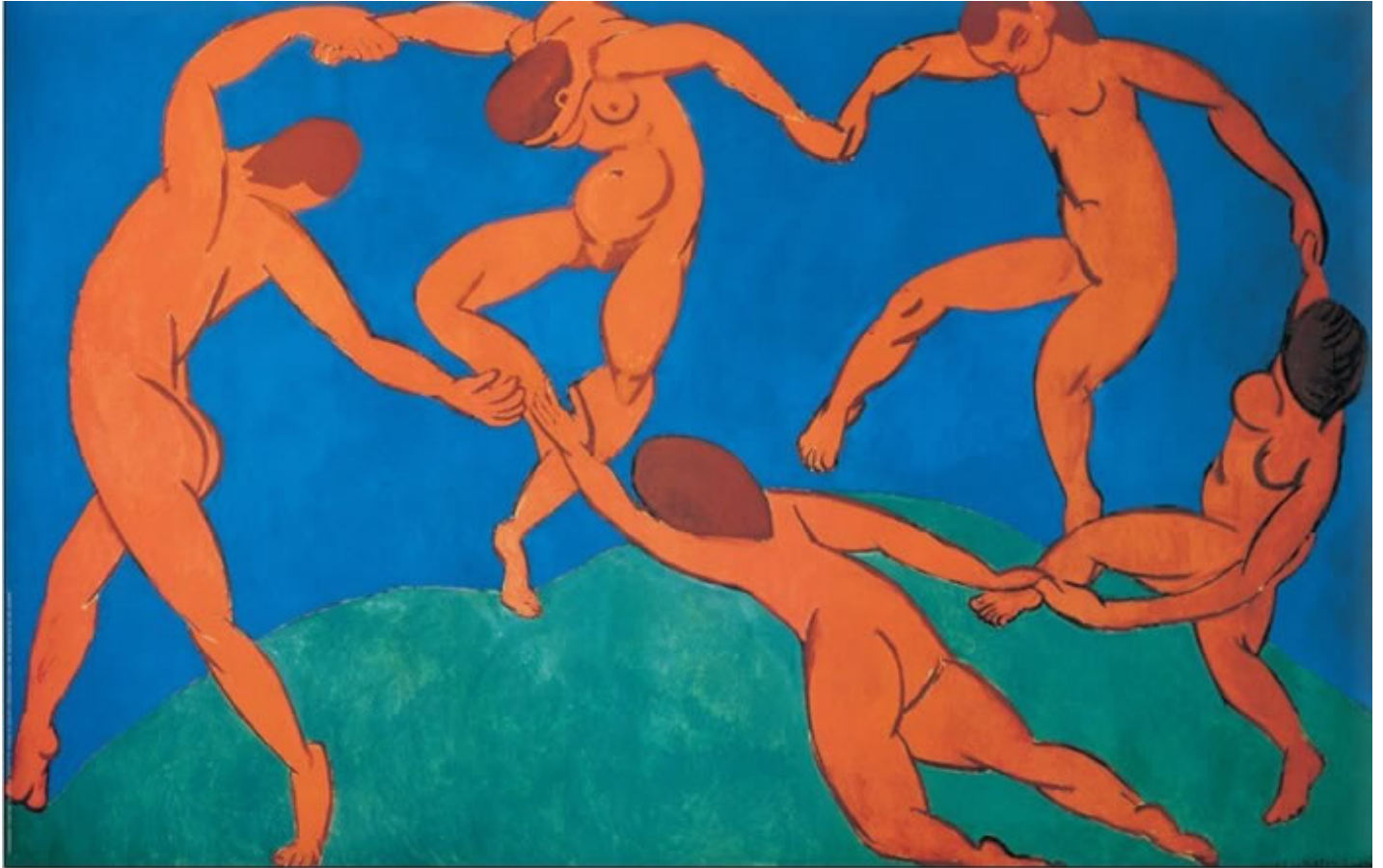
“La Danza” di Henri Matisse (1910).