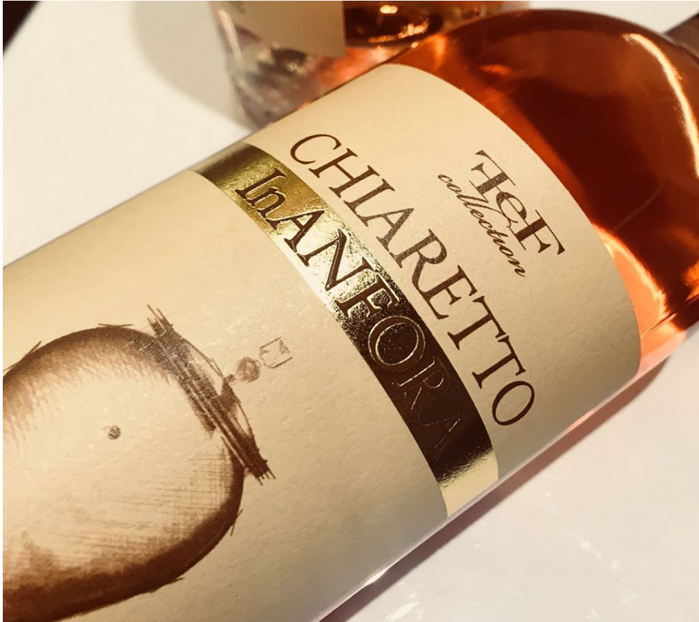
Il Bardolino Chiaretto in Anfora.

Che simpatico progetto è il Bardolino Chiaretto in Anfora , firmato da Zeni1870 . Un'etichetta appena nata all'interno della gamma enologica della storica cantina di Bardolino. Per la precisione, questa interpretazione del Bardolino Chiaretto Doc rientra nella FeF Collection , edizione limitata presentata in anteprima al Vinitaly 2019.