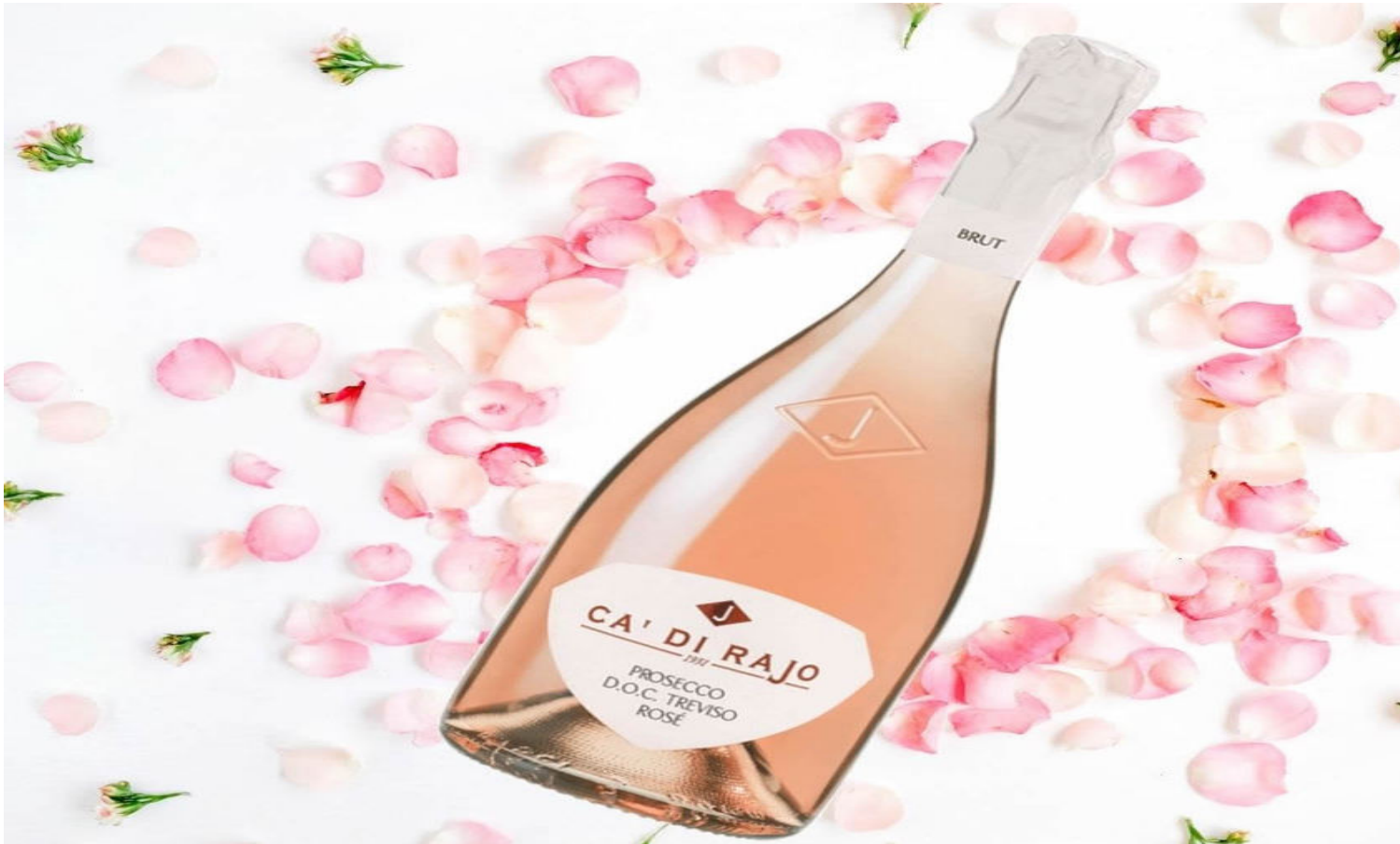
Prosecco Doc Treviso Rosé millesimato 2019 (Foto © La Gazzetta del Gusto).

In un periodo come quello che stiamo attraversando, la briosità e sbarazzina finezza di un calice di vino non può che aiutare a rendere meno pressanti routine pandemiche. In più se aggiungiamo la curiosità di farsi raccontare la storia, tutta da scrivere, di un prodotto che sta iniziando i suoi primi, concreti, veri e riconosciuti passi nel mare magnum del mercato enoico nazionale e internazionale, quella del Prosecco... allora la sfida è ancora più entusiasmante. Si badi bene, questa non è una provocazione o un'affermazione da neofita del vino, chiariamolo subito, perchè in questo caso stiamo parlando della versione Rosé.