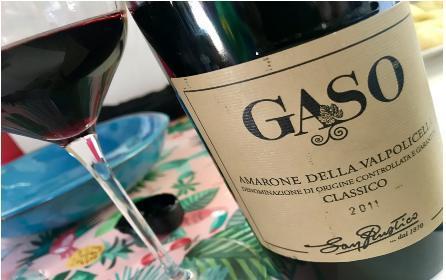
Gasò: Amarone della Valpolicella Classico 2011 (Foto © Riccardo Isola).

È sempre tempo per un buon Amarone della Valpolicella . Se poi la firma è San Rustico allora andiamo sul sicuro. Dopo la degustazione di una maestoso ed elegante 2007 , ci avviciniamo ai giorni nostri toccando il 2011.