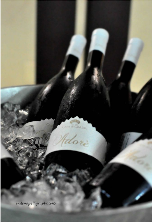
Adorè Casa di Grazia – Moscato bianco.

Si chiama Adorè quasi a ricordare il suo colore, le uve da cui deriva, la luce che emana la sua terra, la Sicilia. Si tratta del Moscato Bianco dell'azienda Casa di Grazia , sita a Gela nei pressi del Lago Biviere, particolarissimo lago salato, ricco di pesce e di uccelli acquatici, che da secoli attira appassionati cacciatori ed amanti della pesca.