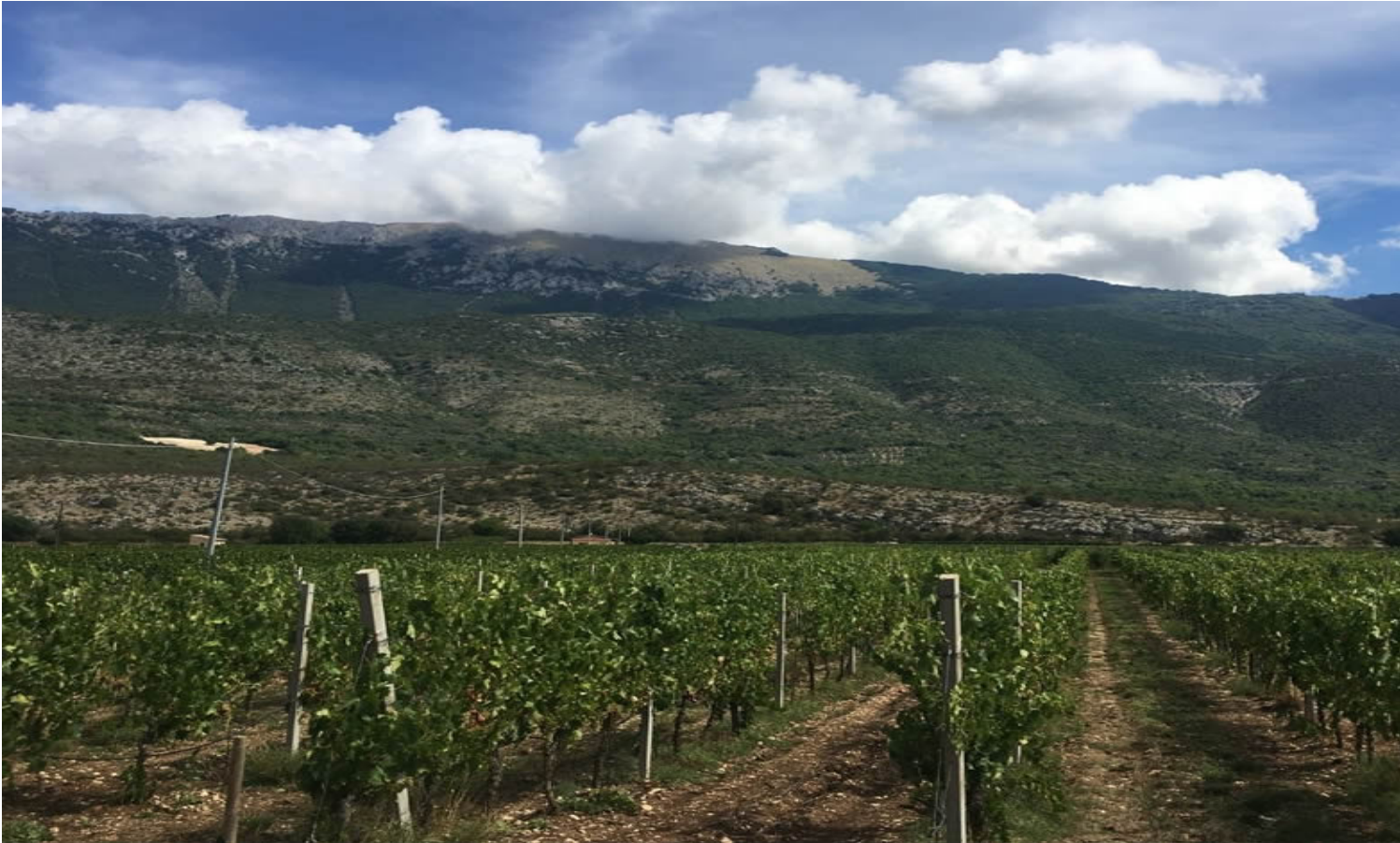
I vigneti di Cataldi Madonna a Ofena, L'Aquila (Foto © Antonio Lodedo).

Riparata dal Monte Bolza e vigilata dai più alti Calderone e Corno Grande del Massiccio del GranSasso, la Piana di Ofena (AQ), è un altipiano di circa 40 km quadrati incastonato nel saliscendi delle colline abruzzesi che si apre a est verso la provincia di Pescara.