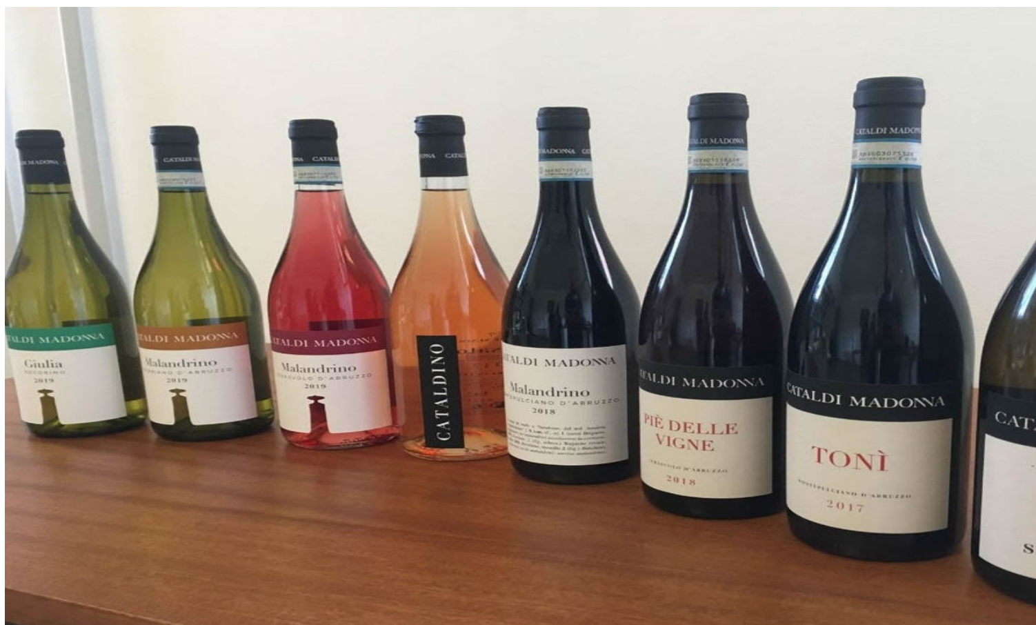
Le etichette prodotte da Cataldi Madonna.

Il Pecorino di casa Cataldi Madonna è un vino decisamente sfacciato, con profumi preservati ed integri anche in bottiglia e che si presta all'invecchiamento grazie alla spalla acida ed al tenore alcolico.