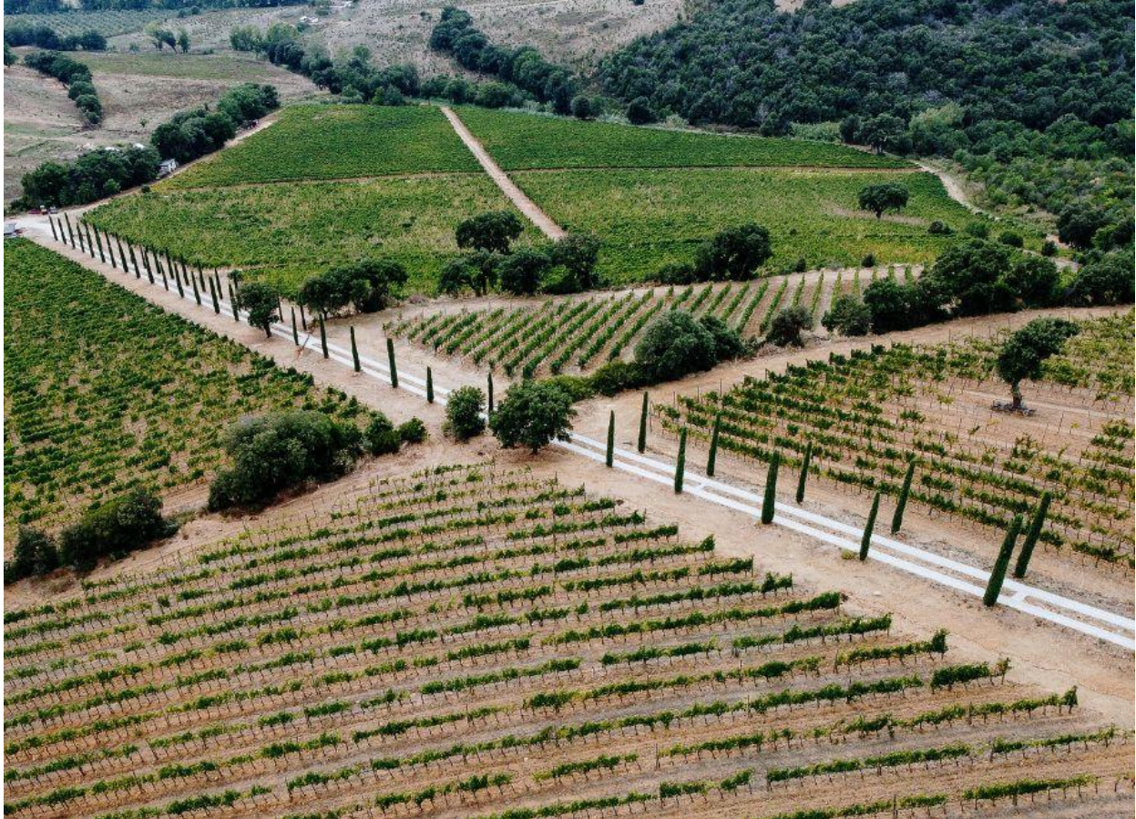
Un panorama della Maremma.

Nell'areale del Morellino di Scansano la 2023 è stata un'annata complessa , nella quale si sono registrate piogge continue fino a giugno inoltrato; e qui ha fatto la differenza la capacità dei viticoltori di gestire l'annata. I problemi di peronospora sono stati contenuti e non hanno comportato perdite eccessive. Il 2021 è stato caratterizzato da un'importante gelata seguita poi da un'estate siccitosa, un anno oggettivamente difficile dal punto di vista climatico.