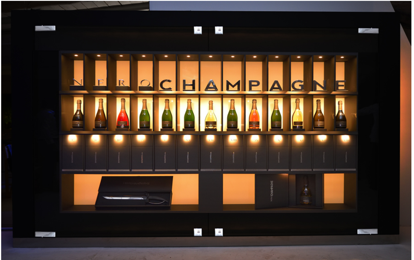
La Collezione Nero Champagne comprende 13 etichette (Foto © Nero Champagne).